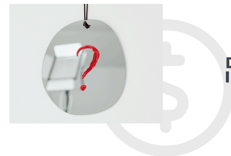
DISEÑO DE IDENTIDAD