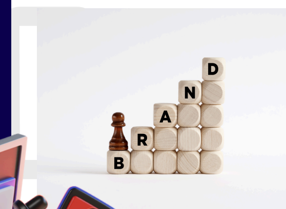
MODELADO DE MARCA