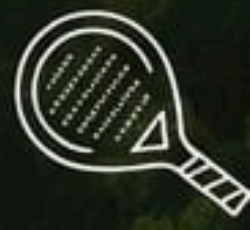
Canchas de Padel