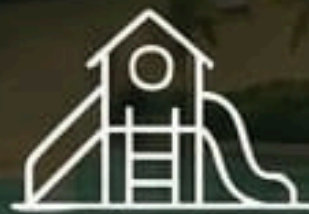
Áreas de recreación infantil