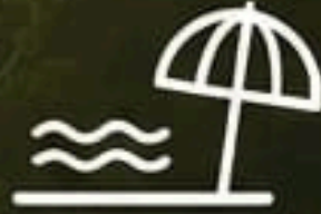
Piscina estilo playa