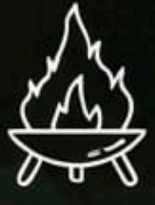
Fire Pits Garden