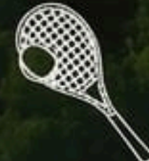
Canchas de Tenis