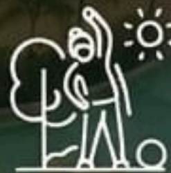
Espacios deportivos al aire libre