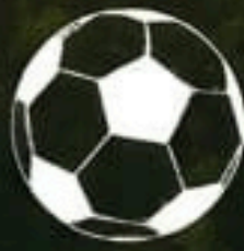
Canchas de Fútbol