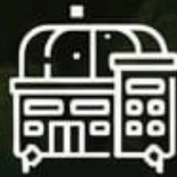
Salón de eventos VIP