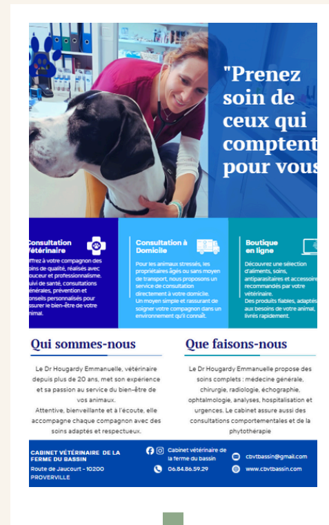
Présentation de structure