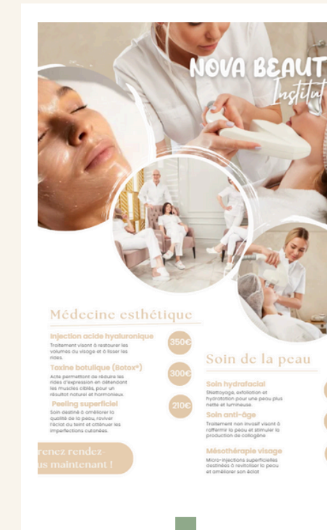
Affiche de tarifs