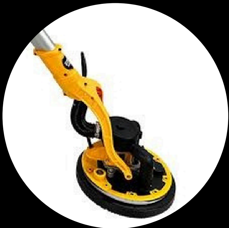
LIXADEIRA LIXADEIRA STONE HAMMER GIRAFA