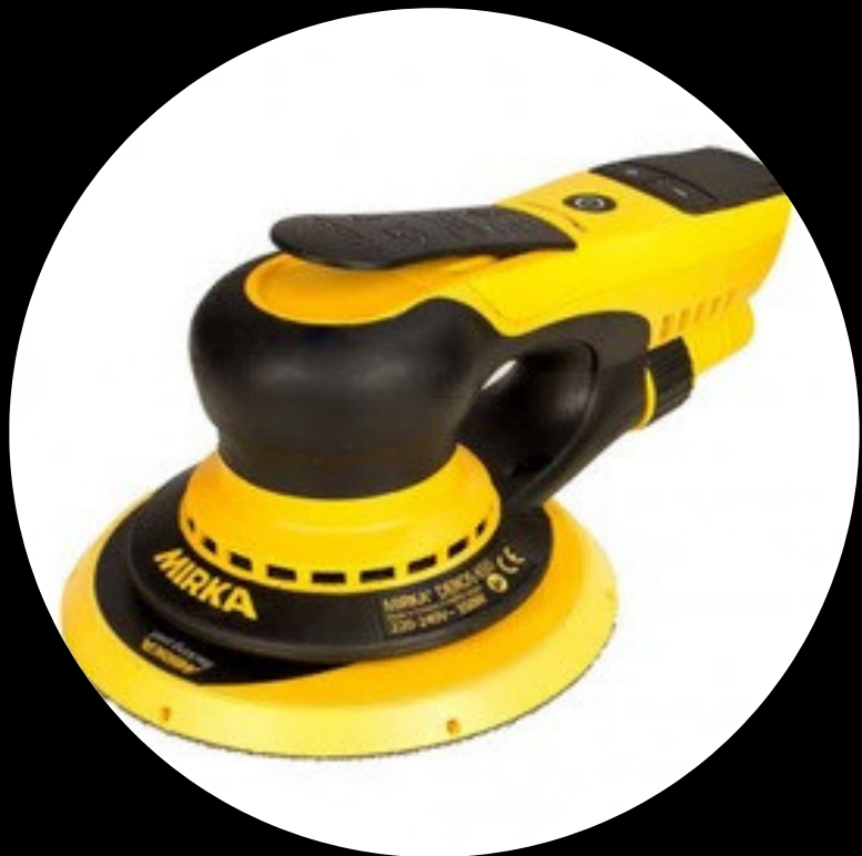
LIXADEIRA MIRKA - DEROS II 5.0