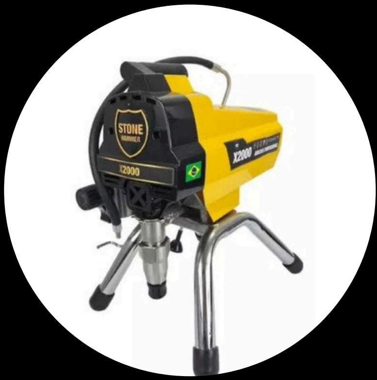
PINTURA MECÂNIZADA AIRLESS X 2000 STONE HAMMER