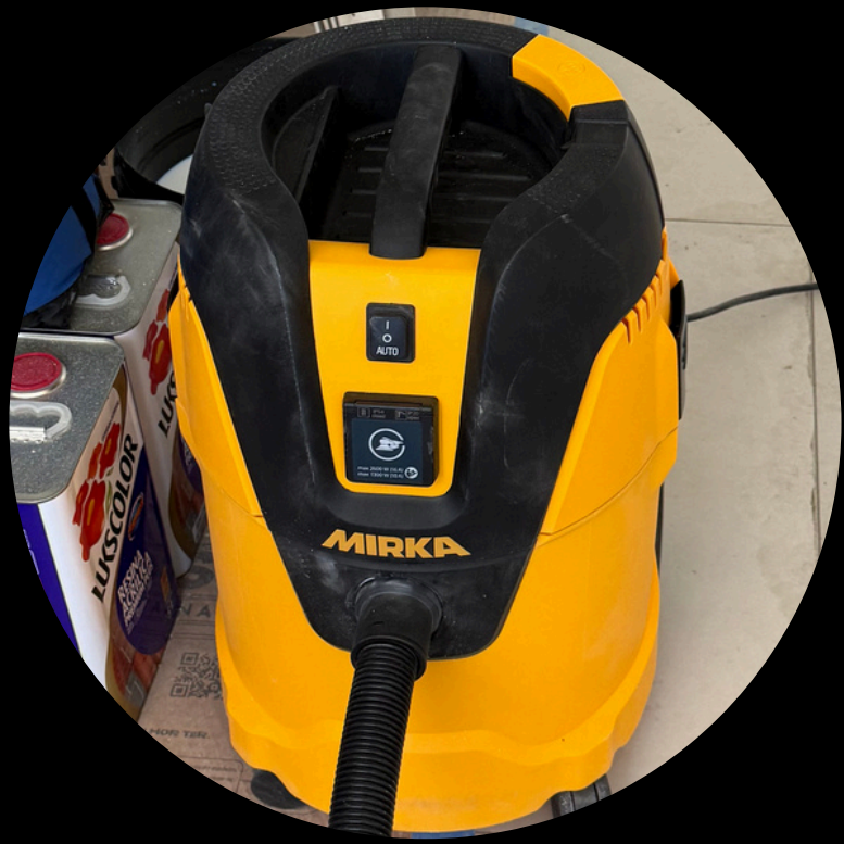
LIXAMENTO SEM PÓ ASPIRADOR MIRKA E STONE HAMMER