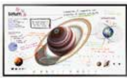
WM55F / WM65F - 옵션트레이 별도