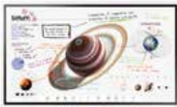
WM55F / WM65F - 옵션트레이 별도