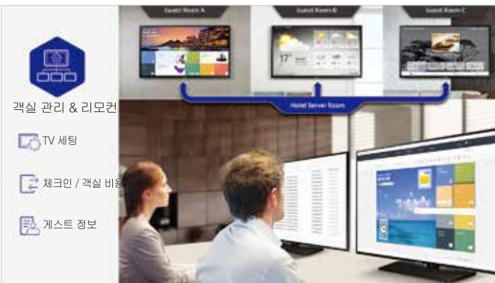
-RU 750 시리즈만 가능

통합 콘텐츠 관리 솔루션인 LYNK Cloud를 활용하면 객실 내 콘텐츠 재생 현황을 실시간 모니터링하고, 원격으로 관리할 수 있어 보다 효율적입니다. 문제 발생 시에도 개별 디스플레이나 여러 대의 디스플레이 그룹을 선택하여 한 번에 관리할 수 있어 신속한 해결이 가능합니다.