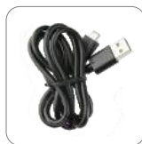
Cable de datos PC143