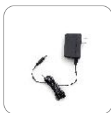
Adaptador de energía 12 V/1 A PS1016