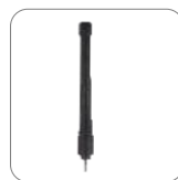
Antena UHF 400-470MHz AN0435W15