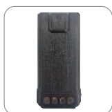
Batería 2200mAh BL2204