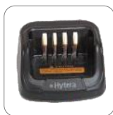
Cargador rápido MUC CH10A07