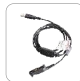
Cable de programación PC155