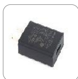
Adaptador (USB) PS2023