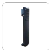
Clip para el cinturón BC48