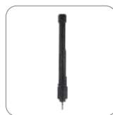
Antena VHF 146-174MHz AN0160H19