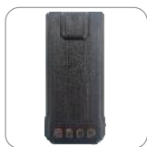
Batería de Li-ion 1500 mAh BL1507