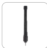
Antena VHF 136-150MHz AN0143H13