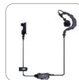
Auriculares tipo C EHN36 EH35