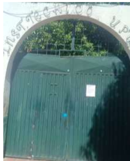
SOCIALIZACION DE LA INVITACION A LA RENDICION DE CUENTAS