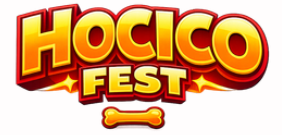
TABLA COMPARATIVA HOCICO FEST