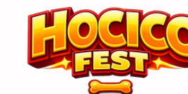
TABLA COMPARATIVA HOCICO FEST