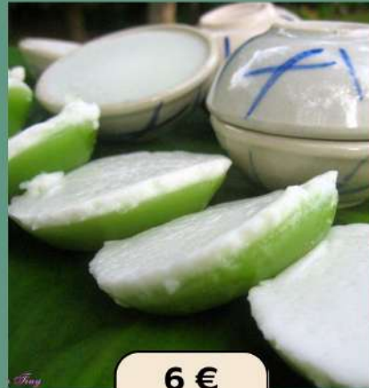
FLAN THAÏ pâte de haricot mungo & échalotes frites