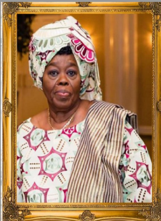
Née au Bénin: 27 Octobre 1939 Décédée aux USA: 27 Novembre 2025 Âge: 86 ans