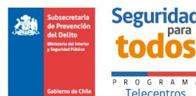
Telecentro de la Villa los Troncos La Cisterna