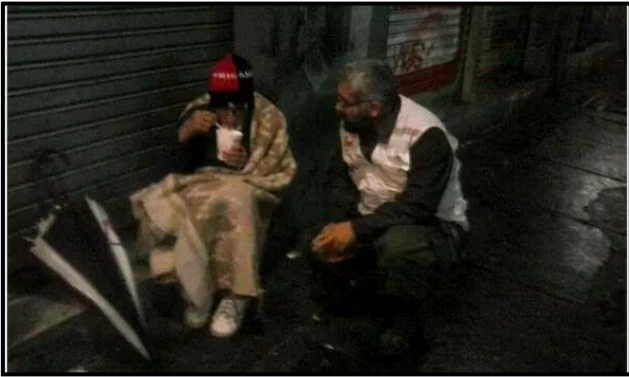
Entrega de sopa caliente a personas en situación de calle