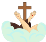
Iglesia Recoleta Franciscana Comedor Fray Andresito, de la Recoleta Franciscana