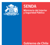
Servicio Nacional Prevención y Rehabilitación del Consumo de Drogas y Alcohol