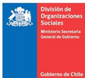
División de Organizaciones Sociales (DOS)