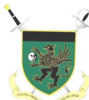
Centro Medieval y Renacentista de Chile