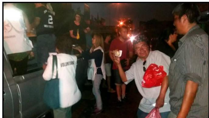
NUESTRAS VOLUNTARIAS DE