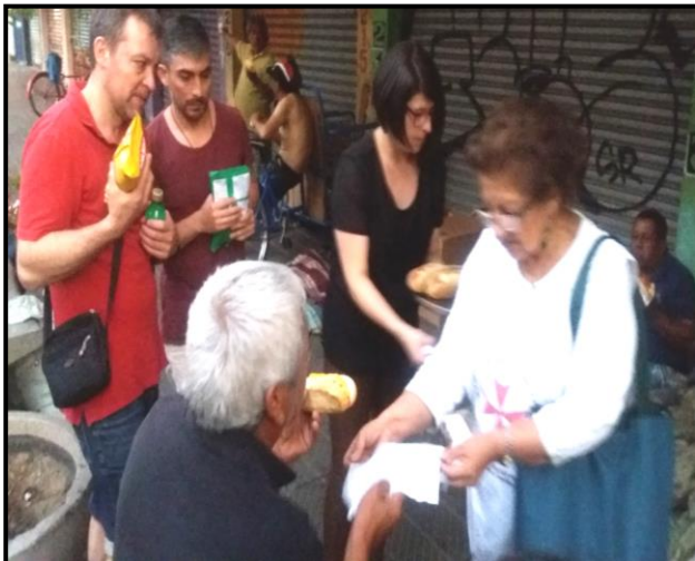
ENTREGANDO ALIMENTOS EN NAVIDAD