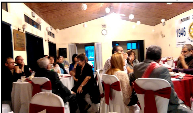
Nuestros socios y amigos disfrutando de la Cena