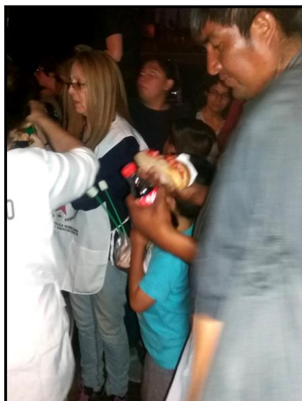
NUESTRAS VOLUNTARIAS Y VOLUNTARIOS ENTREGANDO AYUDA HUMANITARIA DE DÍA Y DE NOCHE