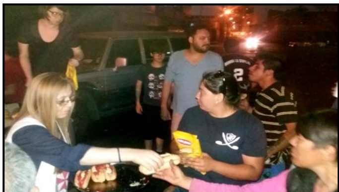
ENTREGANDO ALIMENTOS EN NAVIDAD