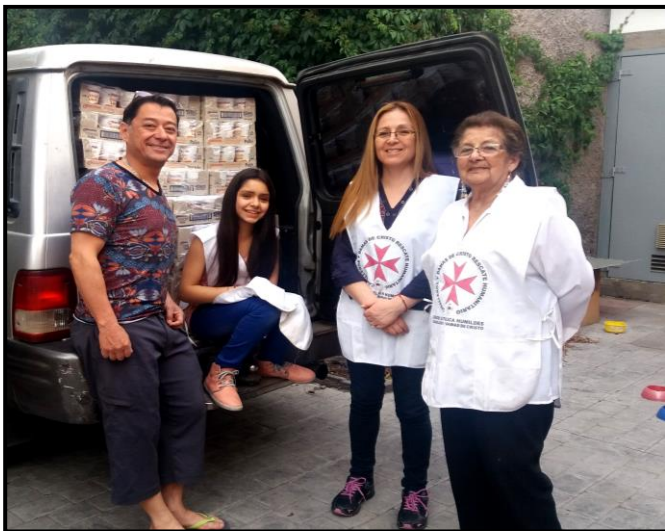
Nuestras Voluntarias y Voluntarios de Rescate Humanitario haciendo entrega de donación de alimentos al Fray Gerardo Flores Benavente para el Comedor Social de Victoria.