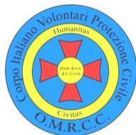
Corpo Italiano Volontari Protezione Civile – O.M.R.C.C. Italia