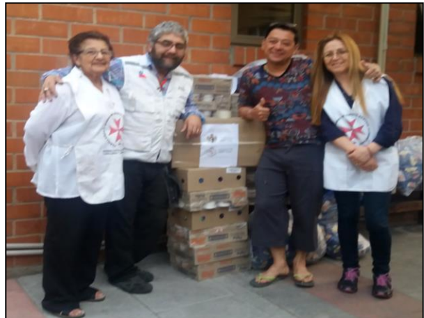
Nuestras Voluntarias y Voluntarios de Rescate Humanitario haciendo entrega de donación de alimentos al Fray Gerardo Flores Benavente para el Comedor Social de Victoria.