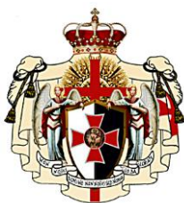
O.M.R.C.C. Ordine Militare e Religioso dei Cavalieri di Cristo Italia