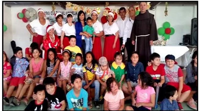
Participamos en la Fiesta del día del niño en la comuna de la Cisterna,