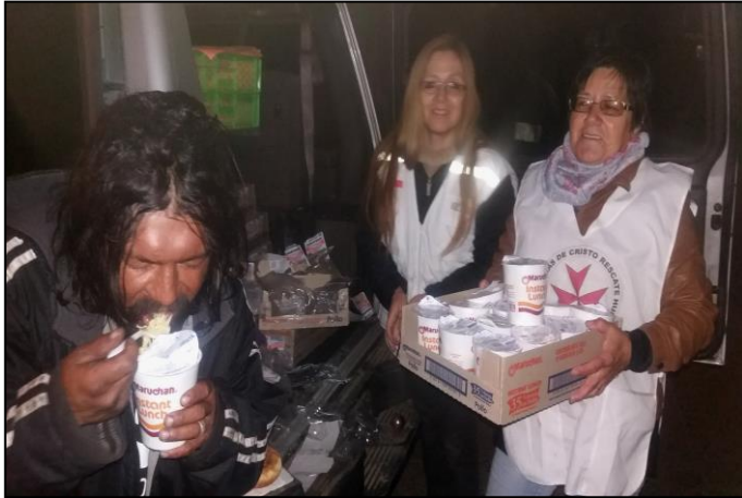
Entregando alimentos calientes a personas en situación de calle, en el sector de Recoleta