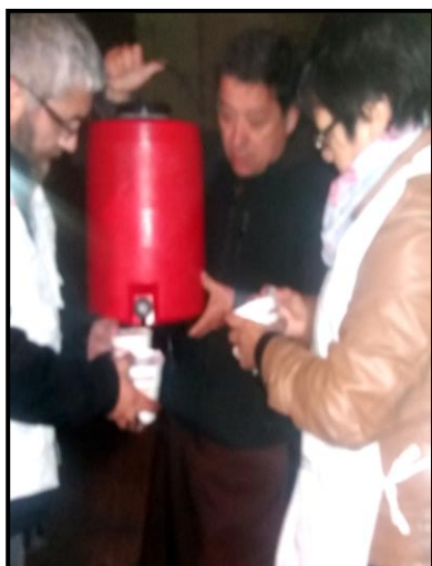
ENTREGANDO AYUDA HUMANITA

La Unidad de Rescate Humanitario, ha desarrollado una labor humanitaria y sanitaria dentro de sus actividades, logrando sensibilizar cada día más personas y empresas, con el fin de ayudar a quienes nada tienen.