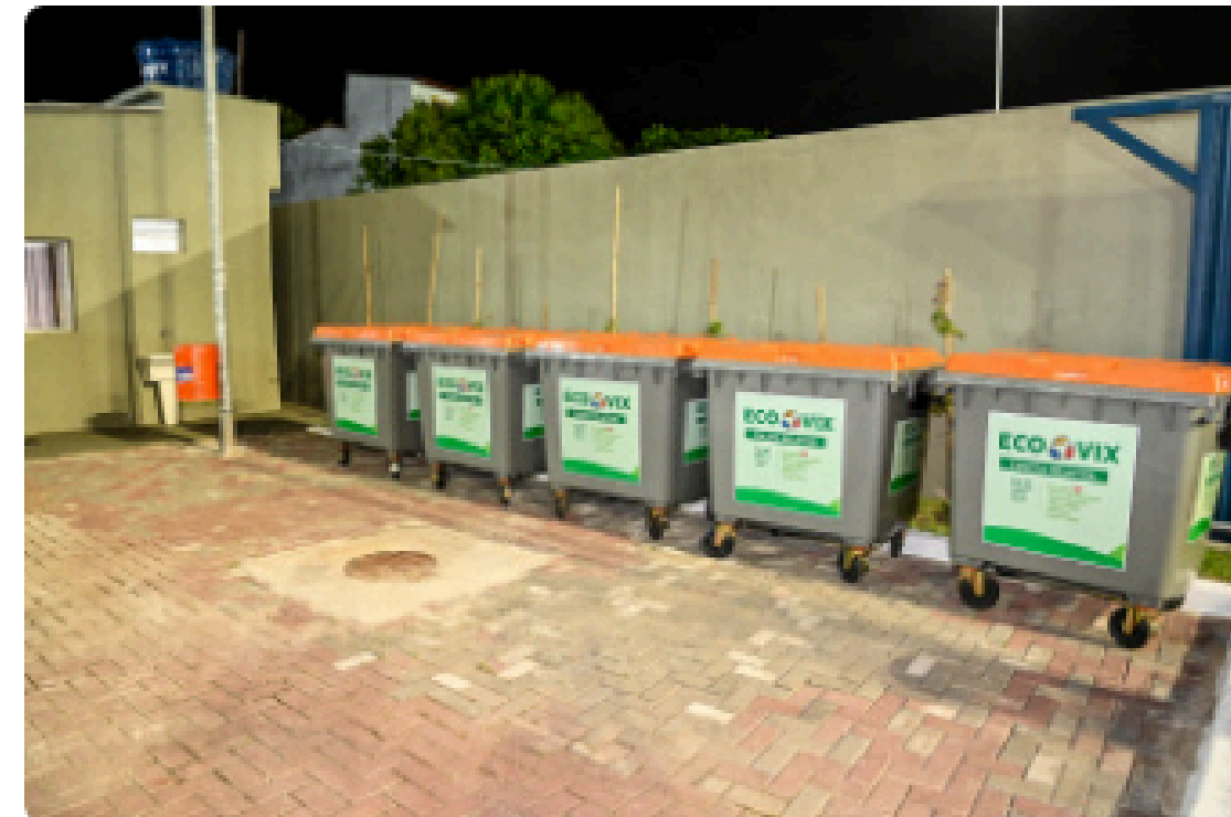
EcoVIX Goiabeiras 🔍

https://www.vitoria.es.gov.br/noticia/novo-ecovix-de-goiabeiras-arrecadou-250kg-de-material-em-sua-primeira-coleta-52224