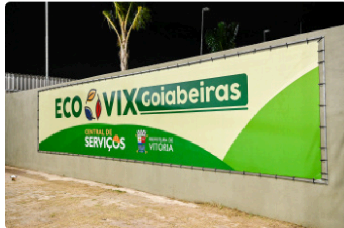
EcoVIX Goiabeiras 🔍