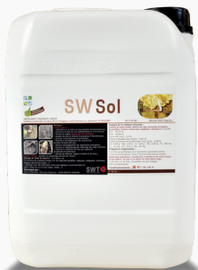
SW Sol 10 Litres Réf : SW-S-ME-10

SW Sol stimule et équilibre l'ensemble de la faune et la flore du sol, en surface et en profondeur :