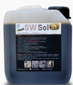
SW Sol 2 Litres Réf : SW-S-ME-02