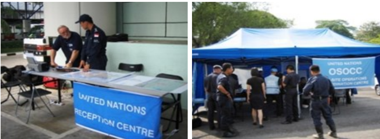
Figura 5: RDC y OSOCC establecidos durante el ejercicio IER