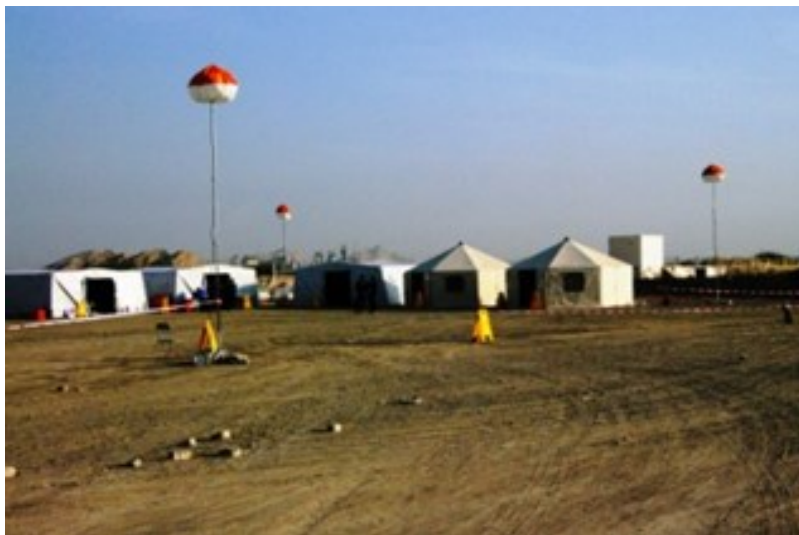
Figura 6: Base de Operaciones de un Equipo