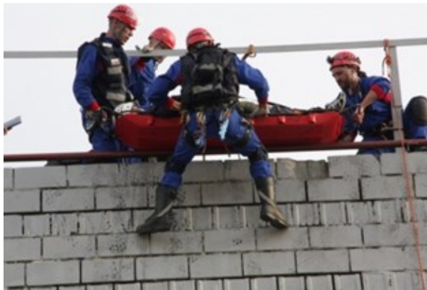
Figura 4: Equipo practicando una operación de rescate en altura

El ejercicio debe ser diseñado haciendo uso de una evolución constante de escenarios colapsados con estructuras realísticas y no se trata de un ejercicio que demuestre habilidades técnicas individuales (haciendo que el ejercicio use estaciones de desempeño de habilidades prefijadas). El ejercicio de desastre simulado se requiere que abarque todas las etapas claves de respuesta a desastres internacionales.