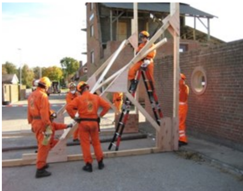
Figura 3: Equipo desempeñando el ejercicio IEC de 36 horas