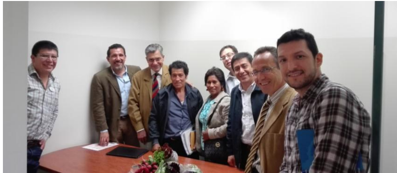
Reunión de Directivos de Wong con productores, miembros de la Universidad Nacional Agraria La Molina y representantes de GESPLAN UPM. 21 de junio de 2016

En la última fase de trabajo del proyecto pudimos establecer contactos en nuestro viaje a Lima, con la Empresa Wong cadena de supermercados y agricultores de la zona de Lurigancho Chosica, del Cono norte de Lima, que mostraron su interés en posibles colaboraciones futuras.