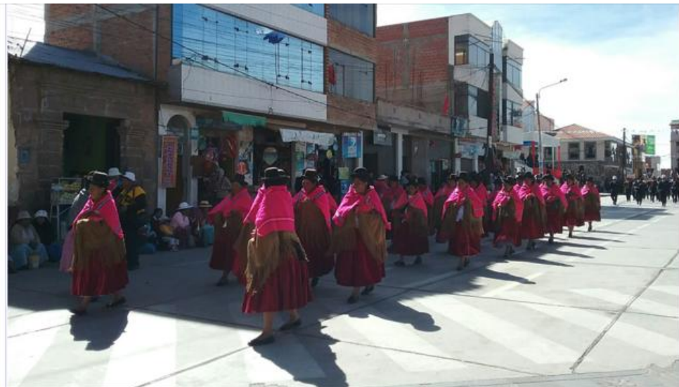
Celebración Chicuito, Puno