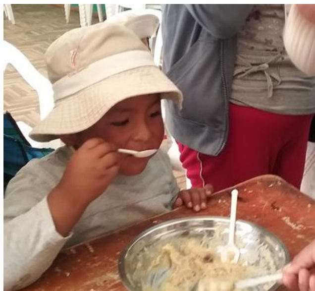
Probando las recetas. Taller en Huancané, 9 de junio de 2016