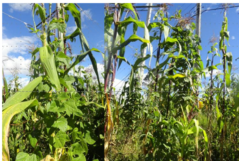
Asocio de frijol (planta enredadera) y maíz (planta soporte). Azuay, 1 de junio de 2016