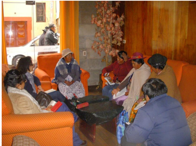
Reuniones preparatorias. Reunión Junta CMA / UPM/ Sedes Sapientiae