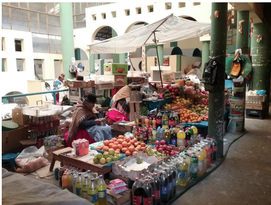
Mercado local de Juli, 7 de junio de 2016

El taller de Huancané se dictará en el salón parroquial de Huancané. Para movilizarse se dispondrá de los medios que dispone la CMA. Los meses anteriores se ha preparado una encuesta de trabajo previo que servirá también de material enriquecedor para estos Talleres que contarán también con la asistencia de intendentes de las comunidades rurales de la zona.