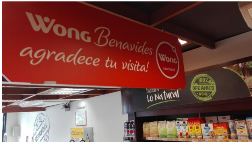
Entrada al lineal de productos orgánicos en Wong