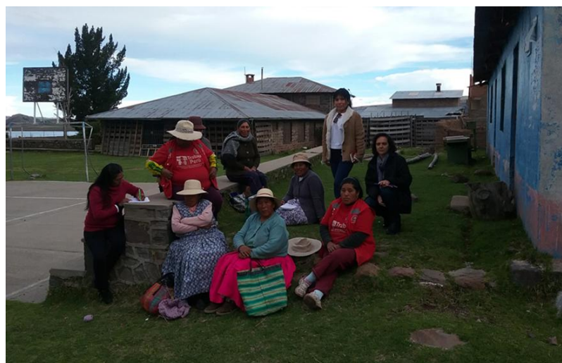
Reunión en Chucuito, a la puerta del local de la CMA. 17 de febrero 2016