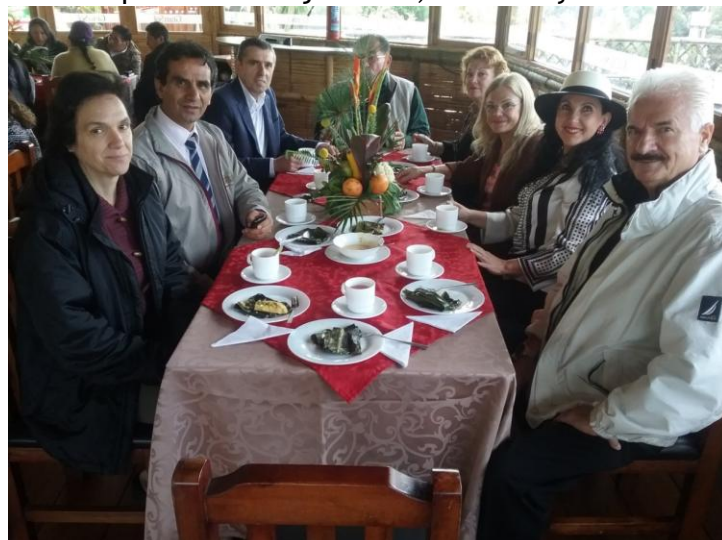
Almuerzo con los representantes de la comunidad Americana, 31 de mayo de 2016