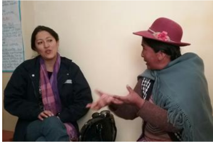
Taller en Chicuito, junio de 2016