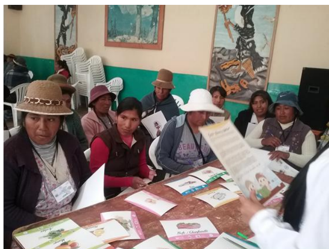
Motivación y recojo de saberes previos. Taller en Huancanne, 9 de junio de 2016