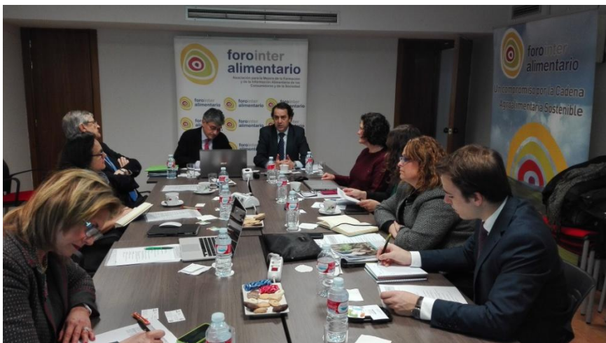
Taller sobre sostenibilidad de la cadena. Jornada organizada por Dirección General del Foro Interalimentario. 10 de marzo de 2016