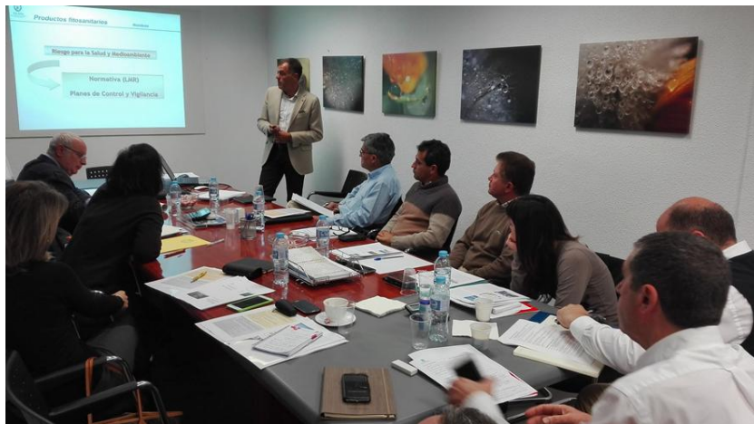
Sesión de trabajo de las Jornadas Taller sobre Seguridad Alimentaria y Principios IAR. San Pedro de Pinatar. 26 de febrero de 2016