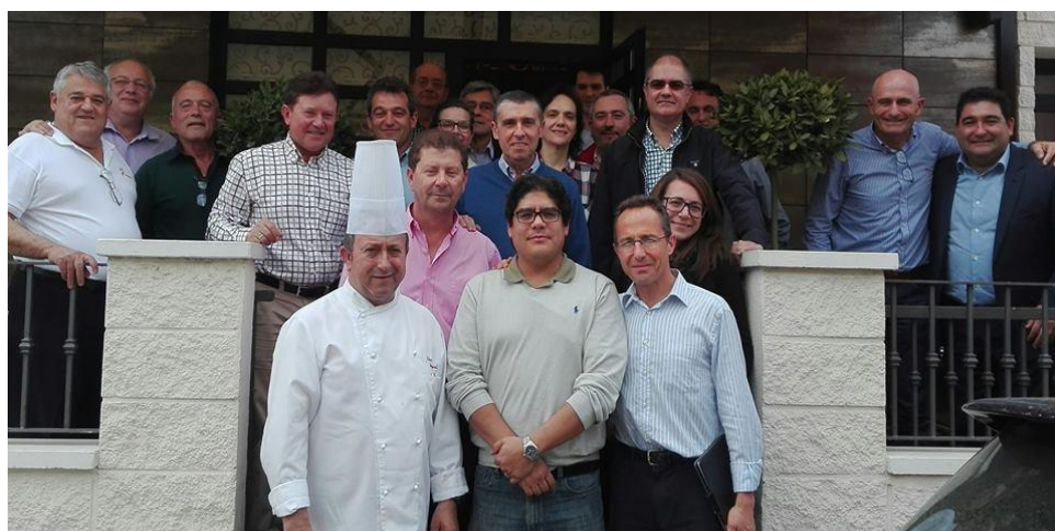
Productores que asistieron al almuerzo, cierre de las jornadas plenarias. 22 de abril de 2016