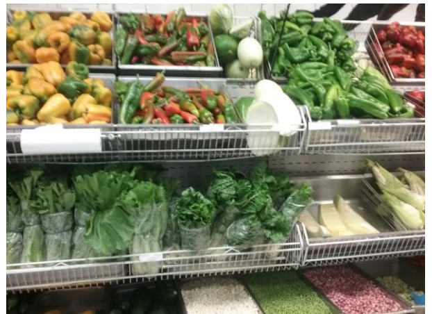
Frutas a la venta en el supermercado Gran Sol, 31 de mayo de 2016