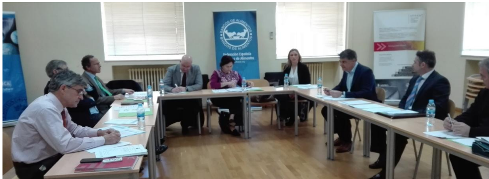
Taller sobre Gobernanza de organizaciones profesionales. ETSI Agrónomos. 8 de marzo de 2016