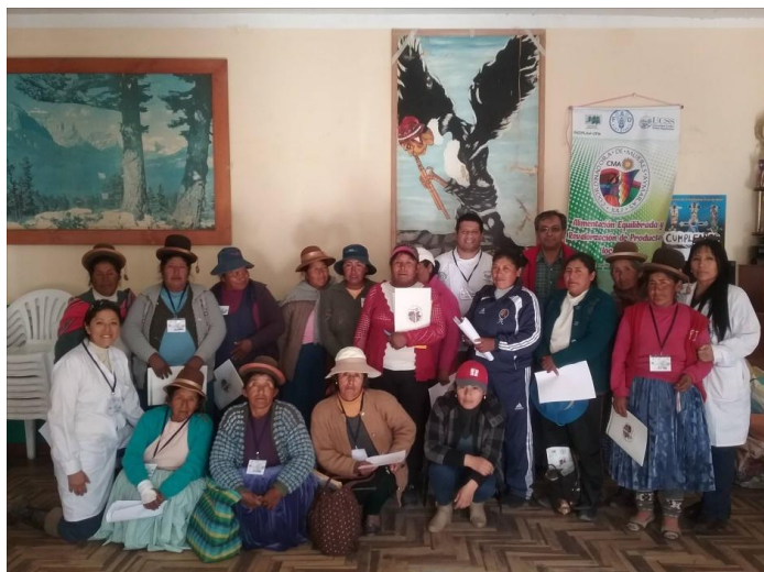
Participantes en Huancané, 9 de junio de 2016