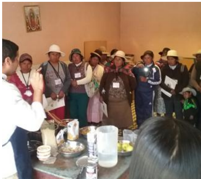
Elaboración de recetas. Huancané, 9 de junio de 2016