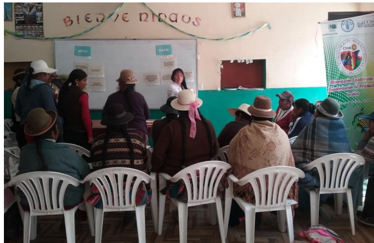
Mitos sobre la anemia, Huancané, 9 de junio de 2016