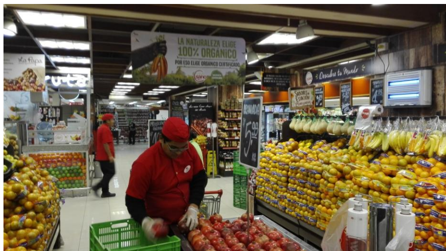
Muestra del cuidado en el manejo de los productos