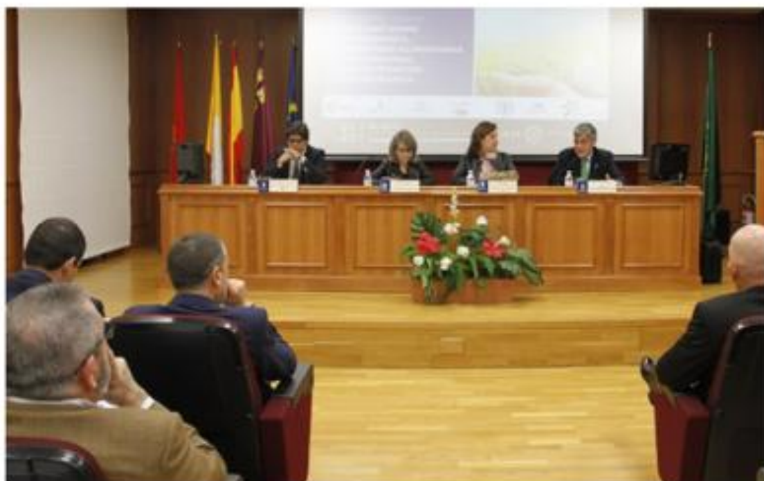
Instante de la inauguración de la jornada