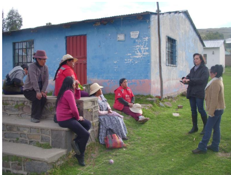
Reunión Chicuito. 17 de febrero de 2016