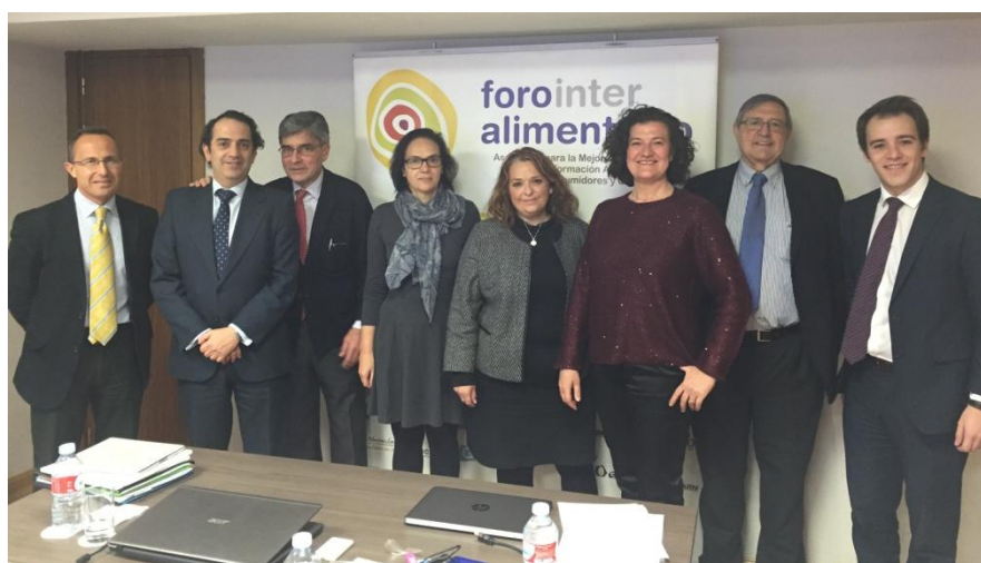
Taller sobre sostenibilidad de la cadena, 10 de marzo de 2016