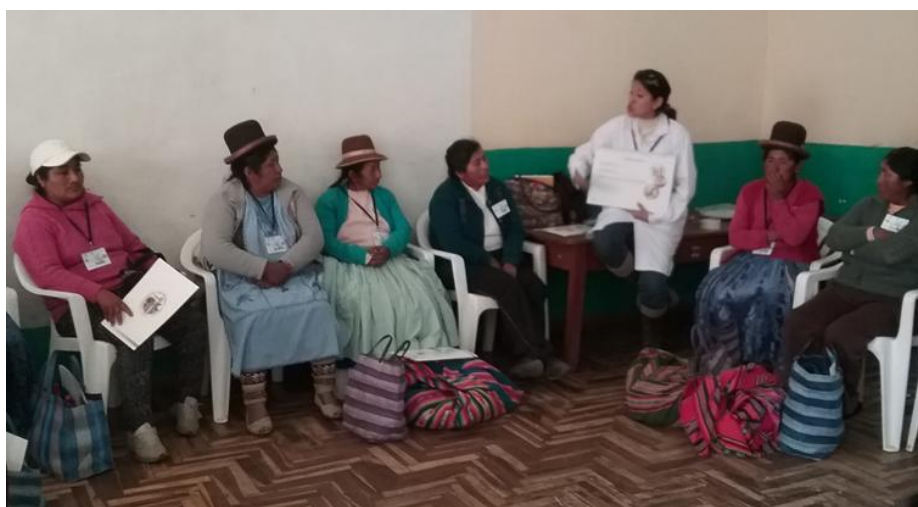
Explicación con rotafolio: la Anemia, los micronutrientes, utilidad y efectos secundarios. Huancané, 9 de junio de 2016