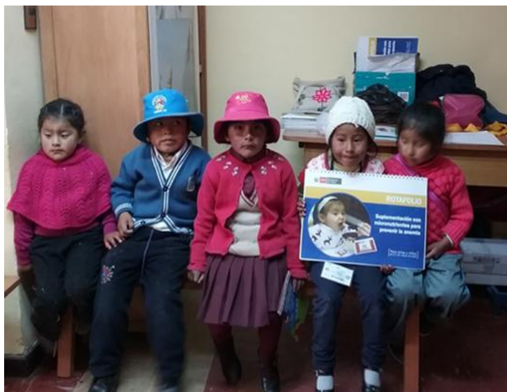
Taller en Juli, 8 de junio de 2016