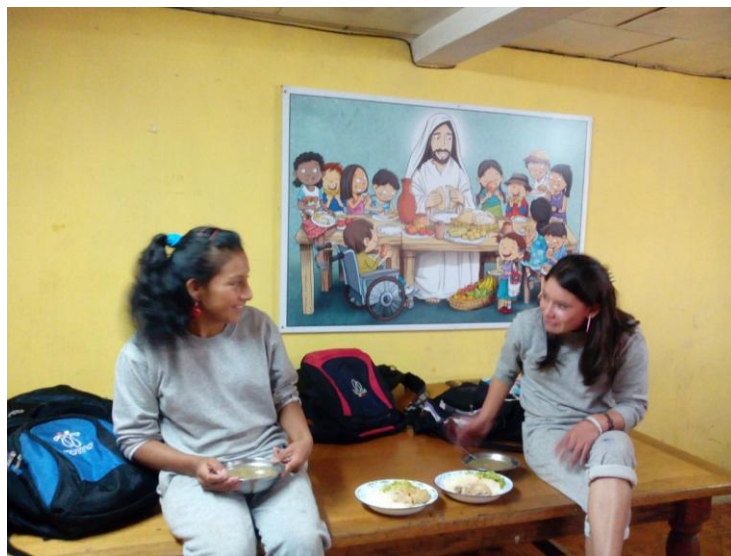
Almuerzo en El Hogar juvenil Salesiano de Chaucha, Ecuador