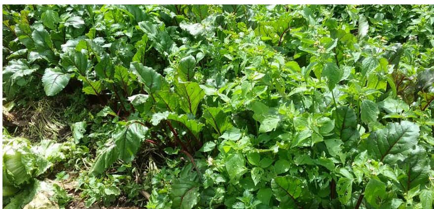
Asocio de remolacha, cilantro y ortiga, Azuay. 3 de junio de 2016