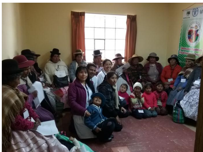
Participantes en Juli, 8 de junio de 2016