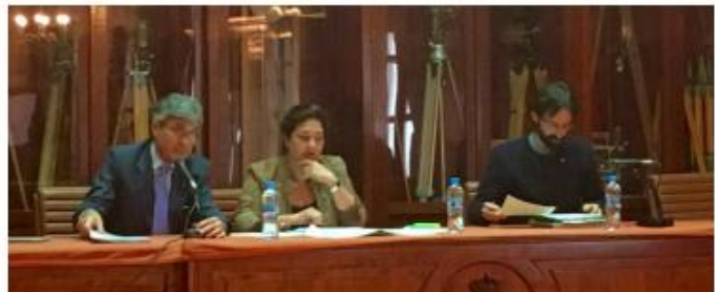
Clausura del Acto

Por último destacó que “hay muchos valores, prácticas, tecnología y conocimiento que son intrínsecos en las empresas que la FAO necesita para robustecer y aprender sobre buenas prácticas. Es un hecho que, el retorno de la inversión es mayor cuando su inversión es responsable (en la empresa) y está reconocida por la sociedad. El reto es la creación de valor y liderazgo empresarial, de cara al desarrollo con practicas público-privadas transparentes y responsables, con miras a alcanzar conjuntamente los objetivos de desarrollo sustentables”.