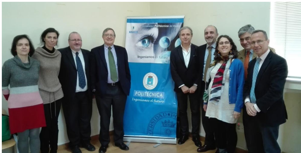
Taller de sostenibilidad, reutilización y Banco de Alimentos. ETSI Agrónomos. 11 de marzo de 2016