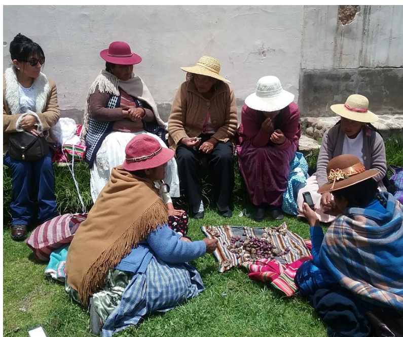
Almuerzo en Juli (Puno), 18 de febrero de 2016