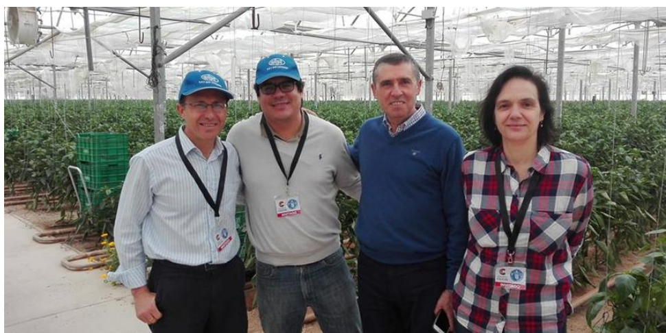
Invernaderos de Agricultura Ecológica (Camposeven) 22 de abril de 2016