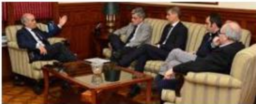
BUENOS AIRES 2.- Entrevista del Vicegobernador de la Provincia de Buenos Aires, para ver posibilidades de aplicación de los Principios IAR. 30 de mayo de 2016