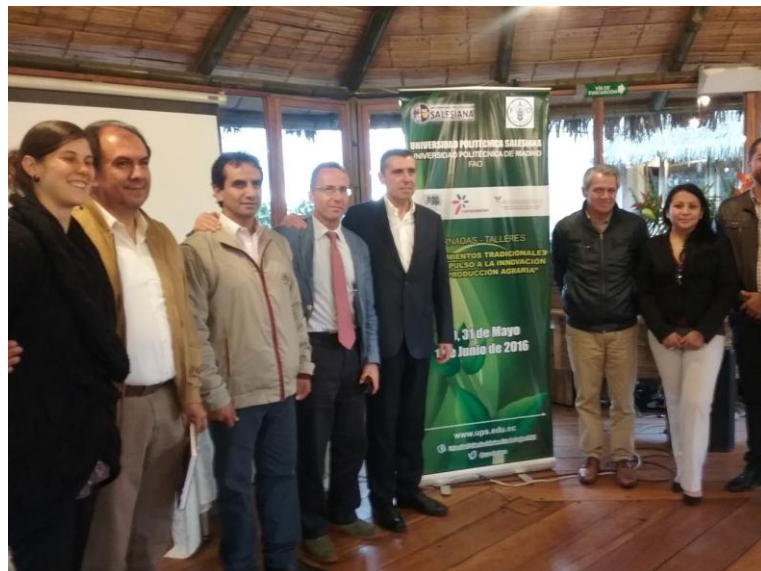
Participantes en las jornadas, 31 de mayo de 2016