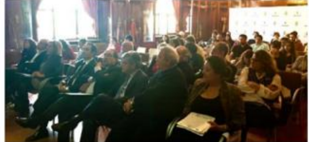
Asistententes en el Aula Magna de la ETSI Agrónomos