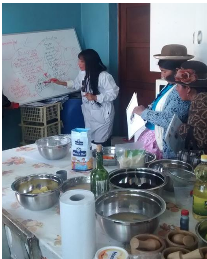
Importancia de la dieta balanceada, Taller en Juli, 8 de junio de 2016