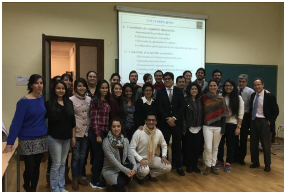
Grupo del Master curso 16/17.