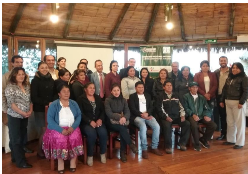
San Joaquín. Participantes en las Jornadas Taller. 31 de mayo de 2016