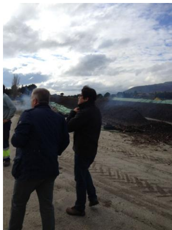
Sierra Norte de Madrid, visita proyectos de Desarrollo Rural