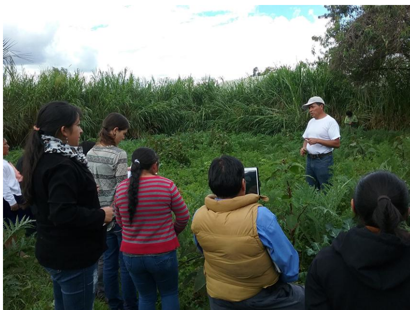
Visita a las huertas de San Joaquín (Azuay). 1 de junio de 2016