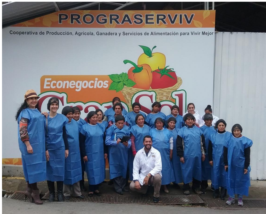
Participantes en las Jornadas a la entrada del Centro de Acopio, 1 de junio de 2016