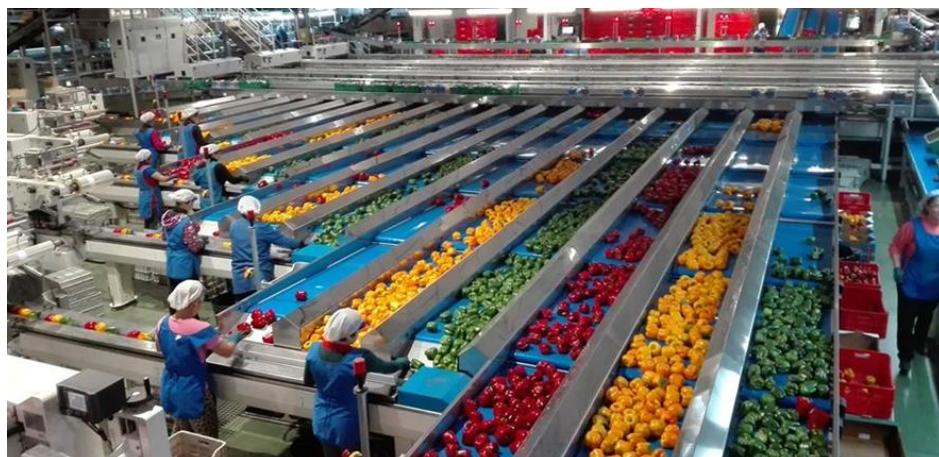
Visita de campo. SAT San Cayetano. 22 de abril de 2016