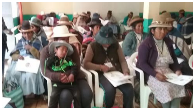
Taller en Huancané, Huancané, 9 de junio de 2016