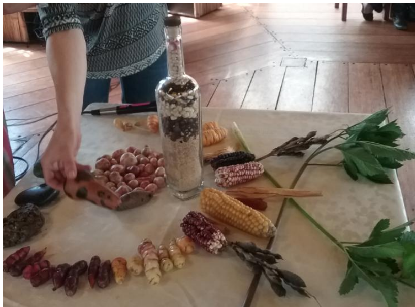
Alimentos tradicionales andinos: base de la medicina ancestral. 1 de junio de 2016