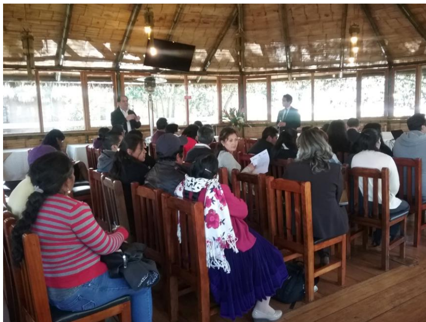
Momento de la jornada, 30 de mayo de 2016