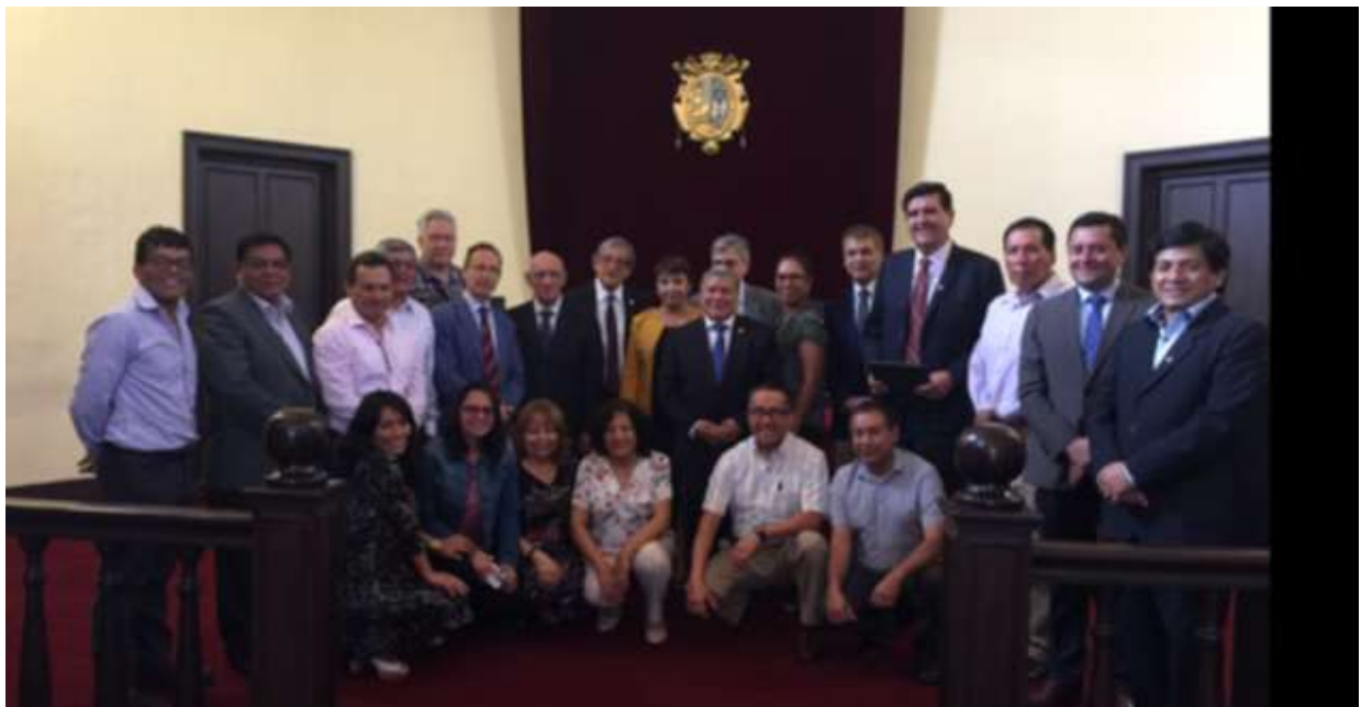
Algunas personalidades académicas en el emblemático edificio denominado la Casona perteneciente a la Universidad Nacional Mayor de San Marcos en la reunión del 26-27 de abril de 2018