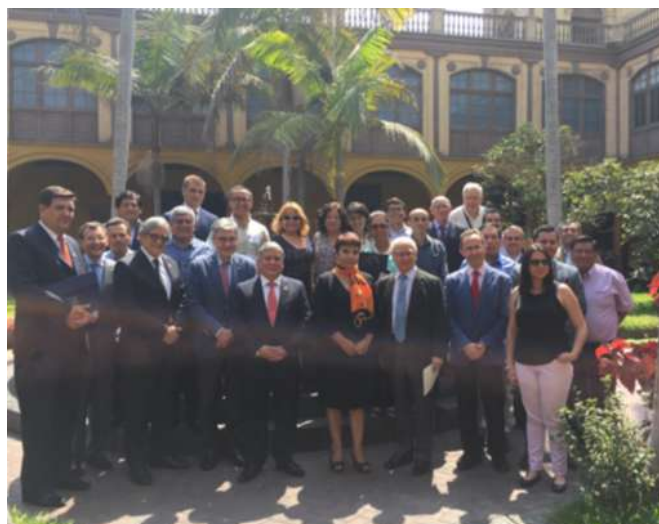
Participantes en las Jornadas de Lima (UNMSM) en el edificio histórico de 1551 “La Casona”

Organizadas en colaboración con la Universidad Politécnica de Madrid (UPM) las jornadas llevaron el título de: Currículos, estudios de casos y seminarios para aumentar el conocimiento y la capacidad de las universidades sobre los Principios para una inversión agrícola responsable que respete los derechos, medios de vida y recursos (Principios IAR -Inversión Responsable en Agricultura)