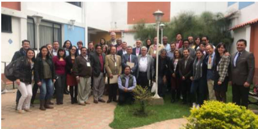
Participantes en las Jornadas de Bogotá en las instalaciones de la UNAL

La Universidad Nacional de Colombia , fue sede de las Jornadas sobre Currículos, estudios de casos y seminarios para aumentar el conocimiento y la capacidad de las universidades sobre las Directrices Voluntarias de la Gobernanza de la Tierra .