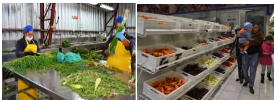
Proyectos de Vinculación de la UPS con actividades de I+D en intergración con los Principios IAR