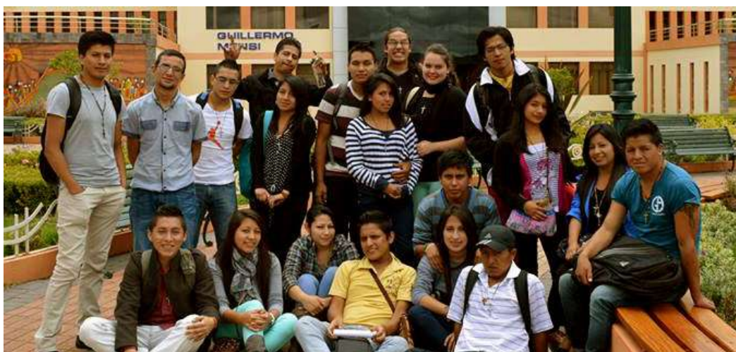
Estudiantes participantes en actividades de vinculación e innovación Educativa en interacción con los Principios IAR

Estas experiencias de la UPS tienen el propósito de contribuir al avance de los distintos sectores de la sociedad, priorizando los más vulnerables [9], [10] y se han caracterizado por ofrecer a la comunidad su apoyo en temas de capacitación, asesoría y ejecución de proyectos como respuesta de las necesidades del entorno, implicando a estudiantes y docentes en acciones conjuntas con la población [11]. Han generado Casos de estudio con vínculos docencia-investigación, implicando a organizaciones civiles, gobiernos seccionales, entidades educativas, cooperativas de ahorro y crédito, instancias de gobierno, y especialmente en sectores indígenas, que reconocen a la UPS como la Universidad de los indígenas. Uno de los compromisos es iniciar un Proyecto de vinculación para la integración de los principios (IAR) orientado a la erradicación de la pobreza, la participación empoderamiento de jóvenes y mujeres, con especial atención sectores situación de vulnerabilidad.