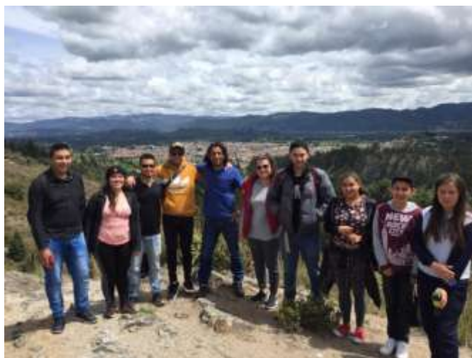
Salida de Campo de Estudiantes de Medio Ambiente de la Uniagraria

UNIAGRARIA se compromete a seguir incluyendo en los cursos pertinentes actividades formativas e investigadoras en relación con los principios IAR y DVGTT de la FAO. Asimismo, se compromete a difundir estas actividades, a desarrollar material docente y casos de estudio que ayuden a la formación para implementar los principios IAR y DVGTT de la FAO.