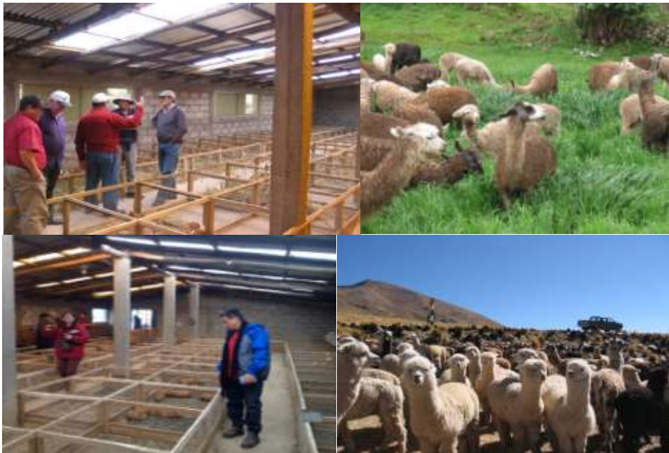
Talleres de divulgación sobre los Principios IAR

Por otro lado, la Universidad a través de los CDR estableció estrategias de difusión de los principios IAR a través de capacitación a docentes, investigadores y técnicos que tienen contacto directo con estudiantes y productores agropecuarios.