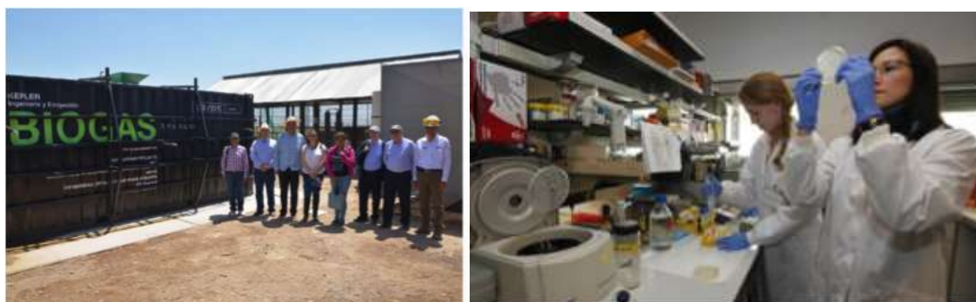
Proyectos de Investigación e instalaciones de la UCSM para actividades de I+D en interacción con los Principios IAR

Los docentes e investigadores responsables de los programas de grado y de educación ejecutiva del PAD se comprometen a seguir incluyendo en los próximos cursos actividades formativas e investigadoras con relación a los principios y directrices mencionadas. Se comprometen también a seguir trabajando en la difusión de estos principios, en la elaboración de materiales académicos y casos de estudio que ayuden a la implementación de estos principios y directivas.