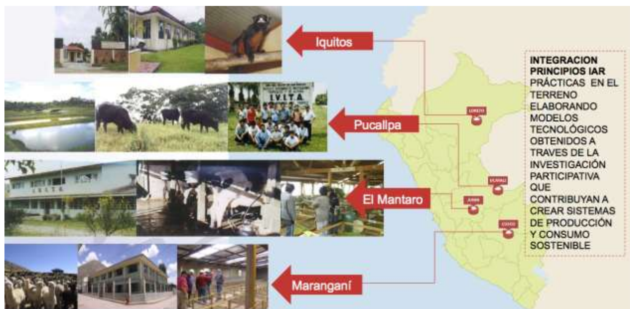
Ambito territorial de las acciones de investigación y de integración de los Principios IAR)

Los CDR tienen por misión promover el desarrollo de las áreas de influencia de dichos Centros a través de la investigación, por ello en estos Centros se alentarán proyectos y programas que contemplen los principios IAR. Se ha establecido que todos los proyectos de investigación que promueva institucionalmente la UNMSM a través del VRIP en el Sector agrario y en los CDR deberán adoptar, en lo concerniente, los principios IAR.