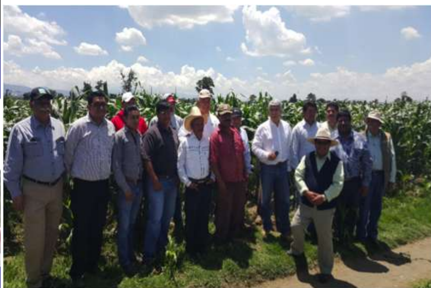
Acciones del COLPOS para la incorporación de los principios IAR en el Master en Gestión del Desarrollo Social en vinculación con pequeños productores de Puebla