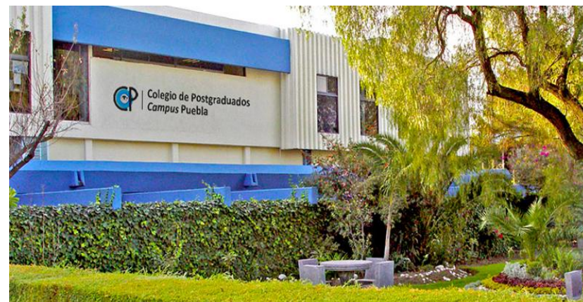
CP, Campus Puebla, México

Seminario virtual 1 y 2 de octubre de 2020