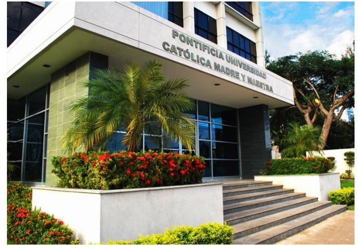
PUCMM Rep. Dominicana

Seminario virtual 1 y 2 de octubre de 2020