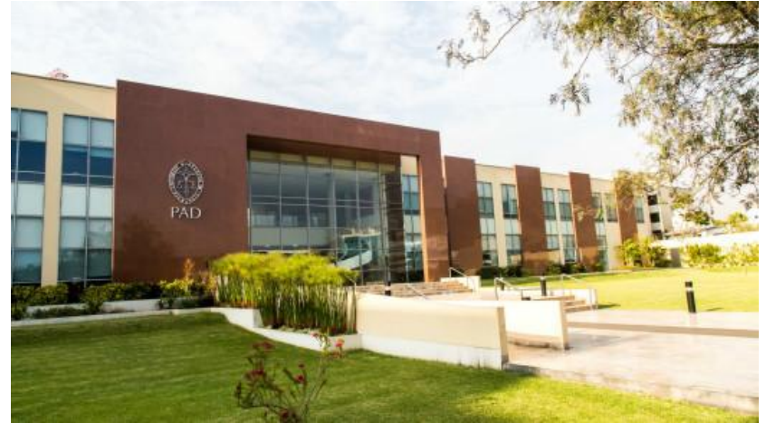
PAD PIURA, Lima, Perú

Seminario virtual 1 y 2 de octubre de 2020