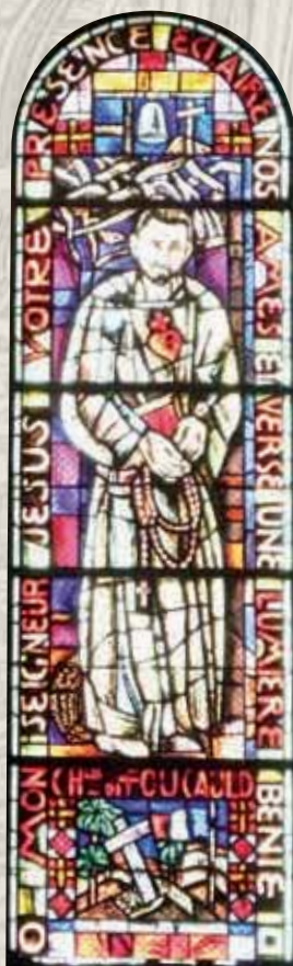
SAINT CHARLES DE FOUCAULD.

L'église devait être consacrée et élevée au rang de basilique en 1914, mais comme la guerre éclate, ce n'est qu'après l'armistice que la cérémonie a lieu. Ainsi, le 16 octobre 1919, le Cardinal Vico, légat du pape, consacre l'église en présence du Cardinal Amette, archevêque de Paris.