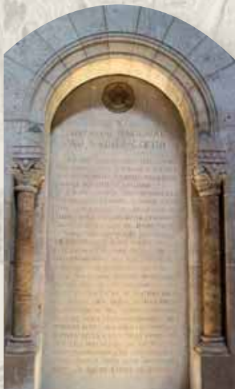
LE TEXTE DU VŒU AU SACRÉ-CŒUR EST INSCRIT DANS LA BASILIQUE.