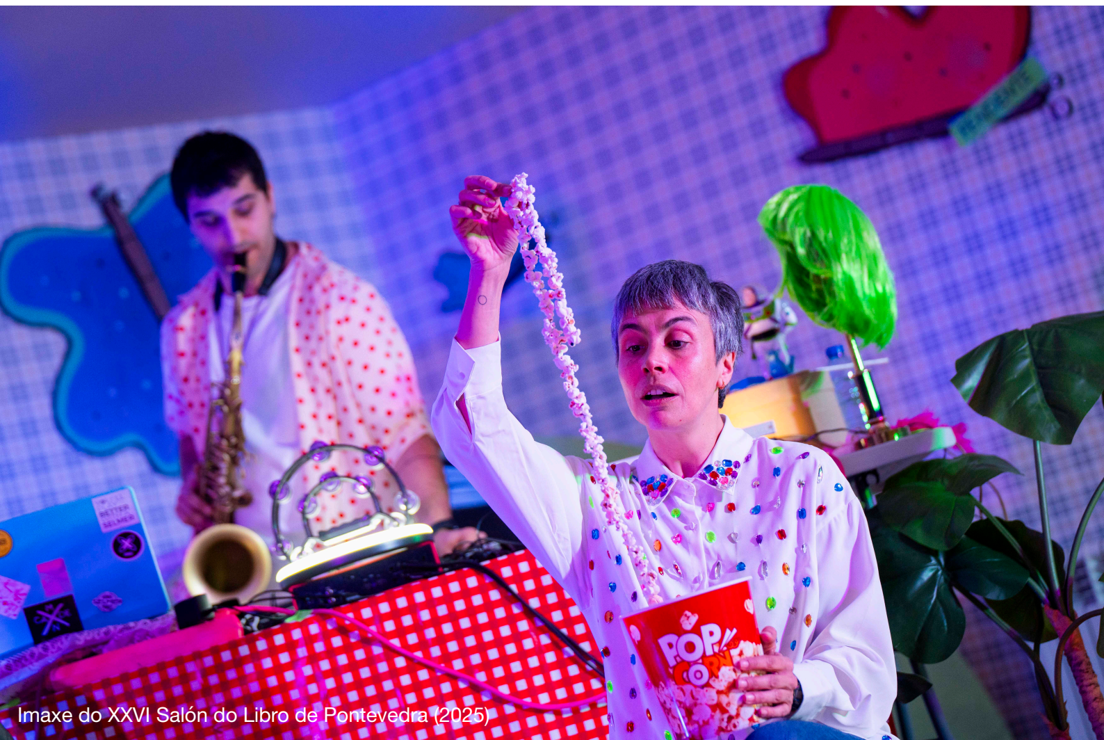
Imaxe do XXVI Sal3n do Libro de Pontevedra (2025)

Actriz e psicopedagoga, desenvolveu a súa actividade profesional no audiovisual, nas artes escénicas e na música. Dende 2011 traballa con diferentes compañías de teatro para a infancia. Escribe teatro e poesía.