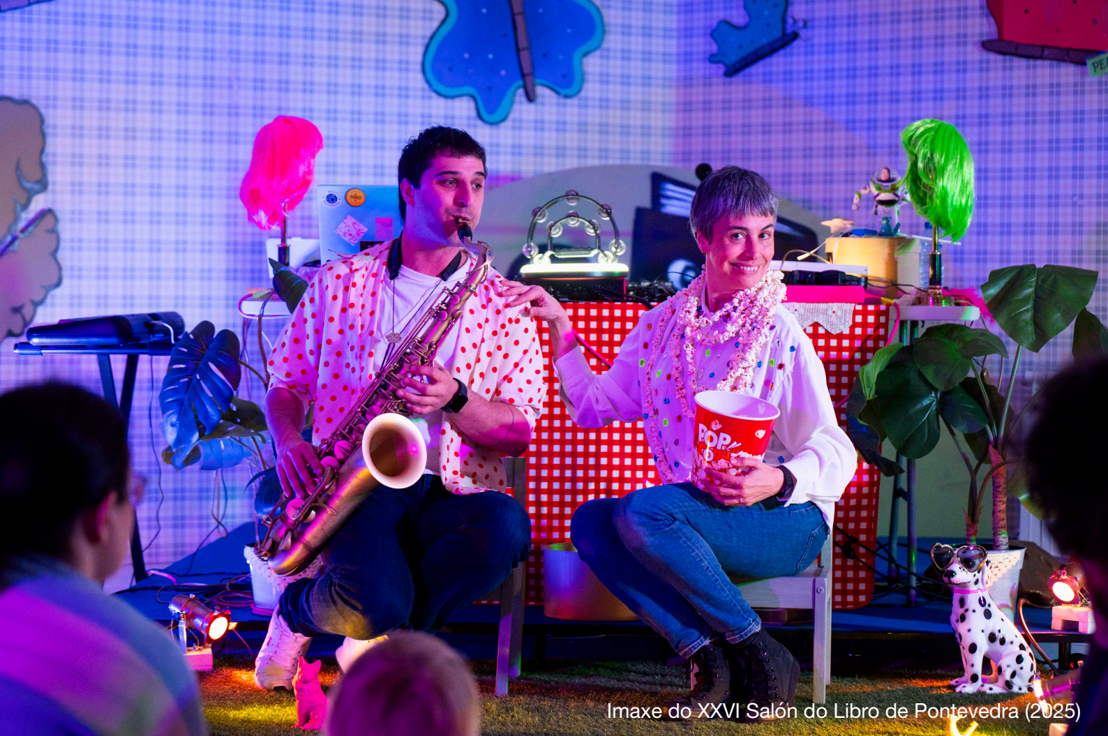
Imaxe do XXVI Sal3n do Libro de Pontevedra (2025)