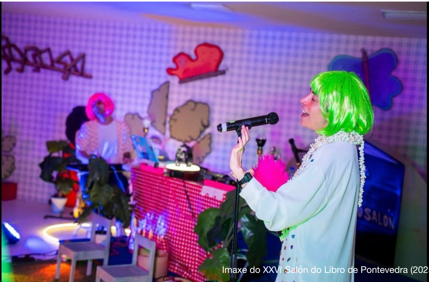
Imaxe do XXVI Sal3n do Libro de Pontevedra (2025)

ENLACE A VÍDEO COMPLETO (Clickar na imaxe):