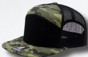
BLACK CAMO BLACK