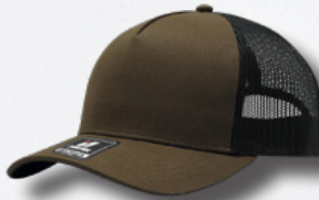
BROWN / BLACK