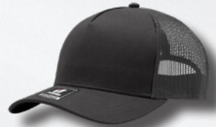
CHARCOAL / OXFORD