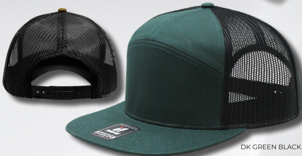
DK GREEN BLACK