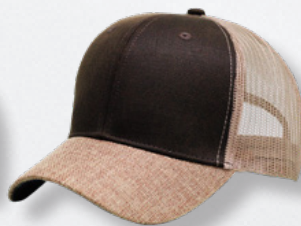
BROWN / KHAKI