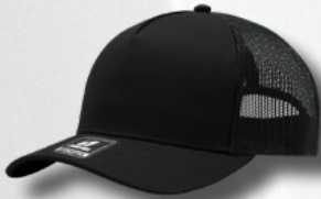
BLACK / BLACK