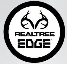
EDGE 02 CAMO MESH BROWN