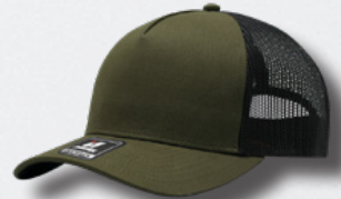
OLIVE / BLACK