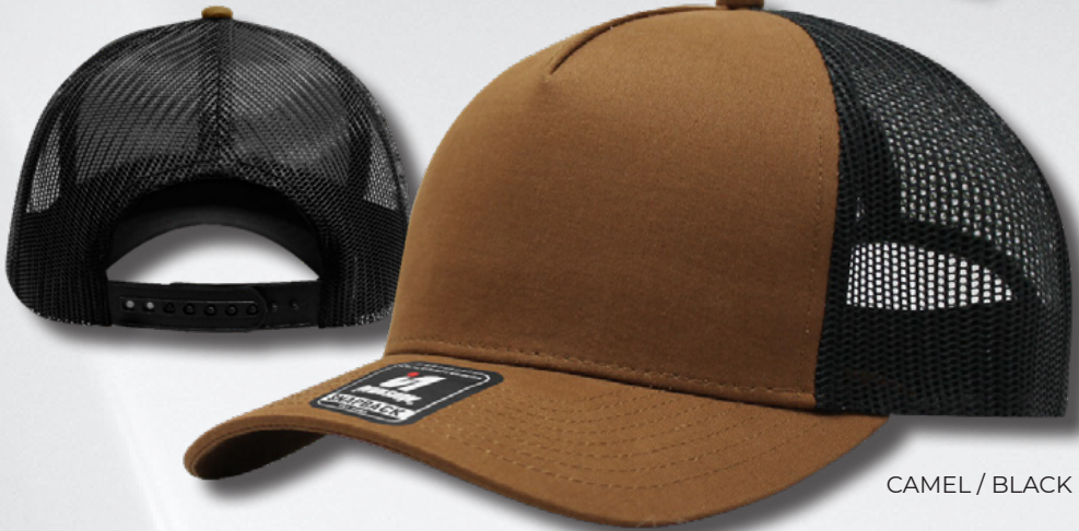
CAMEL / BLACK