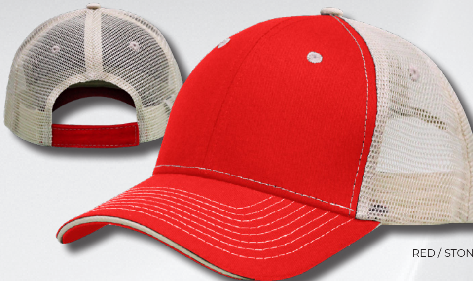
RED / STONE