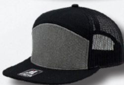
BLACK HEATHER GREY BLACK