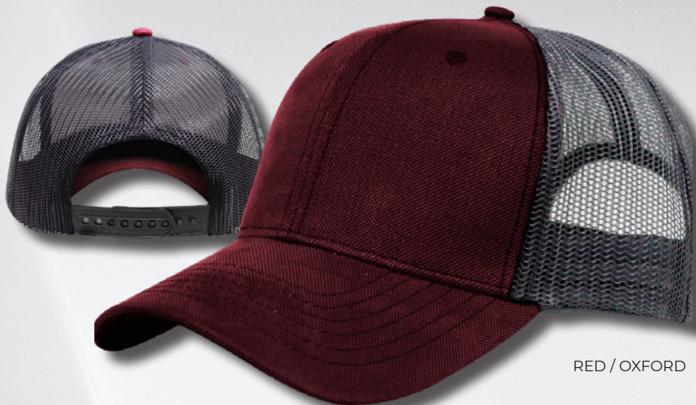
RED / OXFORD