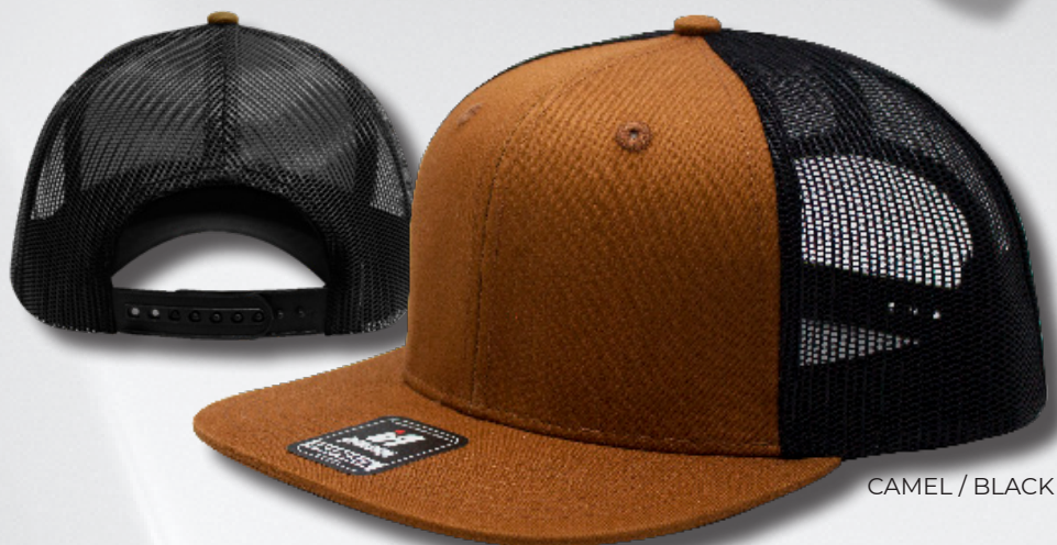
CAMEL / BLACK