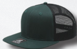
DK GREEN BLACK