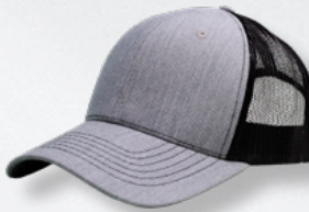
HEATHER GREY/ BLACK