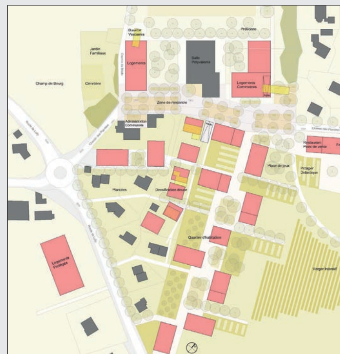
Répartition de la densification concentrée à l'est du village de Tolochenaz. En rouge sur ce plan les bâtiments prévus dans le futur PaCom