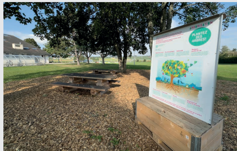
Installé près du pavillon Audrey Hepburn par la ville de Morges qui préconise la plantation d'arbres.

Face aux dérèglements climatiques, la région de Morges lance une campagne d'arborisation pour améliorer la qualité de vie. Mais avec les projets de densification urbaine de Tolochenaz, une question se pose : arbres ou béton ?