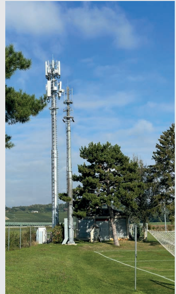
Le nouveau mât de 25m d'acier, bien plus haut qu'annoncé par la Municipalité.

À long terme, les conséquences sur la santé restent encore largement inconnues, et beaucoup de scientifiques appellent à la prudence. La recherche continue d'évaluer les effets cumulés de l'exposition prolongée aux champs électromagnétiques, ainsi que leur impact sur le développement des enfants et des adolescents, qui pourraient être plus vulnérables. En dehors des préoccupations de santé, la question de la vie privée et de la sécurité des données, exacerbée par les connexions omniprésentes, pourrait également peser sur la qualité de vie.