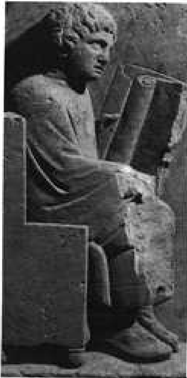
Figure 2. Personnage lisant un rouleau (11 e -13 e siècle de notre ère, Rheinisches Landesmuseum, Trèves). Le Grand Atlas des littératures , p. 150.

rotuli médiévaux retrouve des pratiques de lecture ancestrales 18 : rythme du rituel sacré qui se déroule selon le livre, contrôle des archives administratives, écoute de l'acteur qui joue son rôle , enregistrement des soldats fraîchement enrôlés ... la langue a gardé trace des pratiques liées au rouleau 19 . Les processus mentaux de lecture et d'écriture s'éloignent de l'espace et de l'écrit-tableau pour s'inscrire dans la logique des listes et des rouleaux. Reste que le volumen informatique ne tient pas dans la main (Fig. 2). Virtuel, il n'informe pas la mémoire corporelle. Sa trace codée est abstraite.