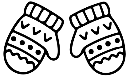
LES MOUFFLES Les mouffles