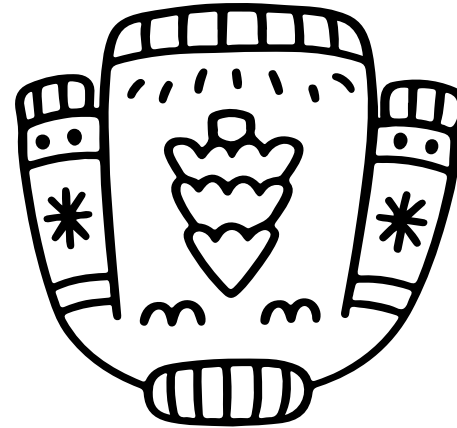
LE PULL Le pull

Les petits livrets de Petits Pas Ludiques