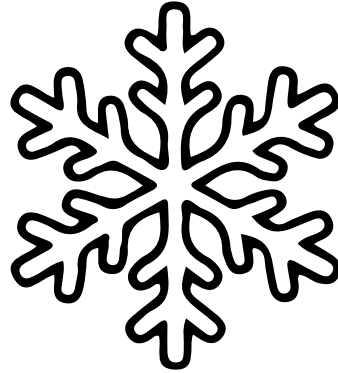
LE FLOCON DE NEIGE Le flocon de neige