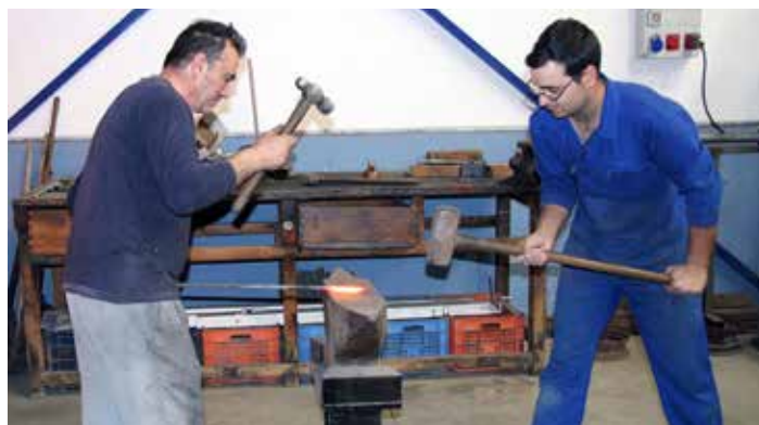
Trabajadores en la actualidad moldeando golpe a golpe.

La Fragua de Los Puga es un negocio familiar que va ya por la tercera generación. Una empresa que se ha levantado con muchísimo trabajo, de la nada, a base de sacrificio y esfuerzo. Y es que cuando se pone pasión en un trabajo, el resultado termina siendo extraordinario. Tres generaciones dedicadas a la agricultura y que han sabido adaptarse a los cambios provocados por el paso del tiempo y a las necesidades del campo.