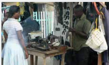
El costurero local.