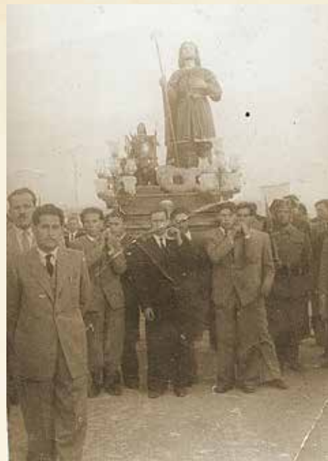
Procesión con la imagen antigua del santo.