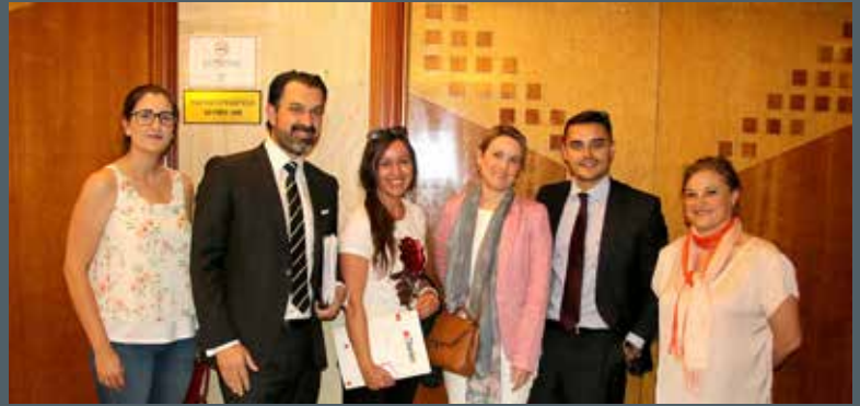
Representantes de Altamira y gestora de la cooperativa SOTAVENTO.

Inmobiliaria Durán, en la calle Cervantes, junto al Ayuntamiento, cuenta con nuevas instalaciones para sus clientes. 100 metros cuadrados en los que seguirán ofreciendo el excelente servicio que caracteriza a esta entidad, basado en la atención personalizada. El lugar perfecto para aquellos que busquen vivienda o local tanto para alquilar como para comprar.