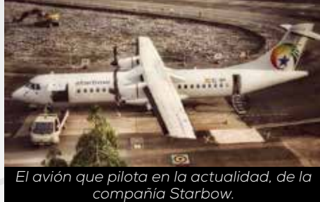
El avión que pilota en la actualidad, de la compañía Starbow.

La población básica sobrevive con menos de 0,50 céntimos al día, con una nula educación, aunque sea gratuita, saben leer y escribir. Esta población es mayoritariamente cristiana, solo el 18 por ciento es musulmán y ambas religiones conviven con la magia negra, la que temen más que a nada. La religión es el pilar de sus vidas, y son literalmente temerosos de dios. De ahí su actitud tan amable y tan pacífica como consecuencia de ese miedo a la ira de dios. Todo ha de comenzar y terminar