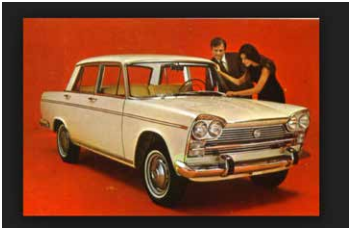
Imagen publicitaria del 1500.

ofrecer un salto cualitativo y cuantitativo en comparación con el famoso 600 y, especialmente, quiso ser el sustituto del 1400, que llevaba ya 15 años en producción. Era un coche grande y espacioso y, como decía la publicidad de entonces, presumía de "la sobria elegancia europea". Este modelo no tuvo competidor directo en España, de hecho, la producción total se estima en unas 150.000 unidades. Fabricado de 1963 a 1972 con licencia Fiat, el 1500 en su clara evolución del 1400