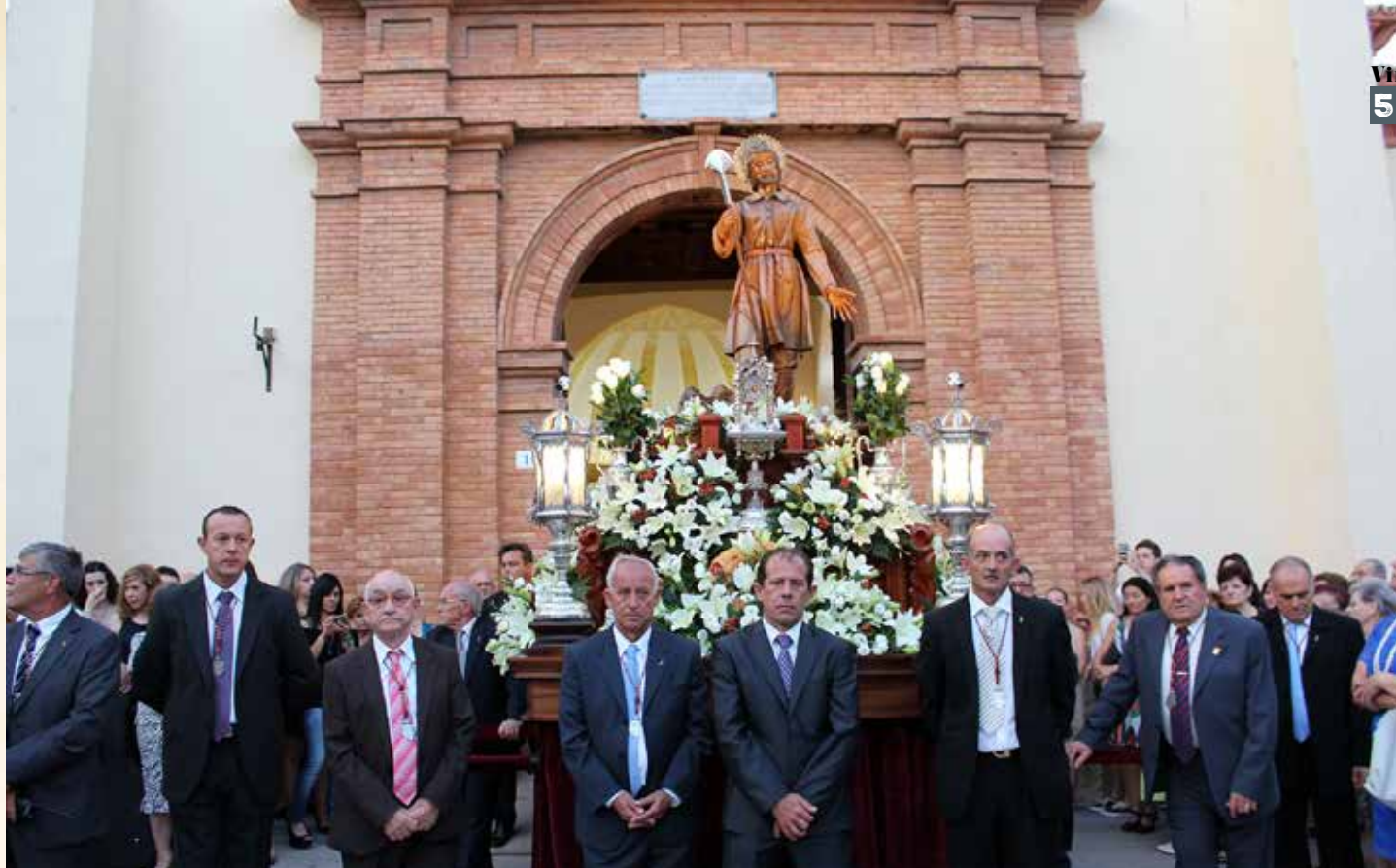
La imagen de San Isidro arropada por los mayordomos y miembros de la Hermandad.

Guerra, pero antes de ésta hubo dos, una chica y una grande. A la grande le decían el parralero en plan gracioso, ya que sólo llevaba un bastón. La otra llevaba las dos vacas, pero en procesión sólo se llevaba el chico. Las dos fueron quemadas en la Guerra, es decir, en total son cuatro”.