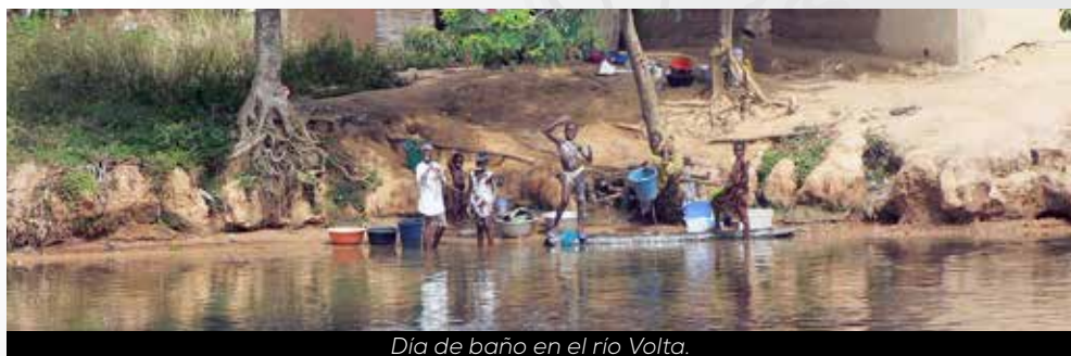
Día de baño en el río Volta.