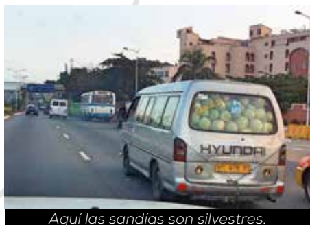
Aquí las sandías son silvestres.

Siempre vuelvo. No tanto como me gustaría. Pero mientras profesionalmente esté en activo, no hay muchas opciones de regreso antes de los 65, salvo que tengamos la sorpresa de un plan para un aeropuerto internacional en El Ejido, donde la entrada de jets privados sea frecuente.