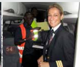
Todo preparado para otro día de vuelo.