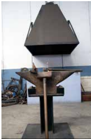
Réplica de la antigua fragua, con Gabriel recordando cómo se trabajaba la fragua hace años.