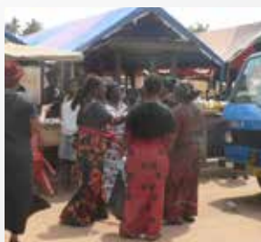
El blanco, rojo y el negro, los colores típicos para los funerales.