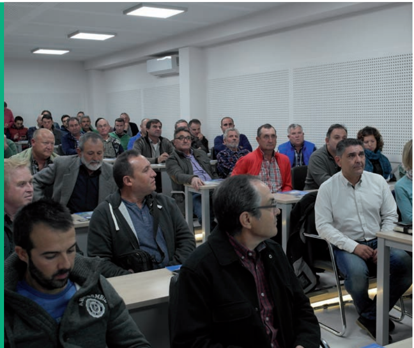
Charla en Agroponiente de Producción Ecológica