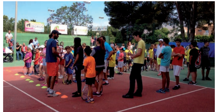
Club de Tenis de El Ejido

amplia oferta de grupos en todos los niveles y horarios, desde 'minitenis', para pequeños de 3 a 6 años, pasando por grupos de iniciación, perfeccionamiento o competición, hasta adultos que quieran aprender o mejorar sus habilidades en este deporte.