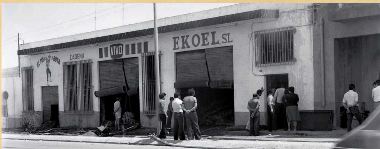
Fachada de Comercial Ekoel en la carretera de Málaga

El almacén tenía grandes dimensiones con una zona elevada donde también almacenaban productos. Daba a la Carretera de Málaga y a la calle Madrid. Junto a él había un taller mecánico, que también se vio afectado por el fuego. Aún se recuerda el incendio, y las consecuencias que tuvo para esta naciente empresa ejidense dedicada a la distribución de productos de alimentación y droguería, entre otros.