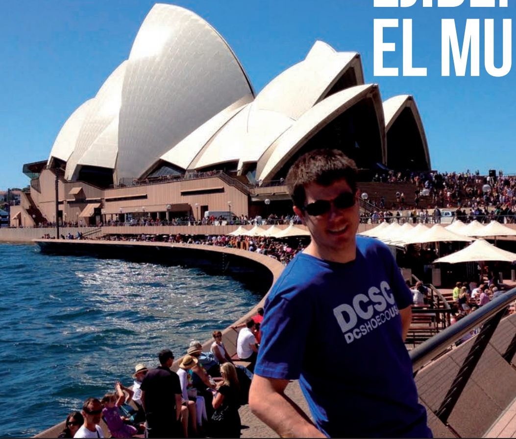
El teatro de la Ópera, uno de los lugares más turísticos de Sídney