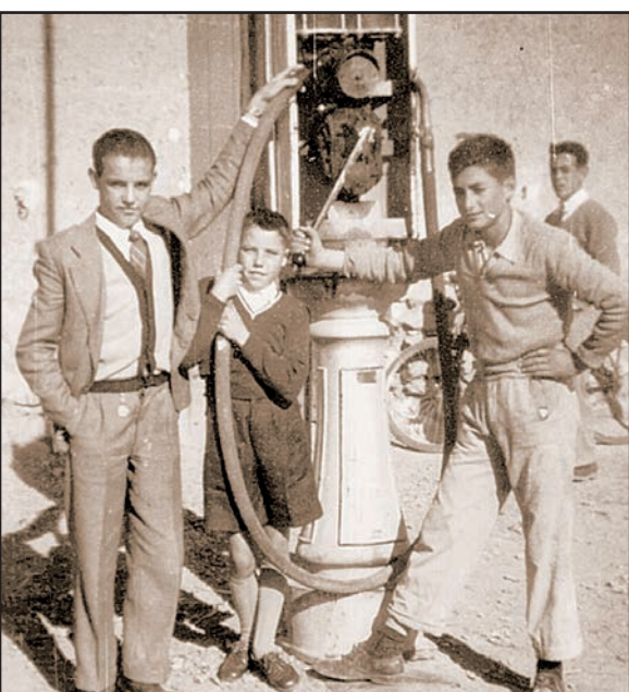
El Surtidor de Góngora estuvo activo durante 40 años y fue un referente económico en la zona

tienda de barrio que ofrecía desde comida hasta alambre, palos, yeso y cemento, entre otras cosas. Quienes conocieron este negocio, recuerdan que junto a la tienda se elaboraban a mano alpargatas que posteriormente se vendían en el establecimiento. Uno de los productos que más se vendían era el esparto para las parras. Y es que El Ejido aún vivía de la industria parralera y no fue hasta los años 70 cuando se dio paso al cultivo bajo plástico. En aquel tiempo, lo habitual era que las familias realizaran sus compras anuales y las pagaran una vez que recogían la cosecha. Una de las tradiciones más famosas de esta época eran las matanzas, que tenían lugar durante los meses de invierno. Así que unos días antes de comenzar, los vecinos acudían a El