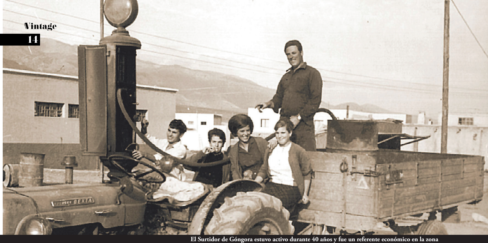
El Surtidor de Góngora estuvo activo durante 40 años y fue un referente económico en la zona