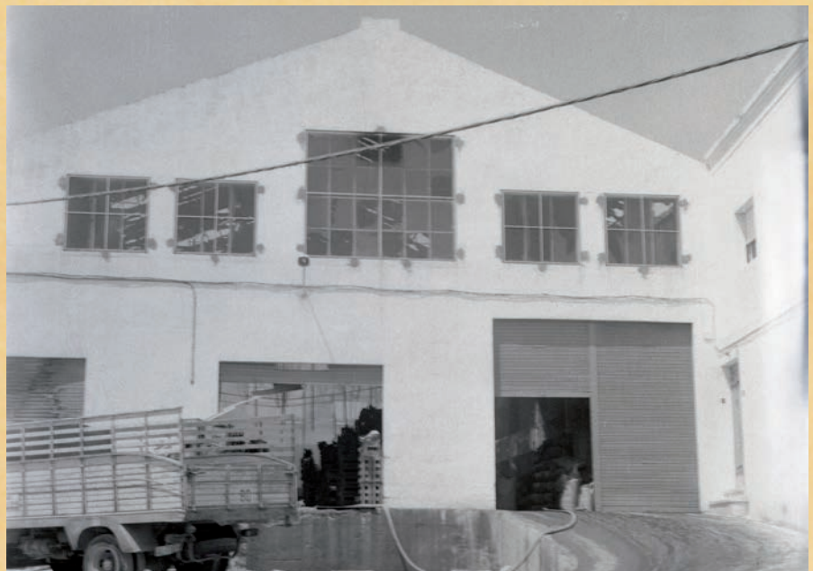
Fachada sur de Comercial Ekoel, en la calle Madrid

Los socios de comercial EKOEL habían sido invitados aquella noche a los actos organizados en honor a San Isidro Labrador en El Parador de Nuestra Señora de la Asunción, en el municipio