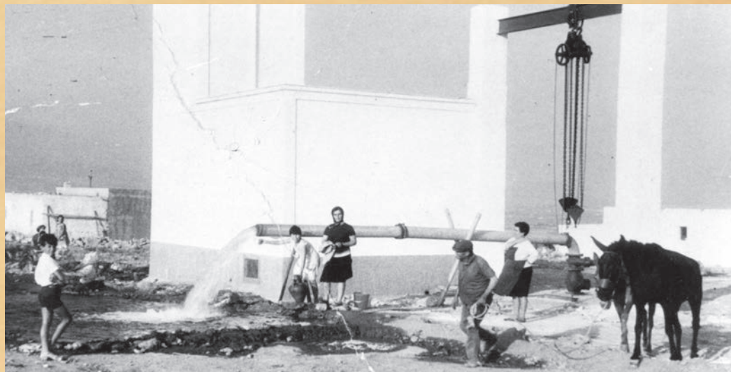
La proliferación de pozos permitió el crecimiento del sector hortícola

Los escasos cultivos de regadío se regaban con aguas de los cauces de San Fernando y Fuente Nueva, con los sobrantes de la vega de Dalías a través de la acequia del Campo y pozos privados. La superficie regada estaría, entonces, por debajo de las 1.000 hectáreas. Los