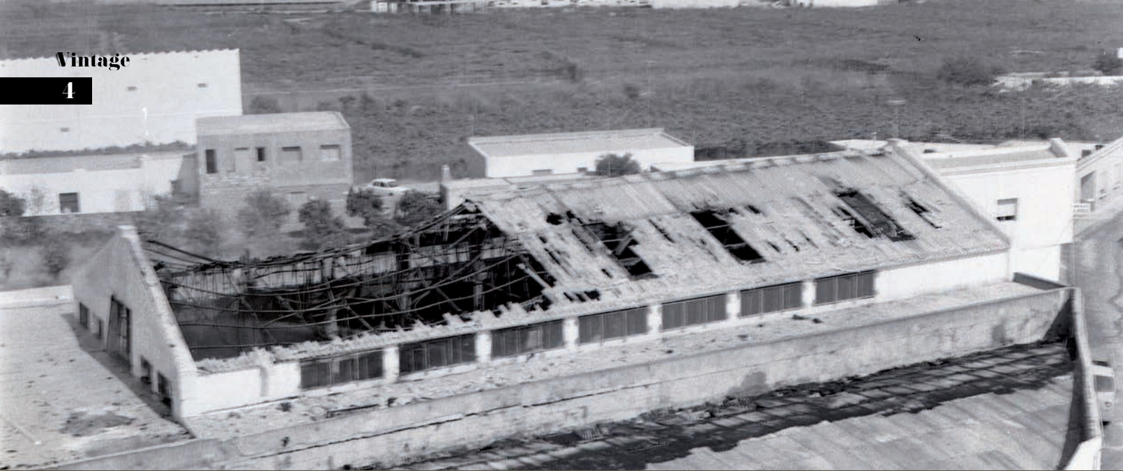
Imagen aérea de las instalaciones de Ekoel, tras el incendio