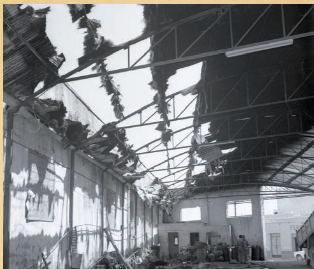
El incendio afectó al almacén de los Hermanos Capilla, situado junto a Ekoel