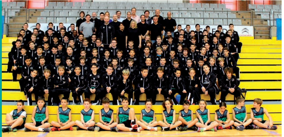
Categorías inferiores de Baloncesto Murgi

El Club Baloncesto Murgi presenta las categorías inferiores de esta temporada, formadas por siete equipos federados que reúnen a un total de 120 niños. Junto a ellos, este club ejidense cuenta también con cuatro Escuelas Deportivas Municipales que sirven de base al propio ente deportivo. Estos jóvenes deportistas son, además, embajadores de los productos que se cultivan en su tierra, ya que lucen en sus equipaciones el distintivo de la campaña municipal 'El Ejido, Gourmet Quality'