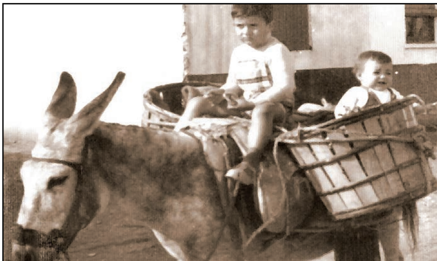
El Surtidor, lugar de paso obligado por las bestias y vehículos.