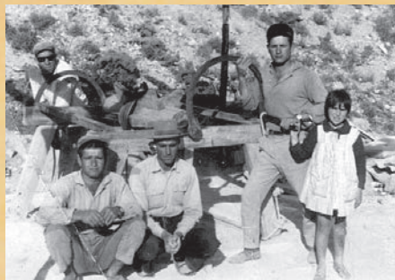
Excavación del pozo de La Trocha, de 120 metros de profundidad con un torno de 1958

En el primer nivel hay que destacar que la zona de El Ejido se benefició en gran medida de las ayudas fijadas, que permitían desde la transformación en regadío a construcción de pozos o viviendas para jornaleros. En un principio, el INC actuó como prestamista de los agricultores, papel que después pasaría a ser desempeñado por el Bando de Crédito Agrícola y las Cajas de Ahorros y Rurales.