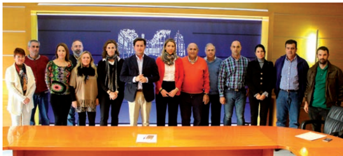
Acto de entrega de las subvenciones a clubes y deportistas