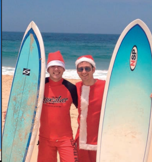
El día de Navidad haciendo surf

Europa. Al principio también te comes bastante la cabeza, sobre todo por la noche, pensando que si pasa algo en España tardas un día y medio o dos en llegar.