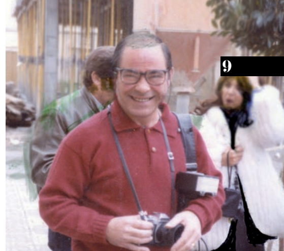
Con sus aperos en una imagen tomada en la calle Iglesia en los años 70