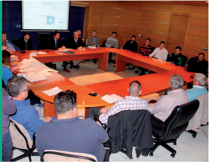
Acto de presentación del plan de pluviales para invernaderos

fincas dispongan de los sistemas necesarios para recoger los primeros 35 litros por metro cuadrado que se produzcan en una precipitación fuerte, ya sea mediante sistemas de embalse para aprovechamiento o mediante sistemas de filtrado al subsuelo para recargar los acuíferos. Lo que se pretende es evitar inundaciones de fincas con importantes daños en cosechas, muros, caminos y canales de riego.