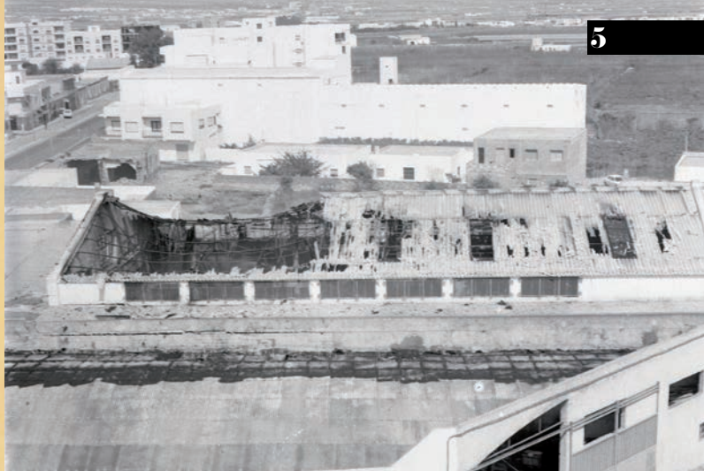
Imagen aérea de las naves de Ekoel y Hermanos Capilla, tras el incendio