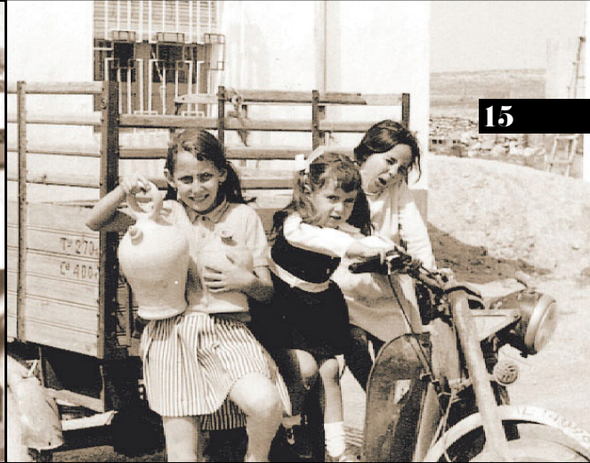
El isocarro, otro vehículo que visitaba con frecuencia El Surtidor