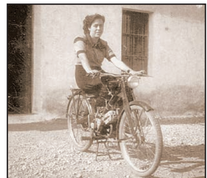
Las motos eran el vehículo habitual de la época