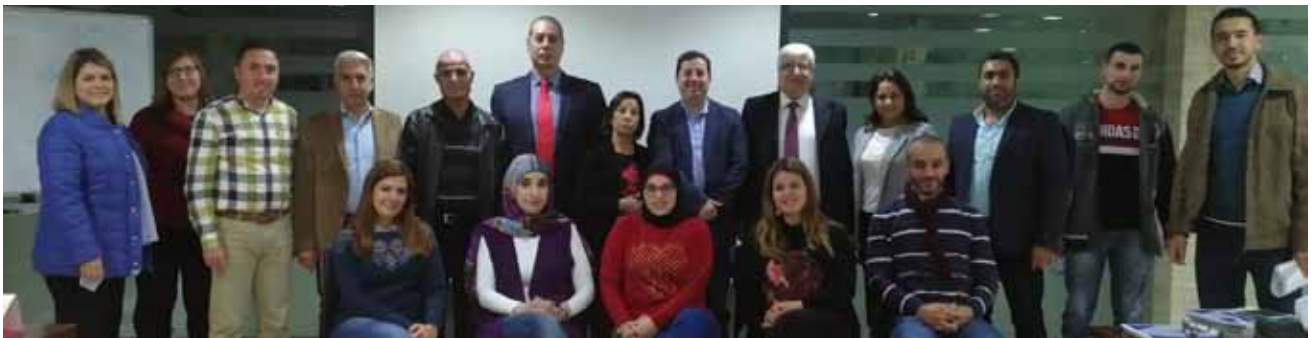
المحاضر مع الزملاء في طرابلس