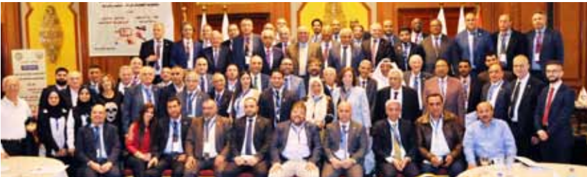
القاهرة - جمهورية مصر العربية ٢٠١٩.