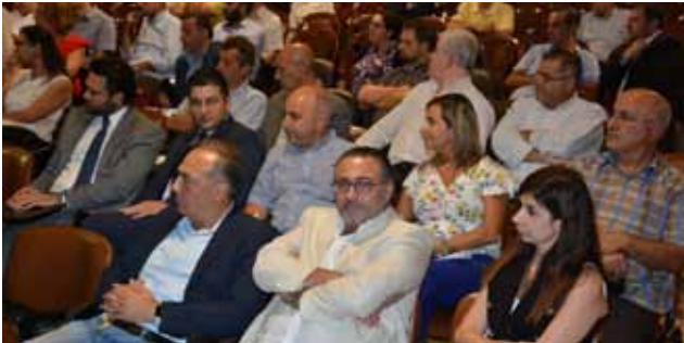
الحضور في بيروت