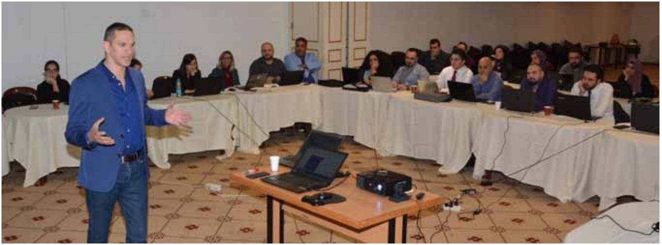
خلال ورش العمل