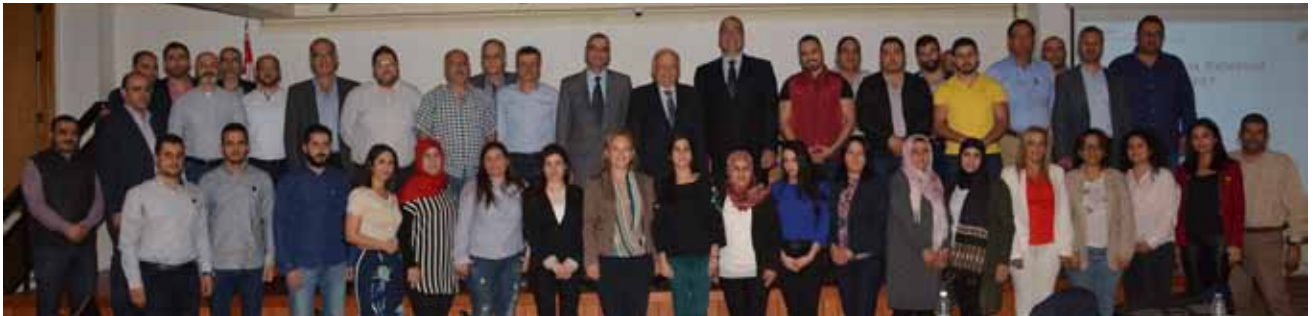
الحضور في ورشة عمل بيروت

نظمت نقابة خبراء المحاسبة المجازين في لبنان ورشتي عمل بعنوان الرقابة الداخلية، التدقيق الداخلي: بين المفاهيم والمعايير يومي ٦ و ٧ تشرين الاول ٢٠١٨ في قاعة مركز النقابة في بيروت وفي ١ كانون الاول ٢٠١٨ في قاعة غرفة التجارة والصناعة في طرابلس.