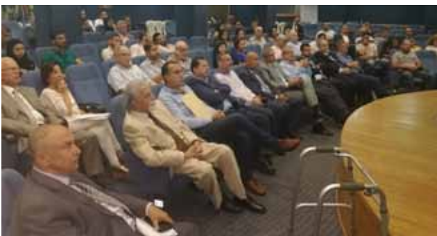
جانب من الحضور في طرابلس

أتت هذه الندوات ضمن برنامج عمل متكامل بين النقابة والهيئة حول موضوع مكافحة تبييض الأموال وتمويل الإرهاب والموجبات الملقاة على عاتق خبير المحاسبة والإجراءات الواجب اتخاذها بناءً للقانون ٢٠١٥/٤٤ مكافحة تبييض الأموال وتمويل