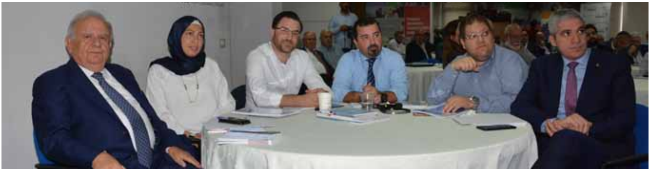
خلال ورشة العمل.