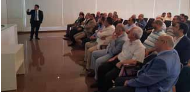
صيدا: خلال المحاضرة