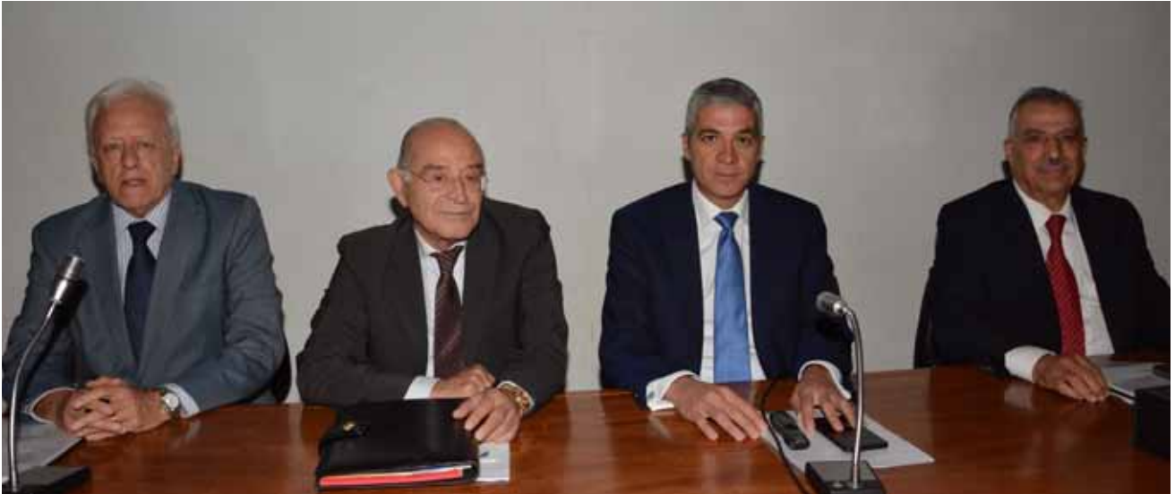
رئيس وأعضاء الهيئة مع نائب النقيب

برنامج الرقابة النوعية من خلال تطبيق الرقابة النوعية ومراجعة النظير للشركات المدنية ومكاتب التدقيق والمدققين الأفراد.