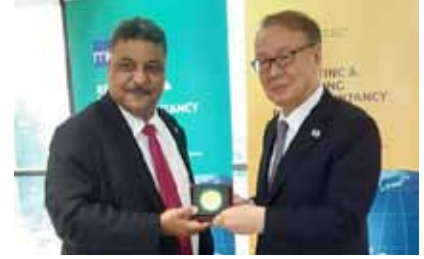
كوالالمبور - ماليزيا ٢٠١٩.