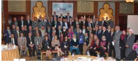
القاهرة - جمهورية مصر العربية ٢٠١٩.