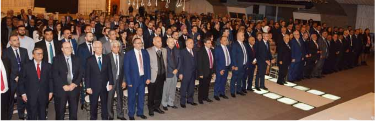
الافتتاح بالنشيد الوطني

اليوم لا يعني تقاعدكم عن العمل ولا يفسّر كذلك، إن تكريمكم اليوم يجب أن يشكل حافزاً إضافياً لمتابعة العطاء وتحمل المسؤولية، إنني أطلب منكم وأرجوكم متابعة المسيرة المهنية لأن النقابة والوطن والمجتمع هم بحاجة إلى أمثالكم من المهنيين أصحاب الخبرات المميزة والمتعددة الذين عملوا طوال هذه السنوات محافظين على أدائهم المهني ملتزمين بالمعايير والقواعد والأدبيات المهنية. لكم مني ومن أعضاء مجلس النقابة وكافة الزملاء، صافي المودة وجزيل الاحترام وكل التقدير.