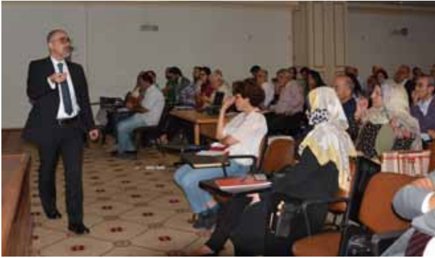
خلال ورشة العمل