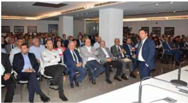
بيروت: خلال المحاضرة