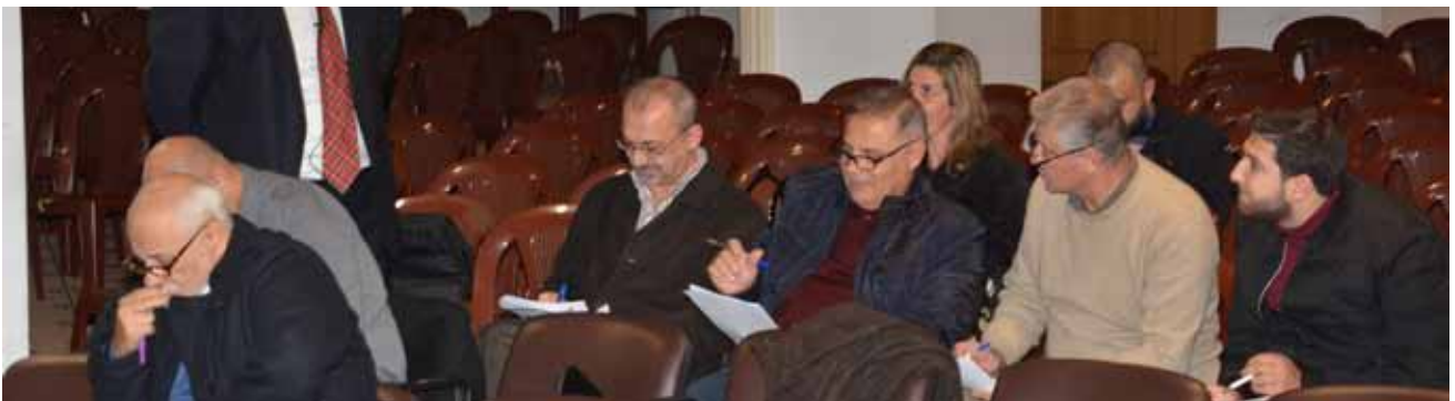
الحضور خلال التمارين