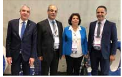
سيدني - استراليا ٢٠١٨.