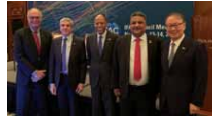
فانكوفر - كندا ٢٠١٩.