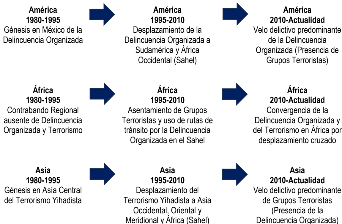
Ilustración 1. 3 ejes espaciales y 3 ejes temporales de la teoría de desplazamiento sistémico. Fuente: elaboración propia de Cesar Humberto Martínez Mancilla, 2026.

El contraste se realizará a partir de una lectura transregional, centrada en los tres ejes espaciales y tres ejes temporales principales: