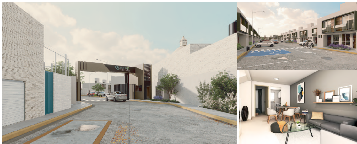
Las imágenes mostradas son de carácter ilustrativo