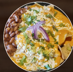
Chilaquiles con Chipotle

Deliciosos chilaquiles en cuadro o tira con queso chihuahua, queso panela y crema, salsa a elegir y pollo acompañados de frijoles.