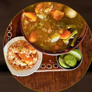
Caldo de Res

Caldillo con carne de res acompañado de cebolla, tomate y frijoles de la olla al puro estilo de los vaqueros coahuilenses.