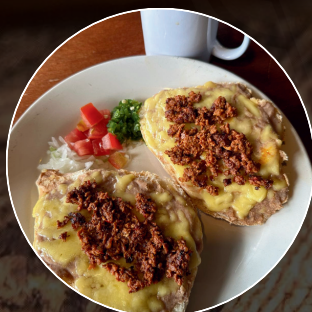
Molletes Los ahijados