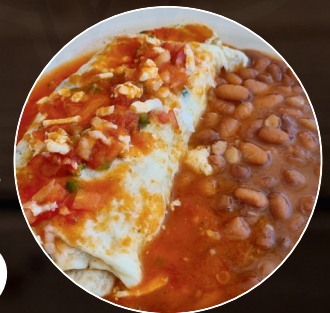
Forastero Especial Salseado

Omelette con queso chihuahua, un ingrediente (fajita de res, pollo o chicharrón de cachete), morrón y cebolla.