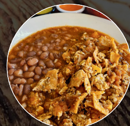
Migas de Barrio

Miguitas con huevo y chorizo de Múzquiz en salsa tatemada.