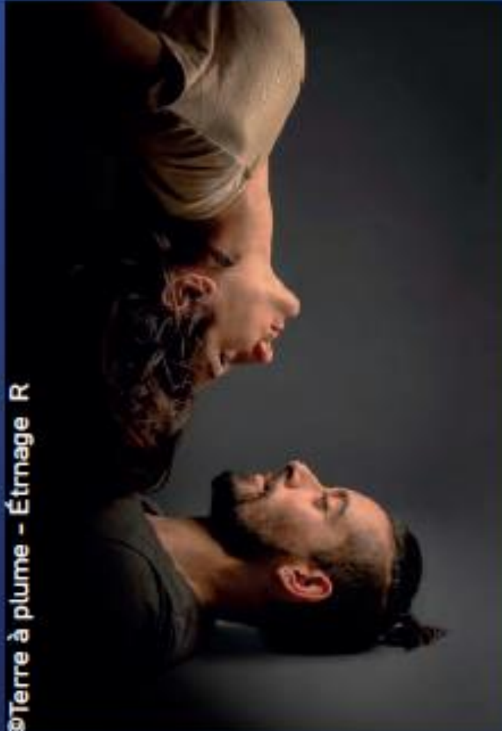
@Terre à plume - Étrange R