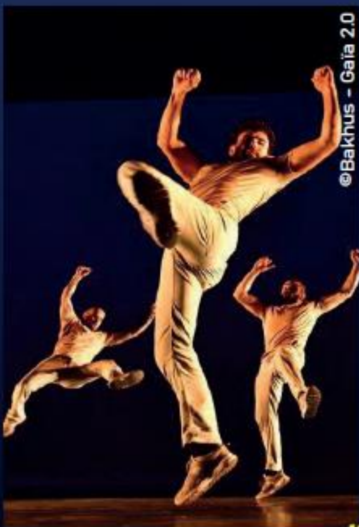
@Bakhus - Gaïa 2.0