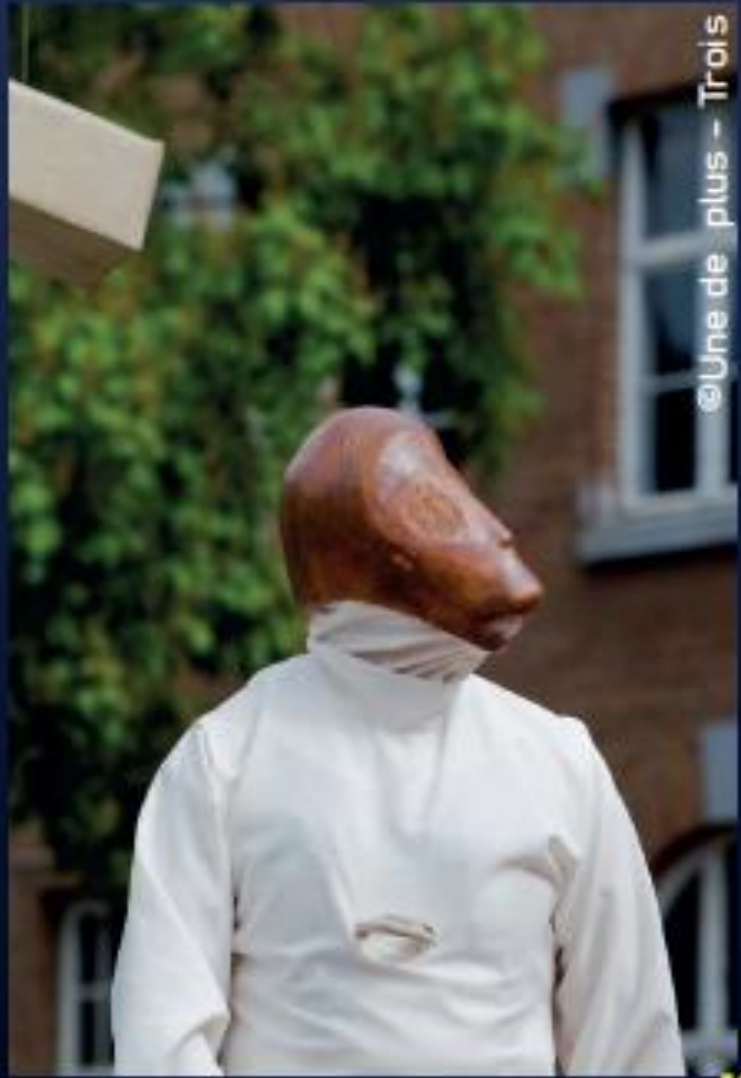
@Une de plus - Trois