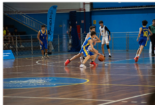
MARISTINHA (609 Sul)