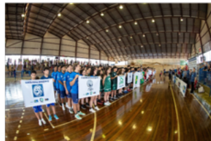
PORTUGUESA (Taguatinga Sul)