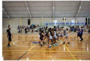
IATE CLUBE (Setor de Clubes Norte)