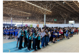
PAVILHÃO DO PARQUE DA CIDADE