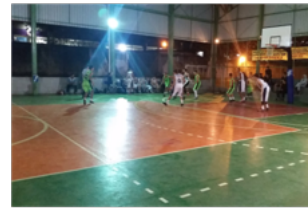
CEF 03 (Taguatinga Sul)