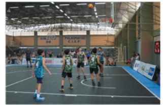
CIEF (907 Sul)