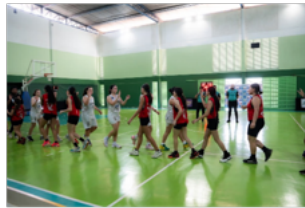
ASEEL (Setor de Clubes Sul)