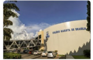
MARISTÃO (615 Sul)