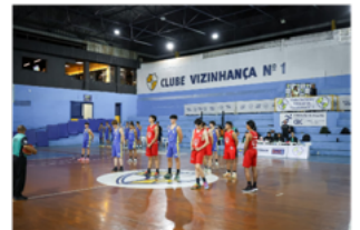
VIZINHANÇA (EQS 108/109)