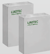
Baterías 2 Baterías LIADTEC LP048054AD (48V - 54Ah)