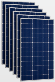
Paneles solares 6 Paneles Solares 550Wp

Es un sistema completo que aprovecha la energía del sol para darle electricidad a tu hogar.