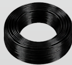
Cableado Cableado e instalación