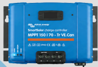
Inversor 1 Inversor EasySolar-II GX MPPT 250/70