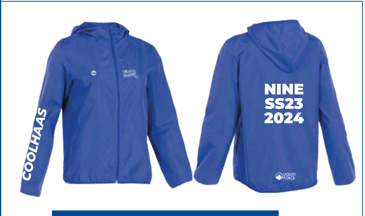
Rompevientos / Opcional Anorak Color: Negro, amarillo o Azul / Estampa: Blanco o negro Talles: S, M, L, XL, XXL