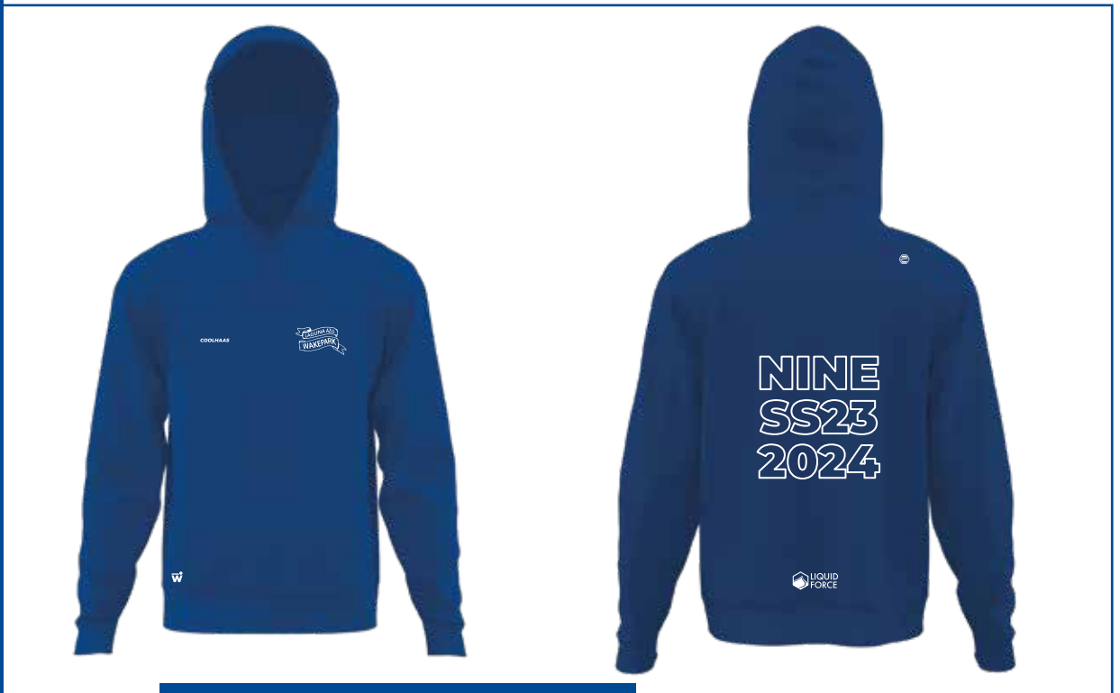
Hoodie / Friza Color: Azul marino / Estampa: Blanco Talles: S, M, L, XL, XXL