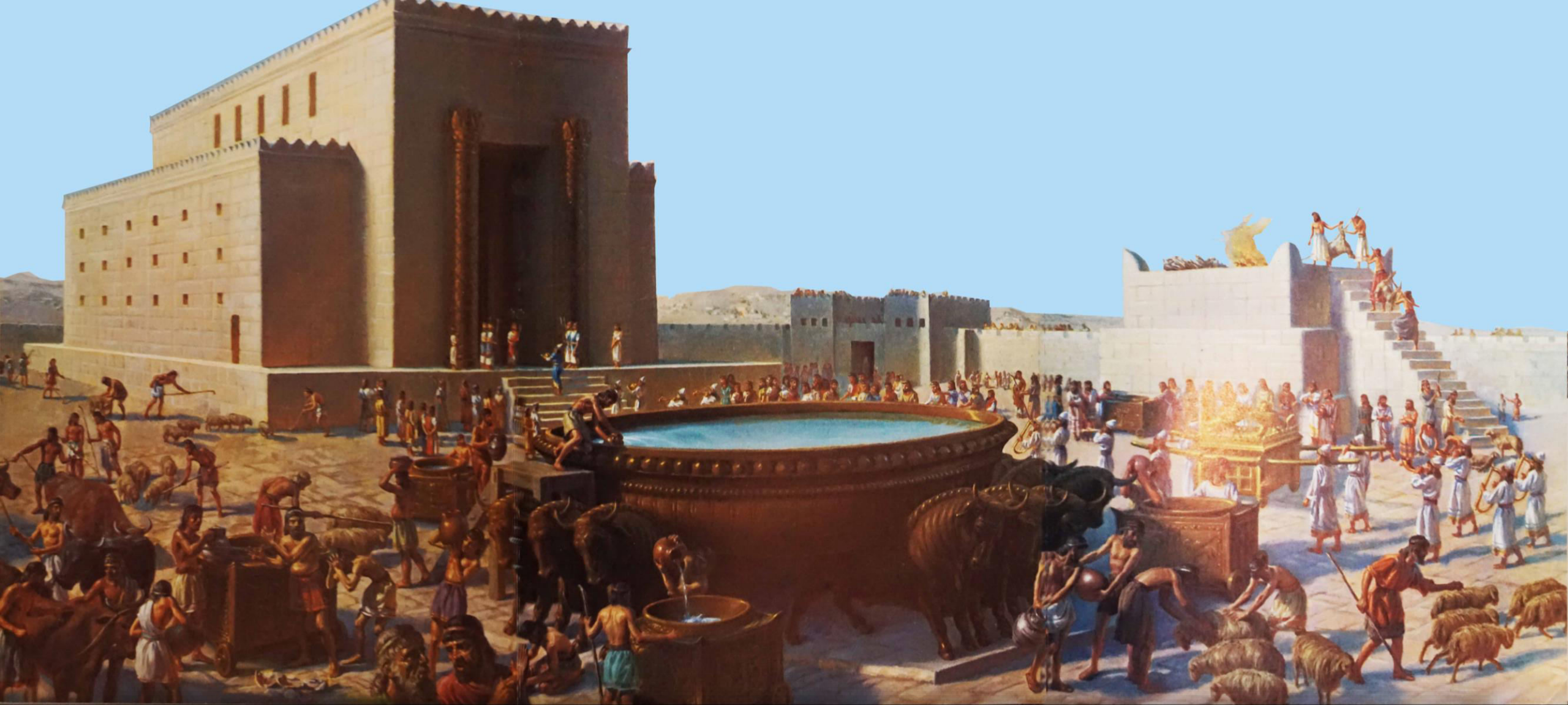
Salomos Tempelbau (1,18-7,22)