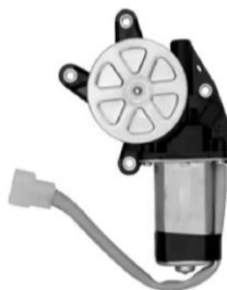
Chicote cinza (Motor Esquerdo)

Quando o motor for do lado direito o chicote deverá estar na cor preta.