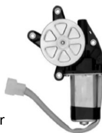
Chicote cinza (Motor Esquerdo)

Imagem do produto e descrições de montagem para o lado direito, porém toda parte técnica de aplicação também é utilizada no modelo S-40.007 lado esquerdo.