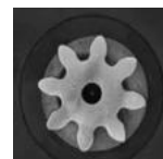
Modelo 8 dentes