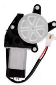
Chicote preto (Motor Direito)