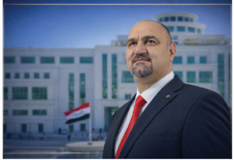
Cephesi Listesi başkanı olarak belirlendi.

Ağa, 2 Mayıs 2025'te de Türkmen siyasi partilerince Birleşik Irak Türkmenleri