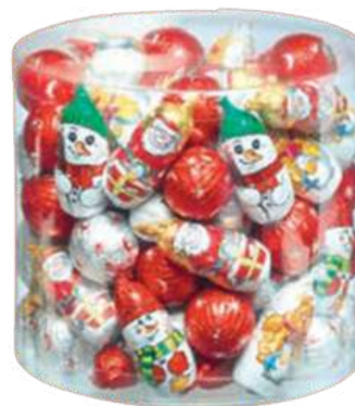
Mix chocolate navideño (80unid x tarro aprox.) REF- CHT01 PV: 0,37€/unidad Tarro: 29,60€