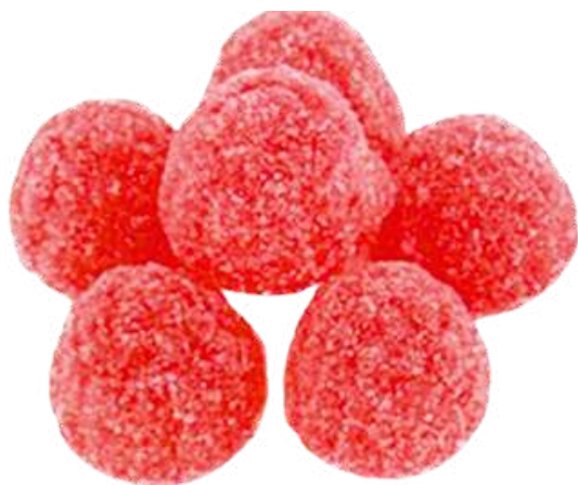
Fresones 1 Kg (SIN GLUTEN) REF-NVG8 PV: 5,75€ Pedido mínimo: 6 kg