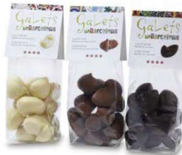
BOLSAS GALETS DE CHOCOLATE BLANCO, NEGRO Y CON LECHE 144g REF-XMG144 PV: 7,45€/bolsa Pedido Mínimo: 21 cajas