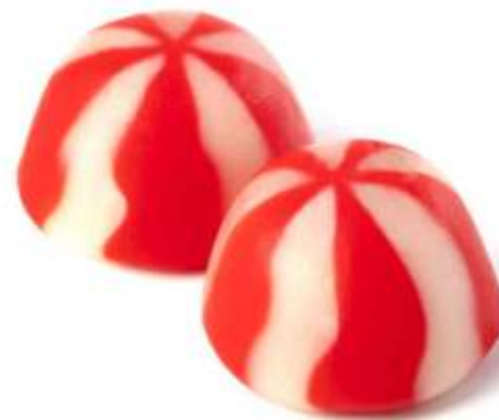
Besos Twist bolsa (250 unid) (SIN GLUTEN) REF-NVG6 PV: 11,25€ Pedido mínimo: 6 bolsas