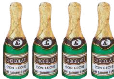
Botellas Chocolate 6 cm alto x 1,8 cm ancho (8g - 60 unid) REF- CH006 PV: 0,37€/unidad Tarro 60 unid: 22,20€