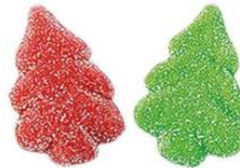
Árboles de navidad sabor a fresa y manzana los árboles Bolsa 1Kg. (SIN GLUTEN) REF-NVG3 PV: 8,25€ Pedido mínimo: 6 bolsas