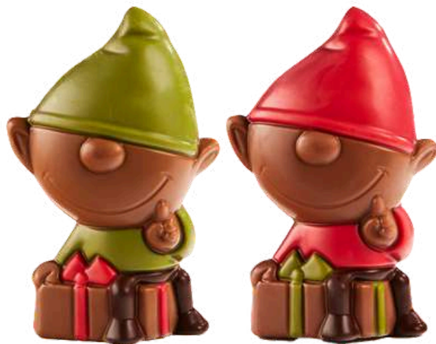
ELFOS NAVIDEÑOS 40G (10uds) REF-XMR40 PV: 4,80€/unidad Caja: 48€ Pedido Mínimo: 30 uds.