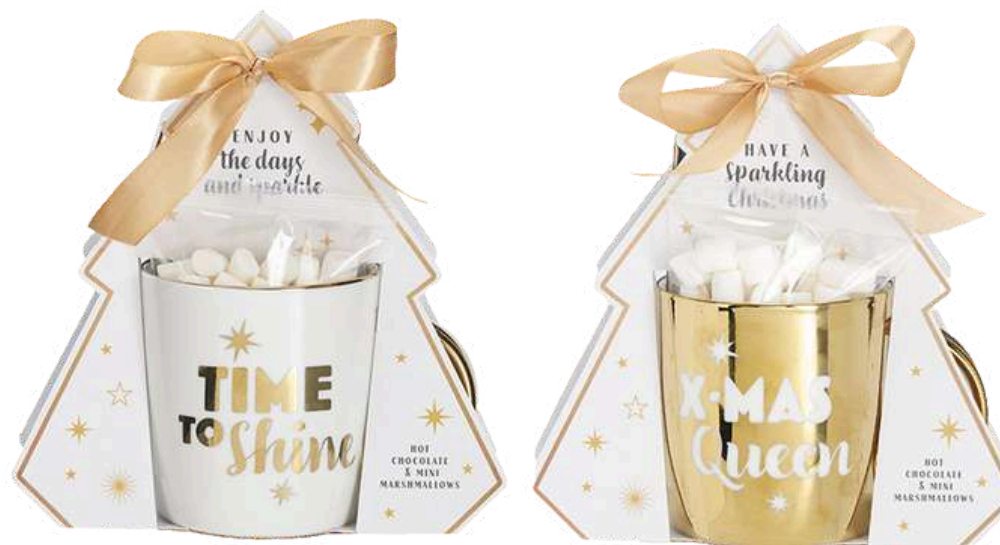
Tazas navideñas con Chocolate a la taza y mini marshmallows REF- TZN2 PV: 5,45€ unid.