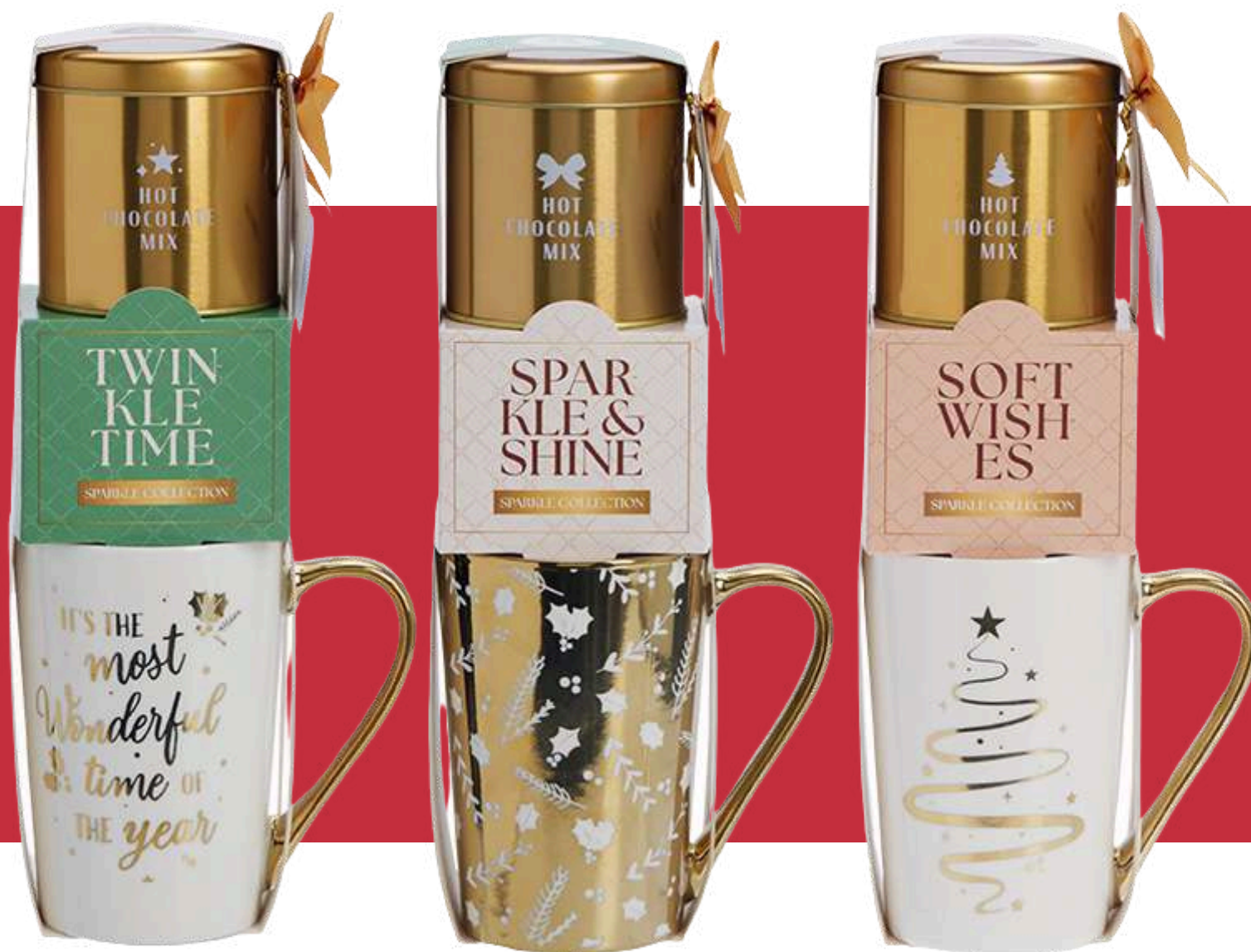
Tazas navideñas con Chocolate en polvo y cookie. REF- TZN3 PV: 9,90€