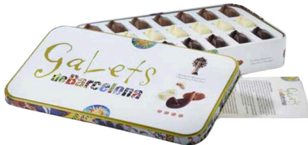
LATA GALETS DE CHOCOLATE BLANCO, NEGRO Y CON LECHE 320g REF-XMG320 PV: 16,10€/caja Pedido Mínimo: 12 cajas