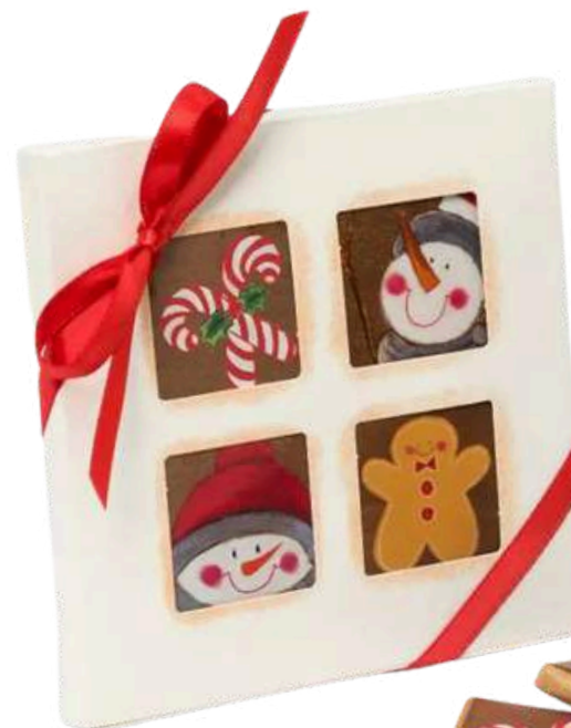
Estuche con 4 chocolatinas navideñas y cinta roja con lazo. Medidas 10,5x10,5x1,4 cm. REF- NEB9 PV: 2,45€