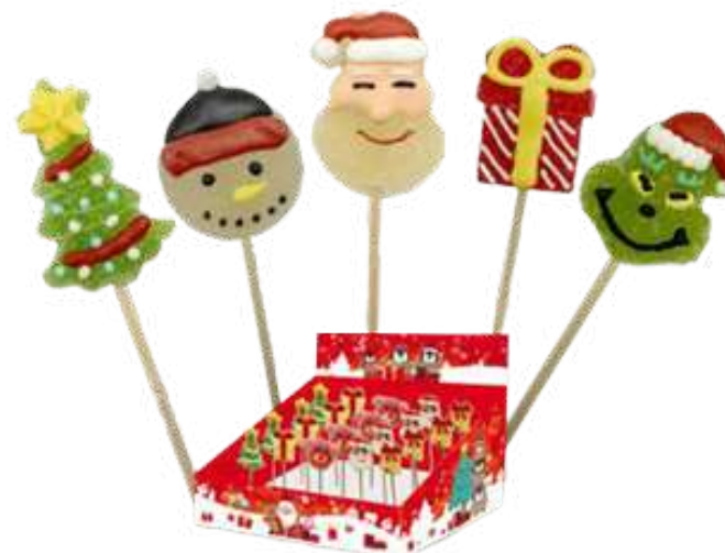
PIRULETAS JELLY XMAS 12g Caja: 48 unid. (SIN GLUTEN) REF-BCN5 PV: 0,45€/unid Pedido mínimo: 96 unid