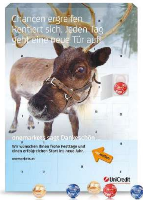
Calendario de adviento personalizable y relleno de chocolatinas Lindor 110g Medidas aprox: 22x16x2,5 cm REF- CAPCH10 PV: 15,54€ Pedido mínimo: 100 uds.