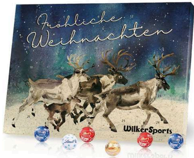
Calendario de adviento personalizable y relleno de chocolatinas Lindor 110g Medidas aprox: 31x23x2,3 cm REF- CAPCH9 PV: 17,30€ Pedido mínimo: 100 uds.