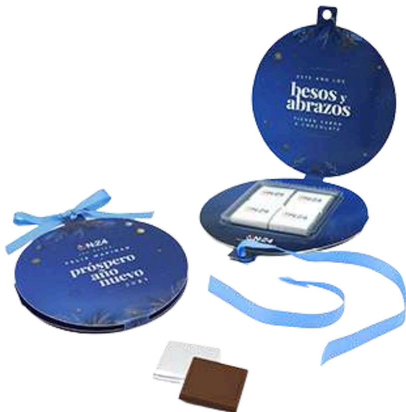
Postal Bola de Navidad con 4 napolitanas de chocolate. Medidas aprox.: 14,5x14,5x1 cm REF - P4NB Consultar tarifas según cantidad Pedido mínimo: 100 unidades