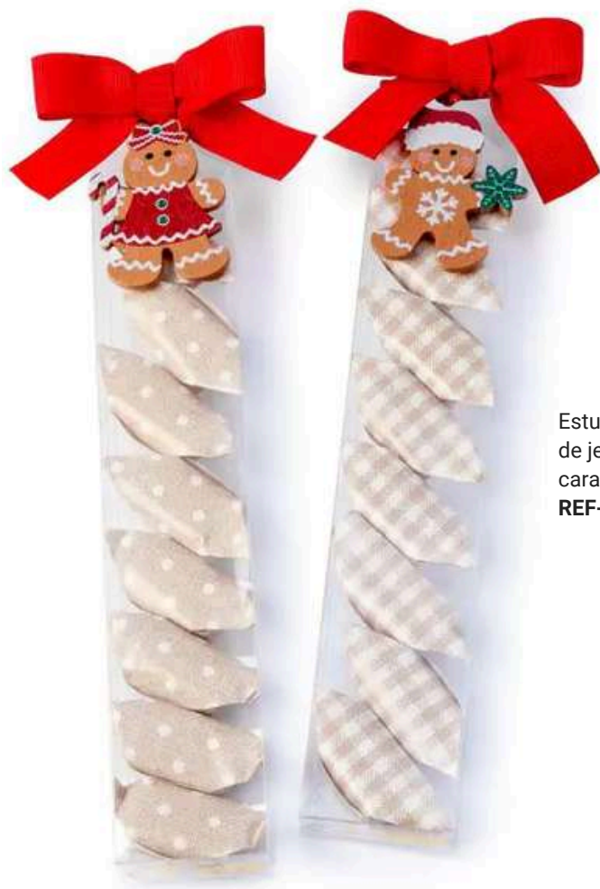
Estuche navideño con adorno de galletita de jengibre. Dos modelos. Contienen 8 caramelos. Medida: 20,5x3,5 cm REF- ED18 PV: 1,80€