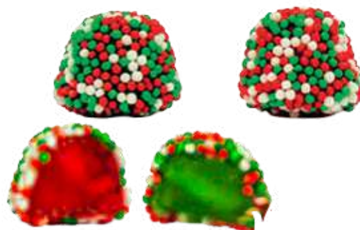
Moras navideñas sabor cereza y cola. Bolsa 1Kg. (SIN GLUTEN) REF-NVG6 PV: 7,90€ Pedido mínimo: 6 bolsas