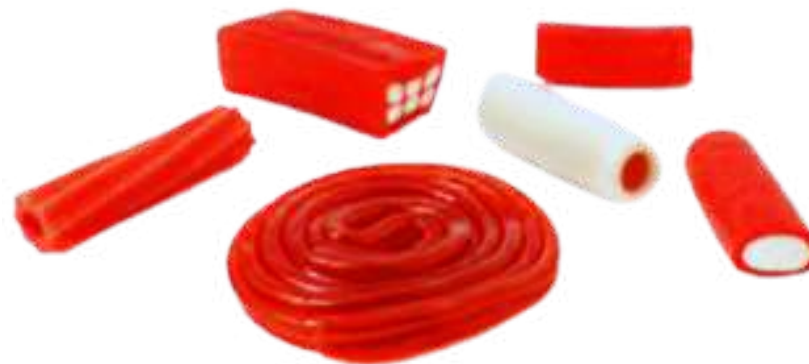
Mix favoritos regaliz 1 Kg REF-NVG10 PV: 7,75€ Pedido mínimo: 6 kg