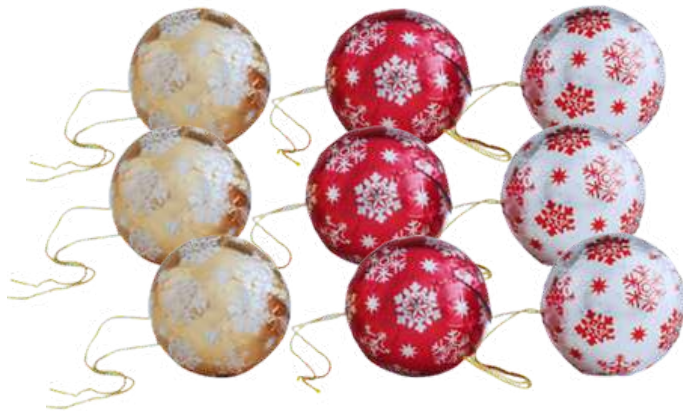
BOLAS NAVIDAD CHOC. 12g - 60 unid. REF-XM7 PV: 0,40€ Tarro 60 uds: 25€