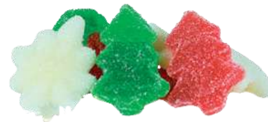
Mix Navidad azúcar Bolsa 1Kg. (SIN GLUTEN) REF-NVG7 PV: 7,90€ Pedido mínimo: 6 bolsas