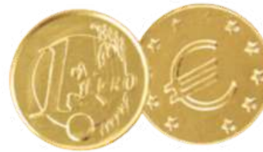
MONEDAS CHOCOLATE CON LECHE 28MM. Bolsa: 300 unid REF-XM8 PV: 0,09€/unid Precio bolsa: 26,60€ Pedido mínimo: 5 bolsas