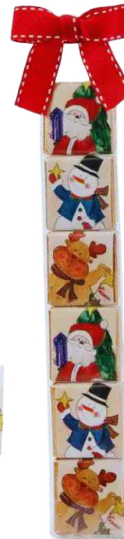
Estuche con 6 napolitanas de chocolate con leche al 32% de cacao con diseños navideños. REF- B146. PV: 2,75€