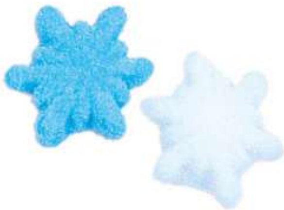
Copos de nieve sabor a nata y a frambuesa Bolsa 1Kg. (SIN GLUTEN) REF-NVG2 PV: 8,25€ Pedido mínimo: 6 bolsas