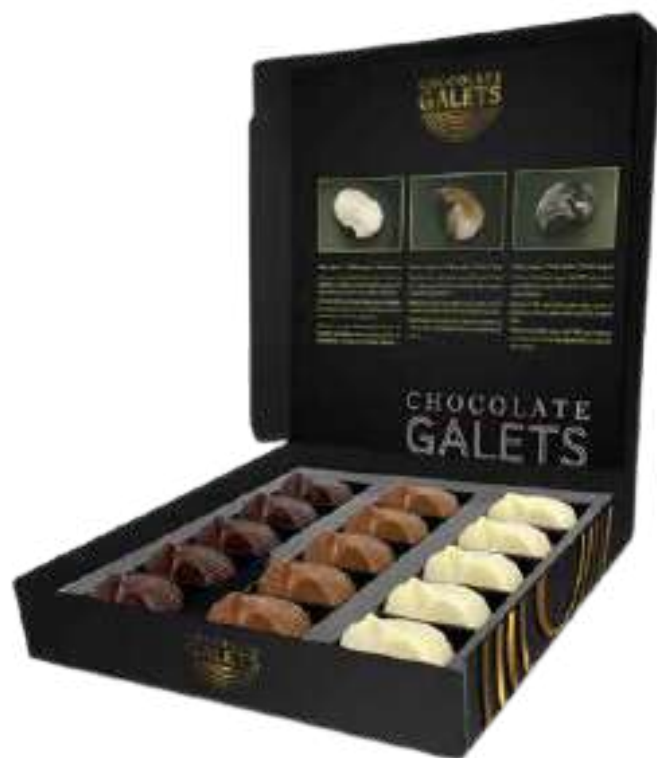
ESTUCHE GALETS DE CHOCOLATE BLANCO, NEGRO Y CON LECHE 15 uds 235g REF-XMG235 PV: 10,75€/caja Pedido Mínimo: 18 cajas