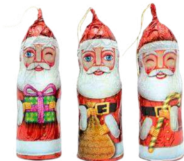
PAPA NOEL CHOCO 25g REF-XM1 PV: 0,90€/unid Tarro 20 unid: 18€