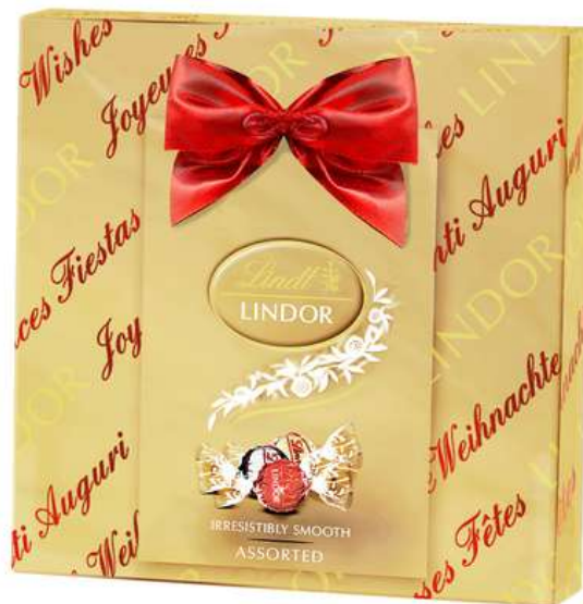
Caja regalo bombones Lindor 137g REF- LT137 PV: 9,20€