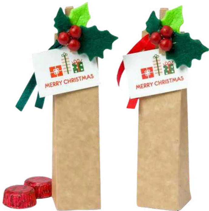
Estuches color kraft 3,5x17cm con 2 bombones de chocolate con leche al 32% de cacao. Decoración: pinza de acebo en fieltro con tarjeta Merry Christmas. REF- B173. PV: 2,35€ /unidad