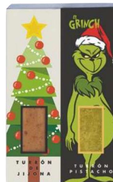
Set 2 mini turróns 2x50g=100g GRINCH REF - ST301 PV: 6,90€