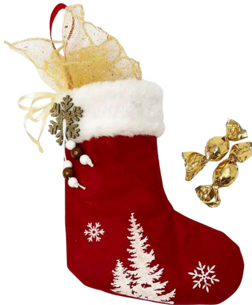
Calcetín típico navideño en color rojo con abeto y copo de nieve dorado con 5 chocolates crocantes.