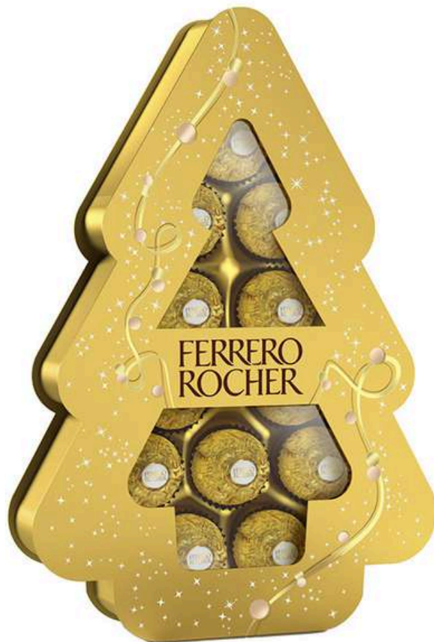
Caja 12 bombones Ferrero Rocher 129g REF- FR129 PV: 8,90€