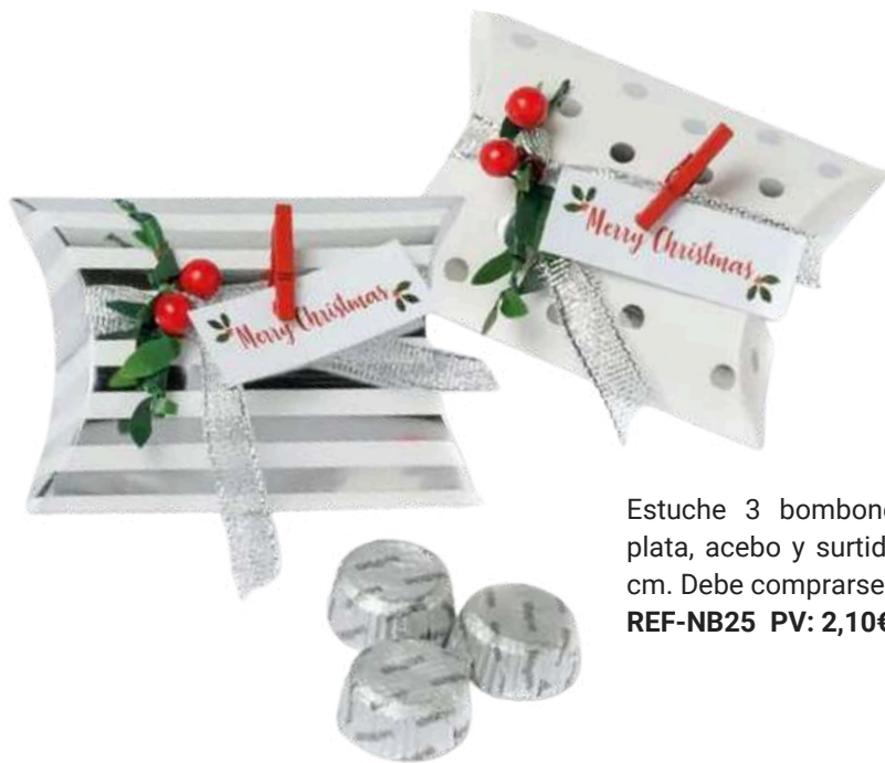
Estuche 3 bombones topos y rayas plata, acebo y surtido. Medidas: 9x6x4 cm. Debe comprarse en múltiplos de 2. REF-NB25 PV: 2,10€