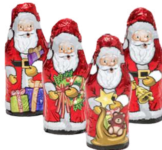
PAPA NOEL CHOCO 30g REF-XM3 PV: 0,97€/unid Tarro 14 unid: 13,58€