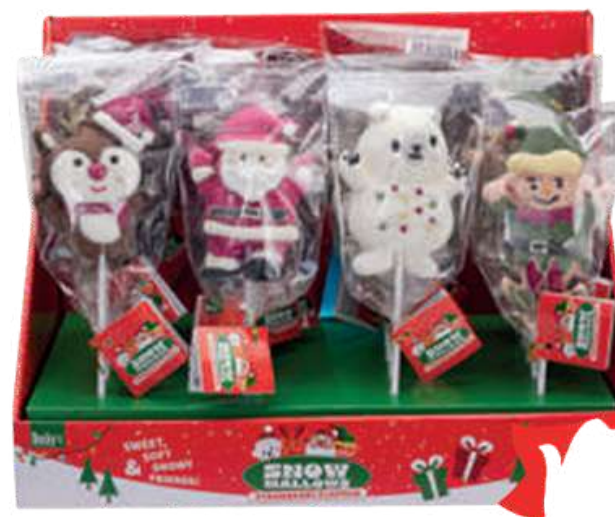
PIRULETAS MARSHMALLOW XMAS 45g Caja: 24 unid. (SIN GLUTEN) REF-BCN30 PV: 0,90€/unid Pedido mínimo: 48 unid