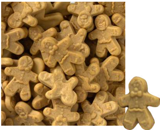
Foam con forma de galleta de jengibre. Bolsa 1Kg (SIN GLUTEN) REF-NVG5 PV: 7,50€ Pedido mínimo: 6 bolsas