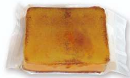
Corte turrón Crema Catalana 150g En bolsa Rilsan: PV: 6,20€ En caja: PV: 6,70€