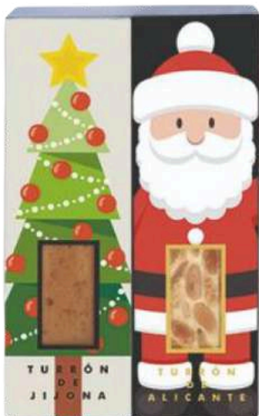
Set 2 mini turróns 2x50g=100g NAVIDAD REF - ST276 PV: 6,90€