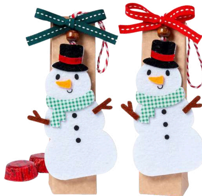
Estuches color kraft 3,5x15cm con 2 bombones de chocolate con leche al 32% de cacao. Decoración: muñeco de nieve hecho de fieltro. Estuches surtidos en 2 modelos con lazo verde y lazo rojo. REF- B21. PV: 2,60€ /unidad