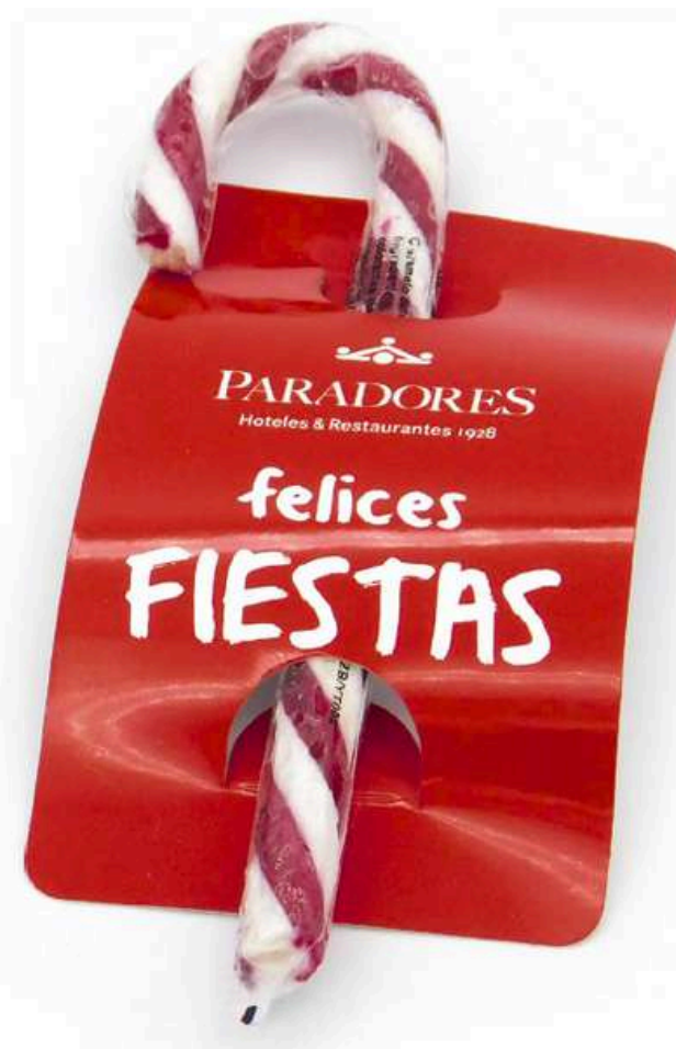
STICK NAVIDAD CARAMELO 17x4 cm. Peso: 28 g. Targeta cuatricromía 1 cara. REF-BCP28 Consultar tarifas. A partir de 400 unid