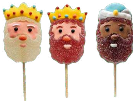
PIRULETAS JELLY REYES MAGOS 30g Caja: 12 unid. (SIN GLUTEN) REF-BCN30 PV: 0,90€/unid Pedido mínimo: 48 unid