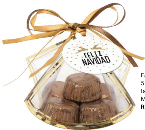
Estuche con rayas doradas. Contiene 5 bombones de chocolate con leche y tarjeta con mensaje Feliz Navidad. Medidas: 7cm. REF- EB09 PV: 2,75€