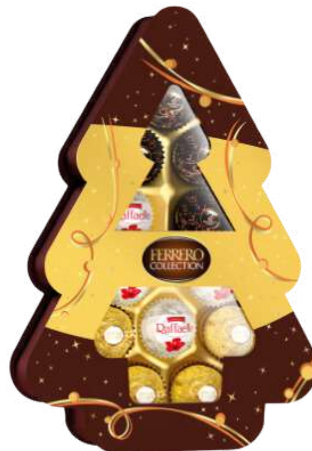
Caja 12 bombones Ferrero Rocher y Raffaello 129g REF- FR129C PV: 8,90€