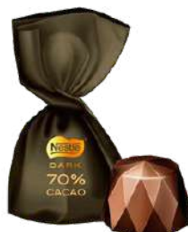
Caja Dark Sublime 70% cacao 142g REF- NT2 PV: 4,90€