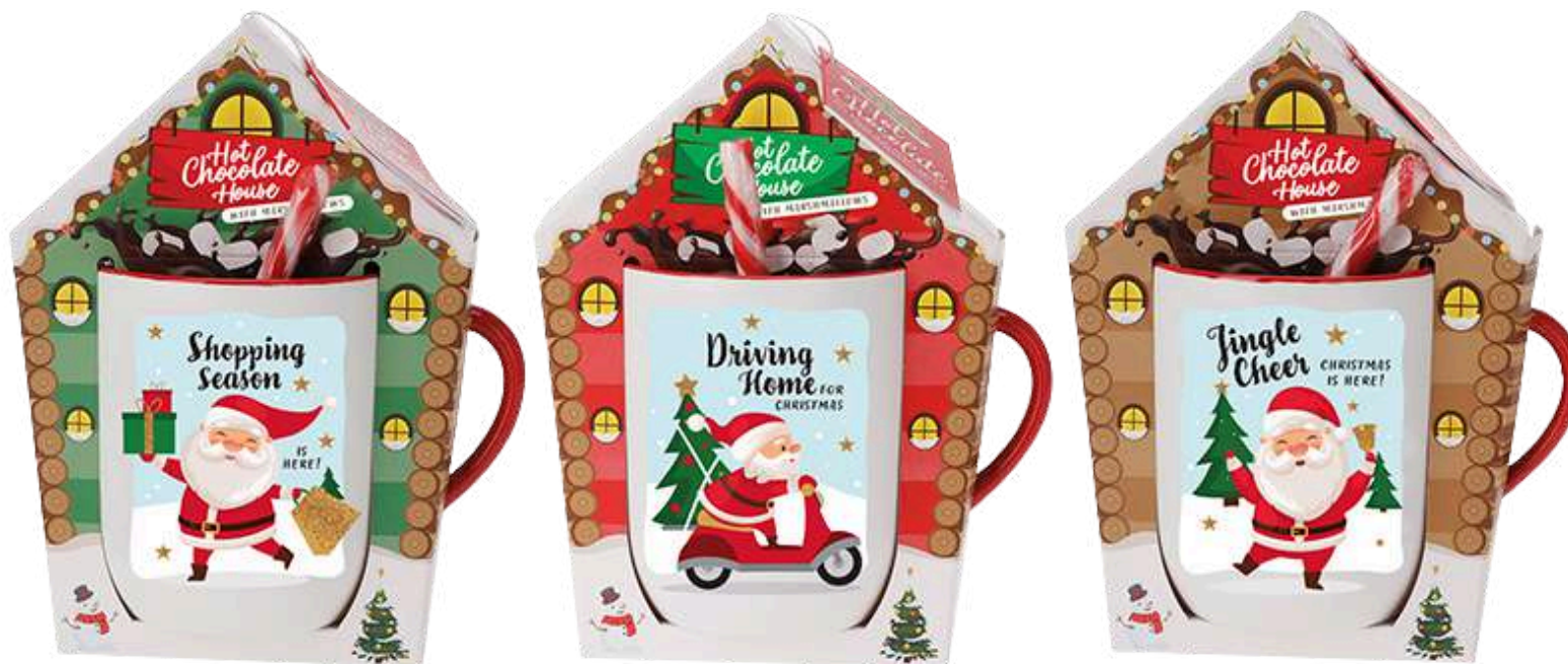
Tazas navideñas con Chocolate a la taza, marshmallow y bastón de caramelo. Tres modelos variados al azar REF- TZN1 PV: 5,90€ unid.