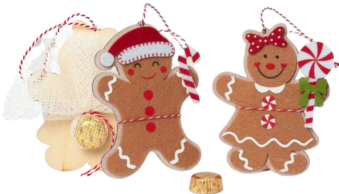
Colgante fieltro y madera galletas jengibre con cordel y bolsita con bombón. Medida: 13cm REF-AB116 PV: 2,55€