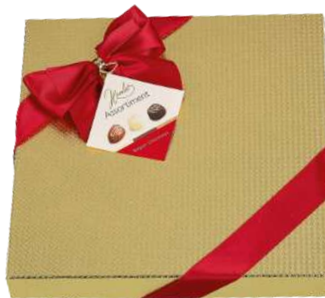
Caja surtido bombones Hamlet 250g REF-HT250 PV: 12,60€