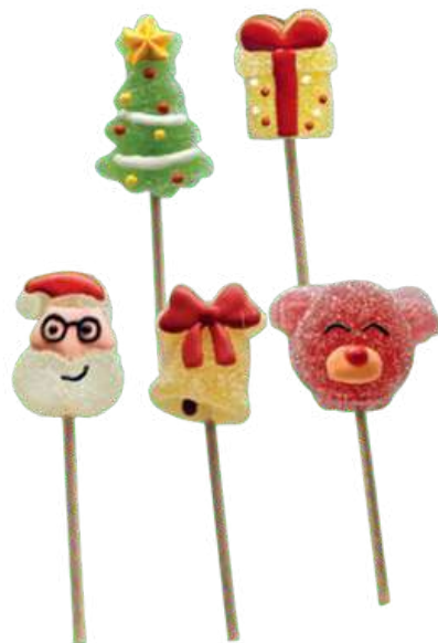
PIRULETAS JELLY XMAS 12g Caja: 48 unid. (SIN GLUTEN) REF-BCN12 PV: 0,45€/unid Pedido mínimo: 96 unid