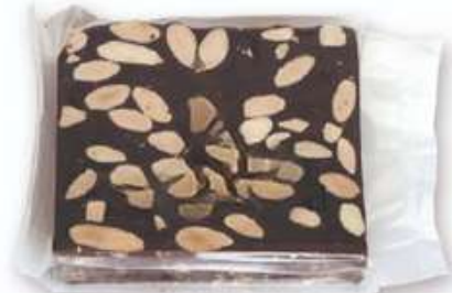
Corte turrón Chocolate Almendra 150g En bolsa Rilsan: PV: 6,60€ En caja: PV: 6,85€