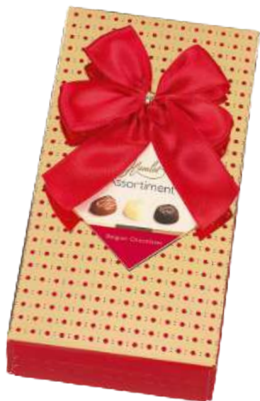
Caja surtido bombones Hamlet 125g REF-HT125 PV: 5,45€