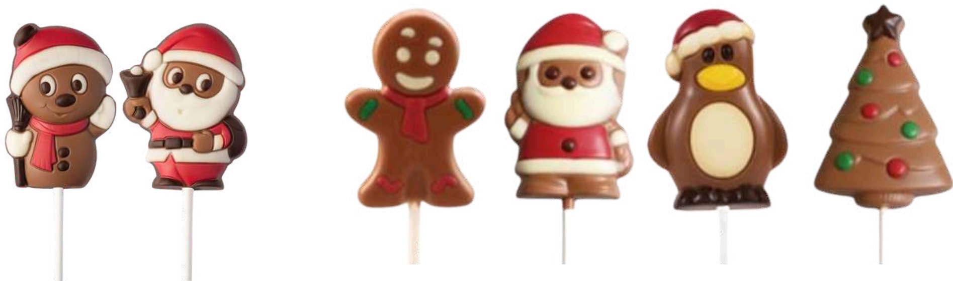
Piruletas Figuras navideñas 25g (36 unid) Envueltas individualmente en papel transparente. REF- 071 PV: 2,15€/unidad Caja 36 uds: 77,40€ Pedido mínimo: 72 uds. (2 cajas)