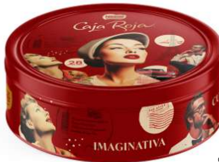
Caja Roja Metálica 250g REF- NT3 PV: 12,95€