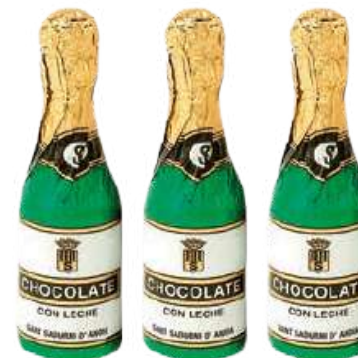
Botellas Chocolate 9,5 cm x 3 cm ancho (18g - 30 unid) REF- CH007 PV: 0,85€/unidad Tarro 30 unid: 25,50€