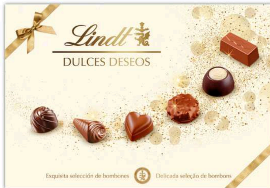
Bombones Dulces Deseos 337g Lindt REF- LT337 PV: 17,50€