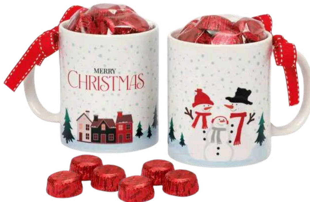
Taza de cerámica con 6 bombones, lazo y mensaje navideño. Medidas 12x9'5x8 cm REF- GB3 PV: 11,20€