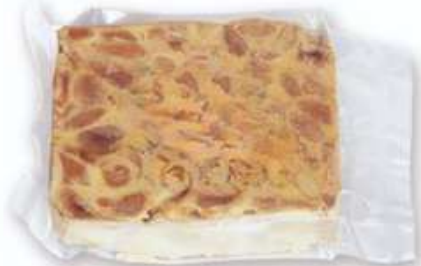
Corte turrón Alicante 150g En bolsa Rilsan: PV: 6,20€ En caja: PV: 6,40€