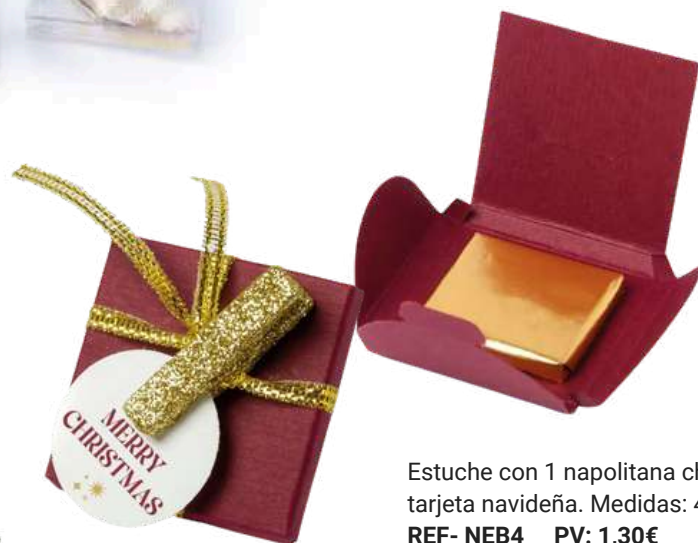
Estuche con 1 napolitana chocolate con leche y tarjeta navideña. Medidas: 4,6x4x6 cm REF- NEB4 PV: 1,30€