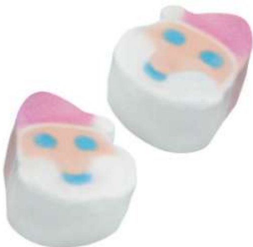
Papá Noel Nubes. Bolsa 1Kg (SIN GLUTEN) REF-NVG1 PV: 8,50€ Pedido mínimo: 6 bolsas