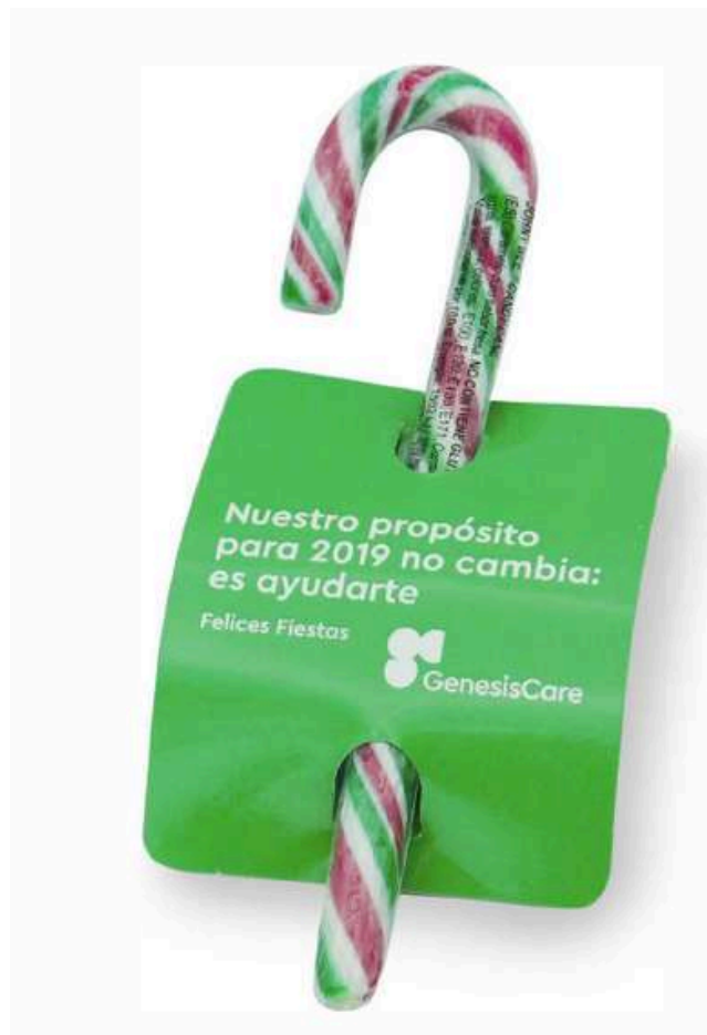
STICK NAVIDAD CARAMELO 13x3mm. Peso: 12 g. Targeta cuatricromía 1 cara. REF-BCP11 Consultar tarifas. A partir de 800 unid