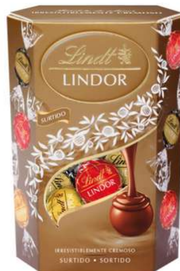
Caja surtido bombones Lindor 200g Bombones de chocolate con leche, blanco y negro con relleno cremoso REF- LT137 PV: 6,99€