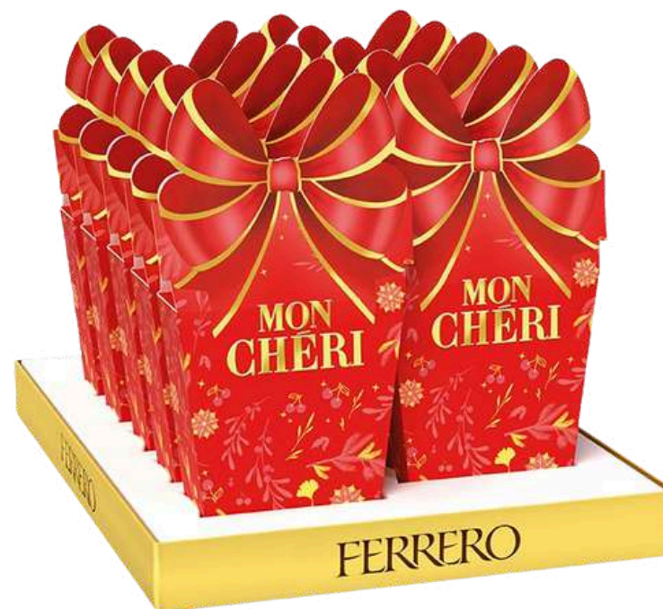
Caja bombones Mon Cheri 126g REF- MCH126 PV: 7,49€ Pedido Mínimo: 10 uds (1 caja)