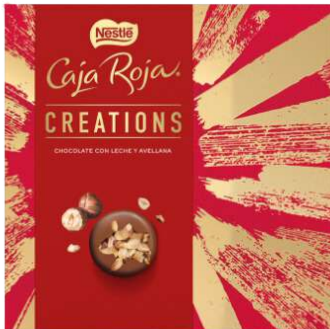
Caja Roja Creations 111g REF- NT1 PV: 6,85€