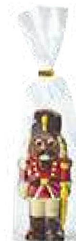
FIGURA CASCANUECES 100G (Caja de 6uds) REF-XMF100 PV: 7,60€/unidad Caja: 45,60€ Pedido Mínimo: 12 uds. (2 cajas)