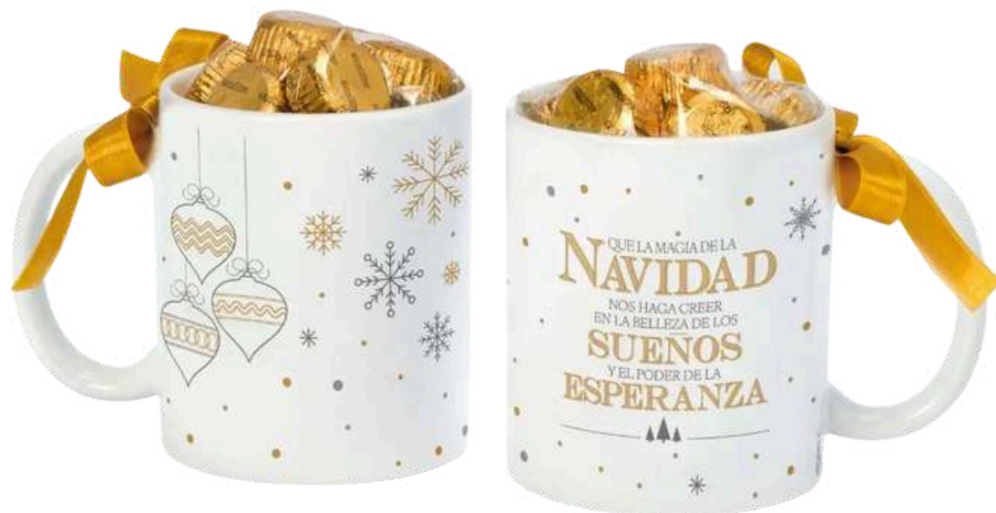
Taza de cerámica con 6 bombones, lazo y mensaje navideño. Medidas 12x9'5x8 cm REF- GB5 PV: 11,20€