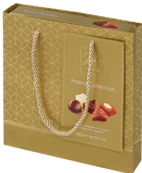
Caja surtido bombones Hamlet 200g REF-HT200B PV: 9,90€