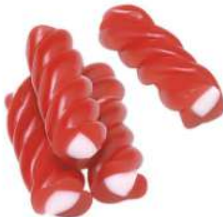
Torcidos fresa 1,6Kg (SIN GLUTEN) REF-NVG9 PV: 11,75€ Pedido mínimo: 6 kg