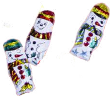
Muecos de nieve chocolate (5g - 195unid x bolsa aprox.) REF- CH002 PV: 0,13€/unidad Bolsa: 25,35€