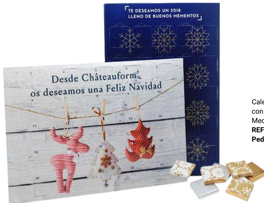
Calendario de adviento personalizable y relleno de napolitanas también con papel personalizado de chocolate con leche, negro o orgánico. Medidas aprox: 32x22x1cm REF- CAPCH11 PV: 20,90€ Pedido mínimo: 100 uds.

*Precio escalado según uds. Consultar para cantidades mayores.