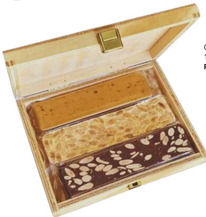
Caja de madera 3 turrones 3x150g=450g 1 Jijona / 1 Alicante / 1 Chocolate Almendra REF - CM36137 PV: 23,80€