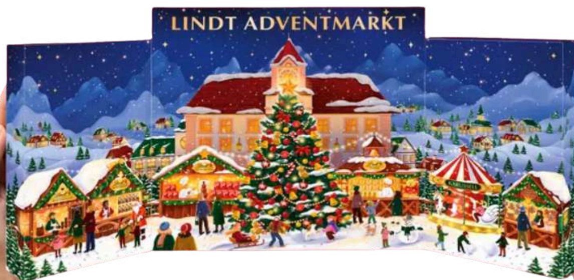
Calendario de Adviento Chocolate Lindt 304g REF- LDT304 PV: 39,90€