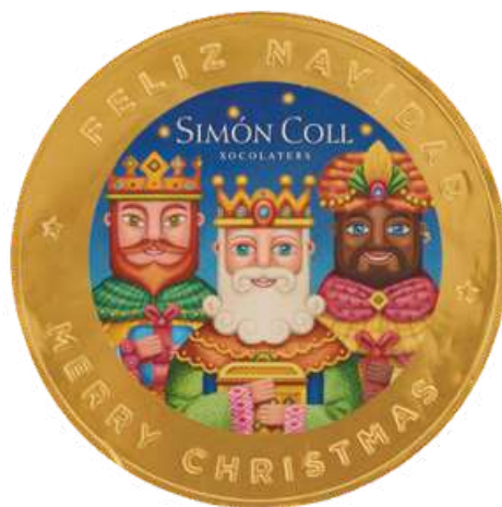
MEDALLON REYES MAGOS CHOCO 10 cm 60g 15 unid. REF-XM5 PV: 2,19€/moneda Pedido mínimo: 45 monedas