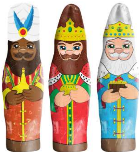
REYES MAGOS CHOCO 60g REF-XM4 PV: 1,20€/unid Tarro 30 unid: 36€