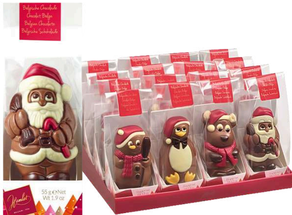
FIGURAS NAVIDEÑAS CHOCOLATE BELGA 55G (Caja de 16uds) REF-XMF55 PV: 3,20€/unidad Caja: 51,20€ Pedido Mínimo: 32 uds. (2 cajas)