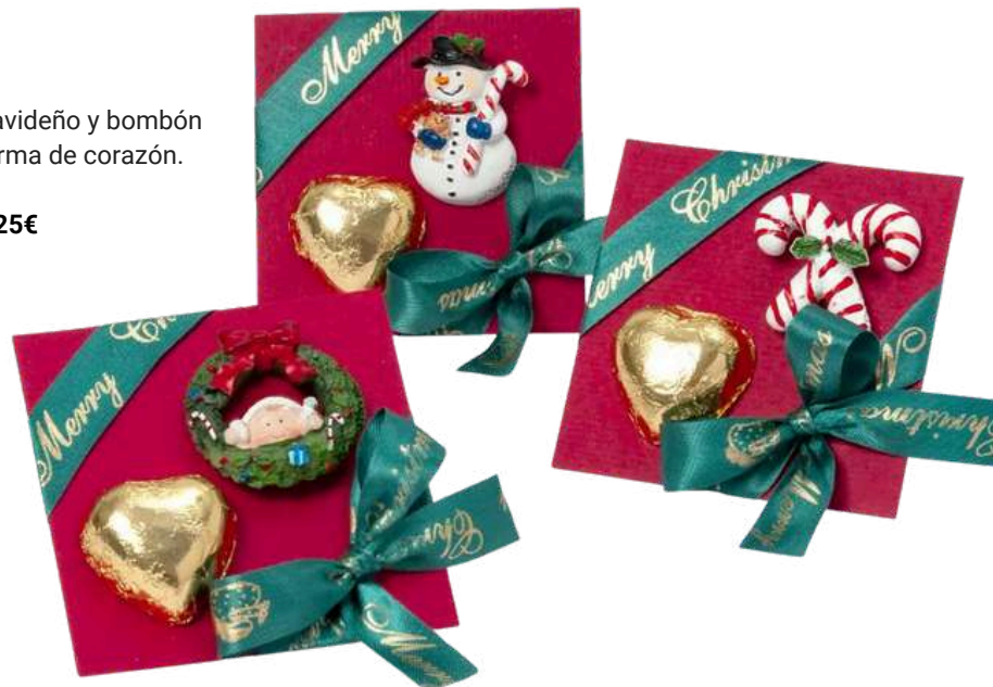
Postal con imán navideño y bombón de chocolate en forma de corazón. Medidas: 8X8 cm. REF- ZB2 PV: 2,25€