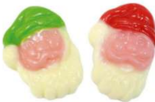
Papá Noel gominola sabor a fresa y manzana Bolsa 1Kg (SIN GLUTEN) REF-NVG4 PV: 8,25€ Pedido mínimo: 6 bolsas