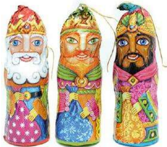
REYES MAGOS CHOCO 25g REF-XM2 PV: 0,90€/unid Tarro 20 unid: 18€