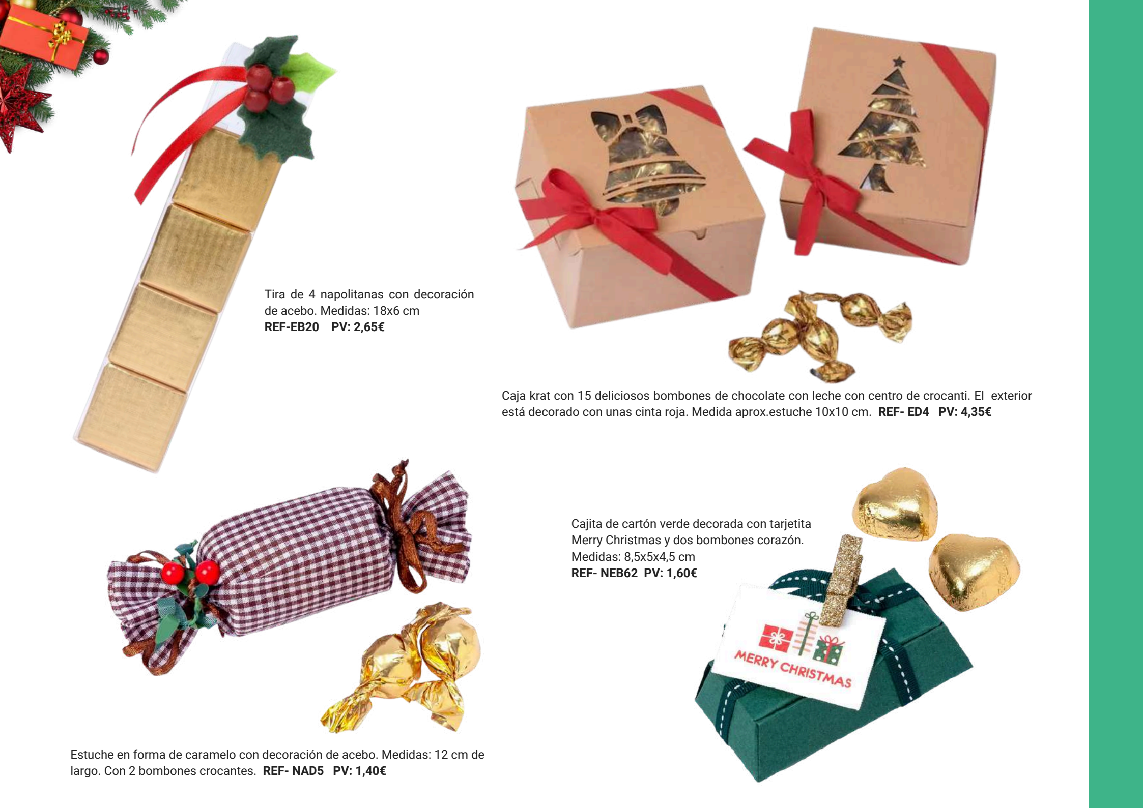
Tira de 4 napolitanas con decoración de acebo. Medidas: 18x6 cm REF-EB20 PV: 2,65€