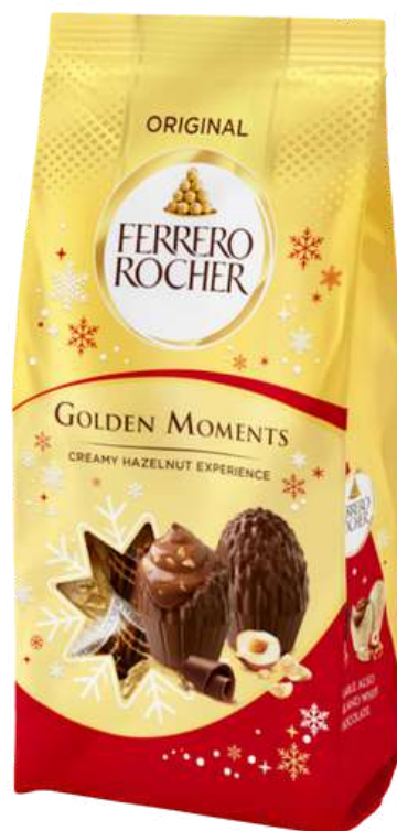
Caja bombones Ferrero Rocher GOLDEN MOMENTS 90g REF- FR90 PV: 4,50€