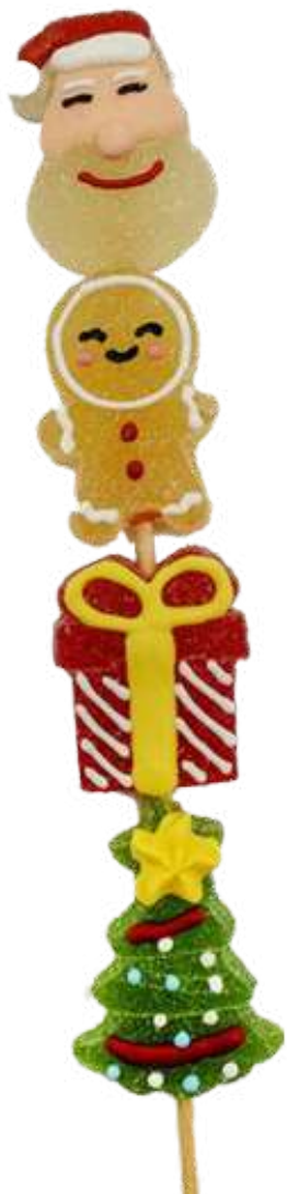
PINCHO JELLY NAVIDAD 60g Caja: 12 unid. (SIN GLUTEN) REF-BCN601 PV: 1,39€/unid Pedido mínimo: 48 unid