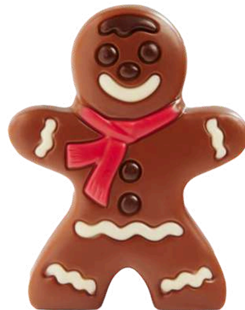
FIGURAS GALLETA DE JENGIBRE CHOCO 60G (10uds) REF-XMR60 PV: 4,60€/unidad Caja: 46€ Pedido Mínimo: 30 uds.