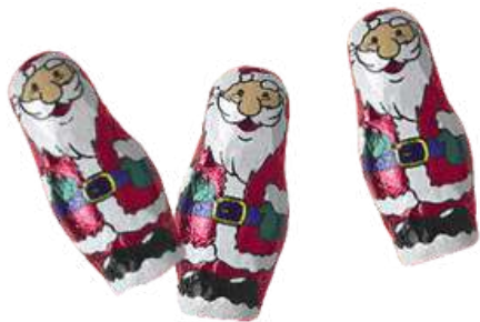
Santa Claus de chocolate (5g - 195unid x bolsa aprox.) REF- CH001 PV: 0,13€/unidad Bolsa: 25,35€