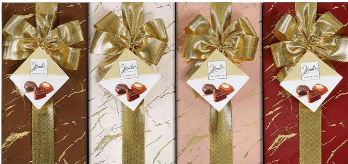
Cajas surtidas con variedad de bombones Hamlet 200g REF-HT200 PV: 9,90€ Pedido mínimo: 12 unidades