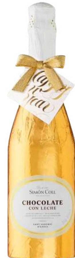
Botella gigante Chocolate 300g 31,5cm alto x 9cm ancho REF- CH009 PV: 13,50€/unidad Pedido Mínimo: 6 botellas