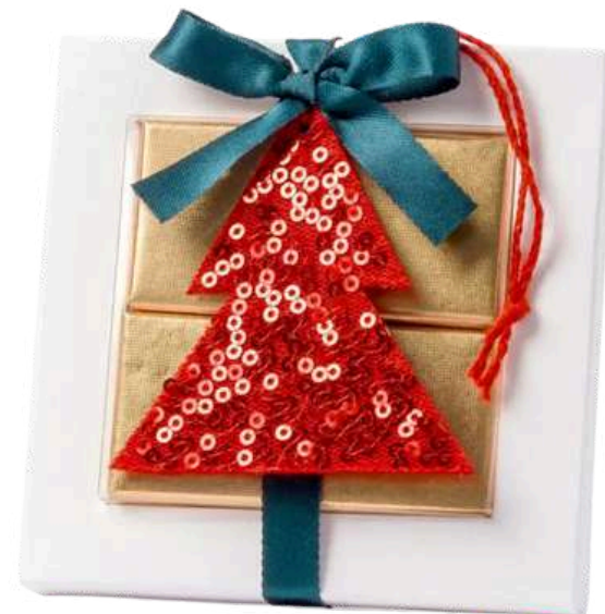
Estuches con 4 napolitanas chocolate con leche y árbol rojo lentejuelas. Medidas: 10x10x2,5 cm REF- NAB41 PV: 3,40€