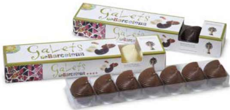
ESTUCHES GALETS DE CHOCOLATE BLANCO, NEGRO Y CON LECHE 112g REF-XMG112 PV: 6,45€/caja Pedido Mínimo: 21 cajas