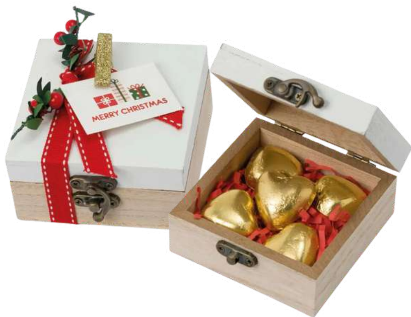
Caja de madera con decoración navideña y tarjeta con el mensaje Merry Christmas. Dentro de la caja hay 5 bombones en forma de corazón rellenos de praliné de avellana. Medidas: 9x5x9 cm. REF- WB49 PV: 5,95€