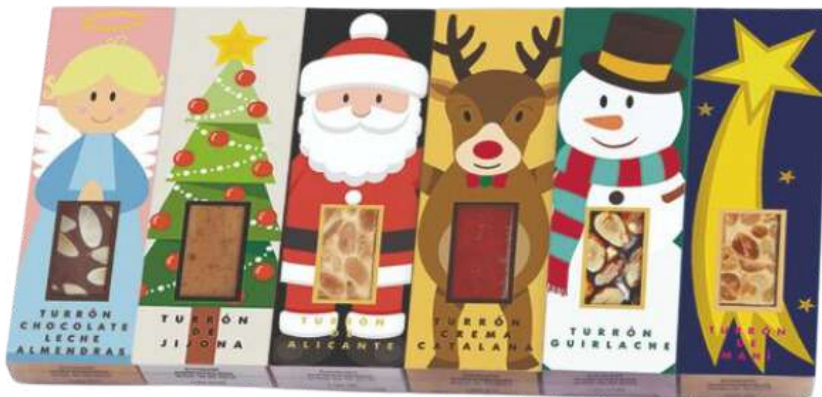
Set 6 mini turróns 6x50g=300g NAVIDAD REF - ST278 PV: 18,50€