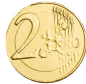
MONEDAS CHOCOLATE CON LECHE 36MM. Bolsa: 200 unid REF-XM9 PV: 0,13€/unid Precio bolsa: 26€ Pedido mínimo: 5 bolsas