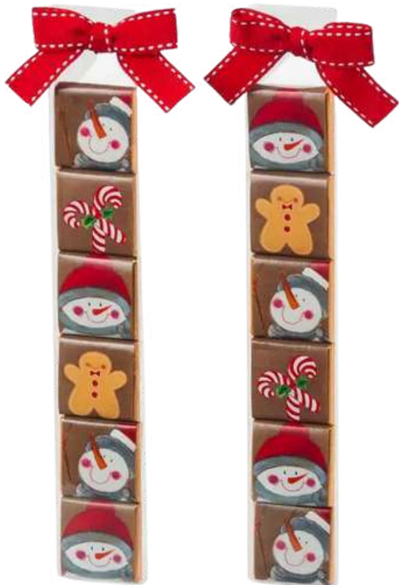
Estuche con 6 napolitanas de chocolate con leche al 32% de cacao con diseños navideños. REF- N178. PV: 2,75€