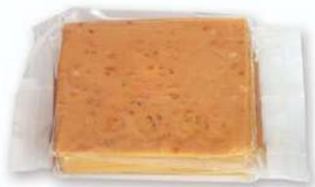
Corte turrón Jijona 150g En bolsa Rilsan: PV: 6,20€ En caja: PV: 6,40€