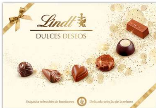
Bombones Dulces Deseos 143g Lindt REF- LT143 PV: 9,10€