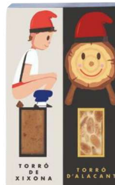
Set 2 mini turróns 2x50g=100g TIÓ REF - ST299 PV: 6,90€