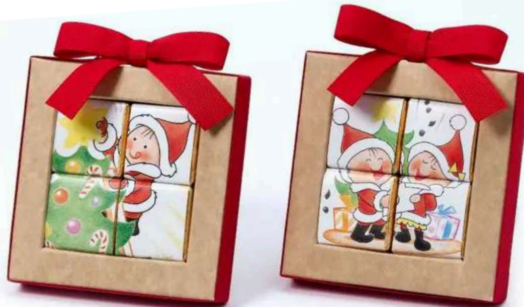
Estuches color kraft con 4 chocolatinas de chocolate con leche al 32% con diseño de puzzle. Se venden en packs de 2 unidades, con los 2 modelos. Medidas: 10x11x2 cm REF- EB3140 PV: 2,45€

Chocolatinas a granel de chocolate con leche al 32% de cacao con diseños navideños. Aprox. 150 chocolatinas. Cada modelo se vende por separado. PV: 44€/bolsa