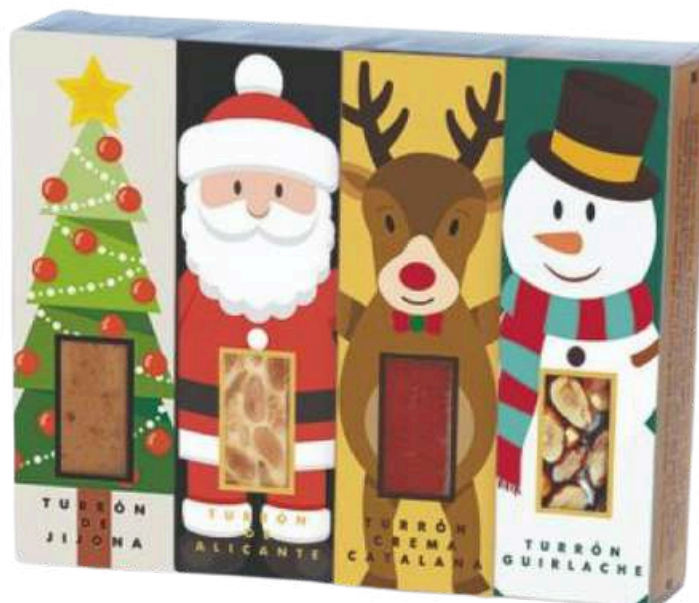
Set 4 mini turróns 4x50g=200g NAVIDAD REF - ST277 PV: 12,60€