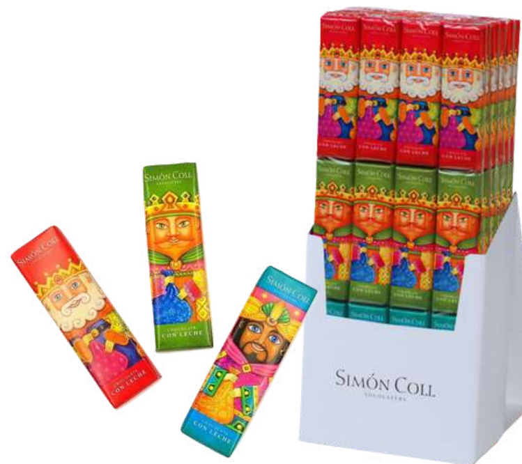
TIRA DE 3 CHOCOLATINAS REYES MAGOS CHOCO 3x18g REF-XM6 PV: 2,30€/unid Caja: 24 unid: 55,20€