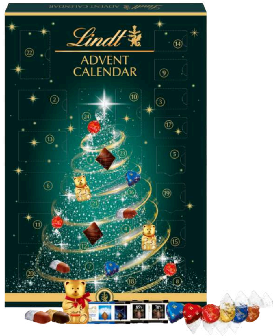
Calendario de Adviento Fábrica de Chocolate Lindt 221g REF- LDT221 PV: 22,80€