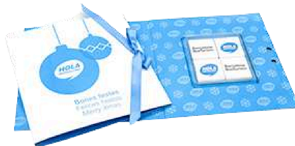
Postal Rectangular o Cuadrada con 4 napolitanas de chocolate y mensaje navideño. Medidas aprox.: 16x16x1 cm. (cuadrada) 21x10x8 cm. (rectangular) REF - P4N Consultar tarifas según cantidad Pedido mínimo: 100 unidades