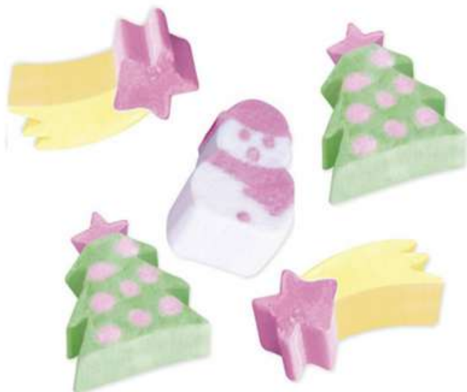
Marshmallows navideñas (125 unid) (SIN GLUTEN) REF-NVMV PV: 8,75€ Pedido mínimo: 6 bolsas