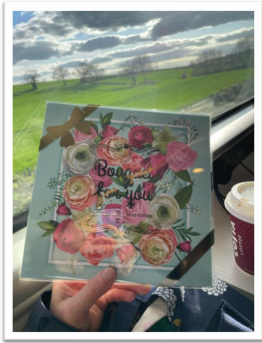
圖 2 - 南下服事旅程 17-20/4/2026