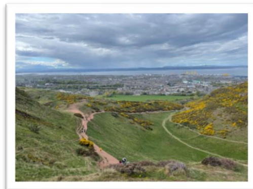
圖 1 - 鍛鍊身體由行山 1 小時開始

因培養了拉筋習慣一段時間，在這次患病和睡床的日子，為未有引起腰痛舊患而感恩。但停了運動兩個月加上忙於不同事，現重新計劃每天要至少散步半小時，逐步加增室內拉筋，現在住所附近是海邊，期望一天能夠開始跑步(因關節問題而目前暫未能夠)。