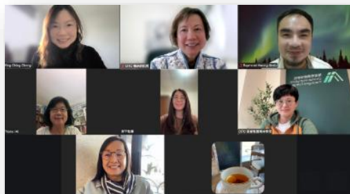
「兒童培育事工課程」(初階)老師和同工

自完成暑期不同事奉項目返抵愛丁堡，10 月初開始網上「兒童培育事工課程」(初階)，有來自蘇格蘭、英格蘭及北歐差不多 20 名學員參加，願主賜智慧和使用的！