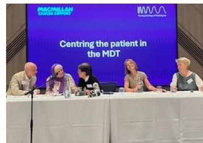
麥美倫 MDT 研討會 - 我獲邀以病人身份出席

五月藝術治療(用布纖維)：生命充滿選擇 - 某些人生軌跡是無得揀，例如：人種/性別/姓氏/高矮...(左圖)。但人可以選擇如何生活、用什麼材料、放入什麼色彩(右圖)。