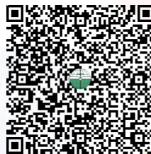
FPS QR code

把附有轉帳參考編號的圖像電郵 account@efchkomb.org.hk 或 WhatsApp (852) 5117 5709 本會， 並註明：①「澳門工場(陳樂寬)奉獻」 ②奉獻者姓名/單位名稱 ③通訊地址， 以便本會寄回收據予您。