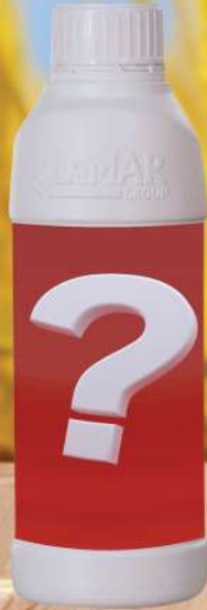
ميكس الجى كروب