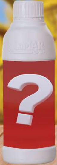
فاوندر بي كي