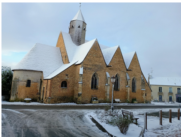
L'église de St Aubin des coudrais sous la neige