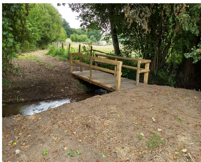
La passerelle sur le Rosay au Gué de L'Aunay