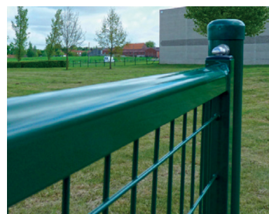
Détail lisse horizontale