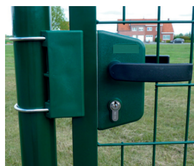
Boîte à serrure et poignée