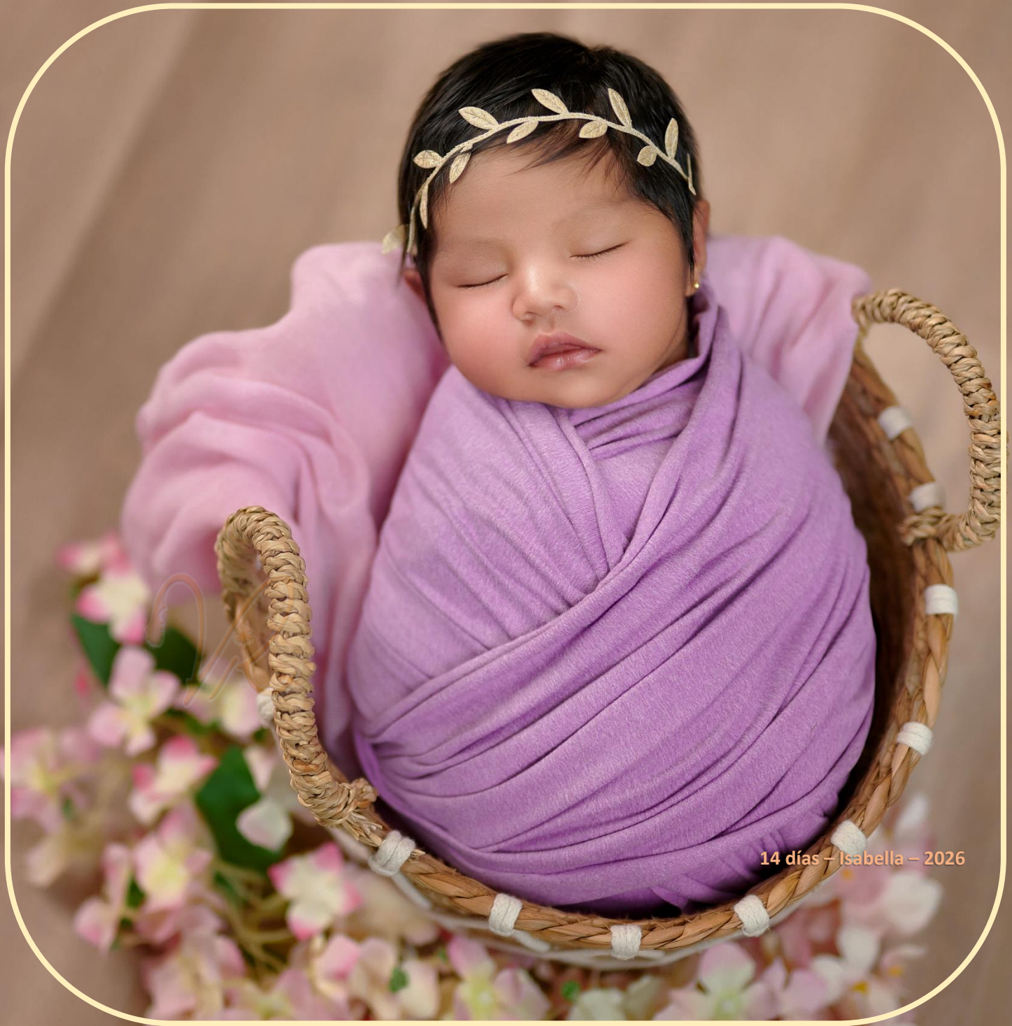
14 días - Isabella - 2026