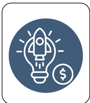
Derecho de Marcas